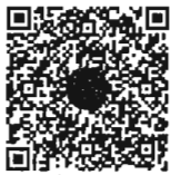
หนังสือนัดประชุม และระเบียบวาระการประชุม ร่วมกันของรัฐสภา

หมายเหตุ เอกสารประกอบการประชุมร่วมกันของรัฐสภา ได้เผยแพร่ทางสื่ออิเล็กทรอนิกส์ ตามข้อบังคับการประชุมรัฐสภา พ.ศ. ๒๕๖๓ ข้อ ๑๓ โดยท่านสมาชิกฯ สามารถอ่านเอกสารประกอบการประชุมได้ โดยการสแกน QR code ที่ปรากฏอยู่ในหนังสือนัดประชุม หรือทาง www.parliament.go.th