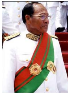
สมเด็จจ้อกรมหาพญาจักรี เฮง สัมริน ประธานสภาแห่งชาติ

ประธานสภาแห่งชาติแห่งราชอาณาจักรกัมพูชาคนปัจจุบันคือ สมเด็จจ้อกรมหาพญาจักรี เฮง สัมริน (Samdech Agga Moha Ponhea Chakrei HENG SAMRIN) โดยมีที่มาจากการเลือกตั้งของสมาชิกสภาแห่งชาติและมีวาระการดำรงตำแหน่ง ๕ ปี