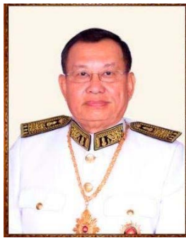
สมเด็จ สาย ชุม (SamDech SAY CHHUM) ๔

วุฒิสภาแห่งราชอาณาจักรกัมพูชา ชุดที่ ๒ ประกอบด้วยสมาชิก จำนวนทั้งสิ้น ๖๑ คน ซึ่งมีจำนวนเท่ากับครึ่งหนึ่งของสมาชิกสภาแห่งชาติกัมพูชาชุดปัจจุบัน ที่มีจำนวนทั้งสิ้น ๑๒๓ คน