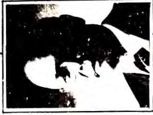
นายโกเมน ภัทรภิรมย์ อัยการสูงสุด