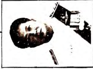
นายประมาท ฐันตื้อ ประธานศาลฎีกา