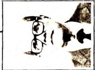
พลโทสมิง ไคลังคะ