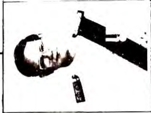
นายมีชัย ฤชุพันธ์ ประธานวุฒิสภา