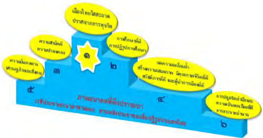
ภาพ ๑ สรุปผลการจัดอันดับข้อมูลภาพอนาคตที่พึงปรารถนาของประชาชน ที่เข้าร่วมเวทีประชาเสวนาให้ความสำคัญมากที่สุด

ข้อมูลข้างต้นแสดงให้เห็นว่า เรื่องของการทุจริตยังคงเป็นปัญหาสำคัญของประเทศ โดยสะท้อนได้จากพื้นที่จัดเวที ๘ ใน ๑๐ ที่ระบุถึงความต้องการเห็นเมืองไทยใสสะอาด ปราศจากการทุจริต ภาพอนาคตที่ประชาชนต้องการเห็น และให้ค่าสำคัญซึ่งใกล้เคียงกับเรื่องการทุจริตลำดับถัดมา คือ เรื่องของการศึกษาที่ดี และการปฏิรูปการศึกษา สะท้อนว่า ประชาชนมีความต้องการให้เกิดการพัฒนาให้ถึงระดับตัวบุคคล มองเรื่องการศึกษาเป็นเรื่องสำคัญ ในขณะที่ประเด็นเรื่องความสำคัญและความปรองดองถูกจัดไว้เป็นลำดับที่สาม อย่างไรก็ตาม หากพิจารณาข้อมูลของอันดับความสำคัญในแต่ละประเด็นที่จำแนกตามพื้นที่จัดเวทีแล้ว จะพบว่ามีความแตกต่างกันไปตามบริบทพื้นที่ด้วย ดังแสดงในภาพ ๒