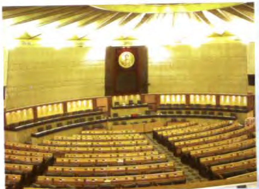
ภายในห้องประชุมรัฐสภา