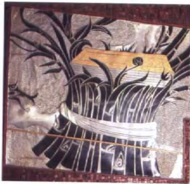
ภาพรัฐธรรมนูญ ซึ่งเป็นกฎหมายสูงสุดของประเทศ วางอยู่บนมัดของ ธัญพืชเป็นสัญลักษณ์ของสังคมและการกสิกรรมของเรา