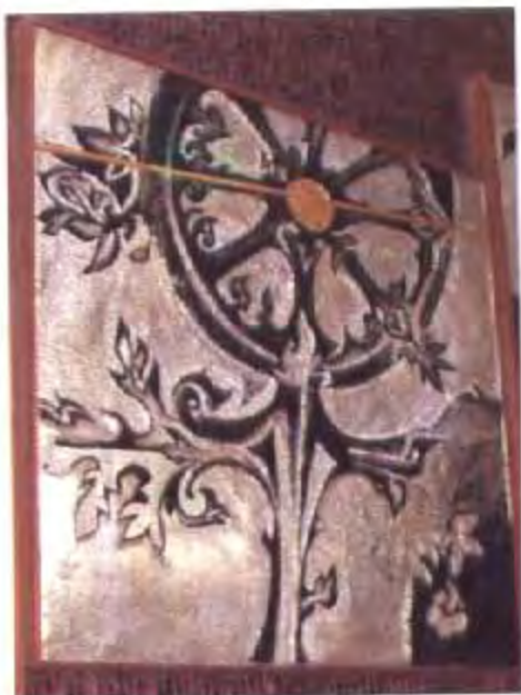
ภาพวงล้อธรรมจักรและสัญลักษณ์ของศาสนาอื่น แสดงด้วยรูปกางเขนและเรือเตา ทั้งหมดนี้ หมายถึง ธรรมประจำใจของประชาชนในชาติ