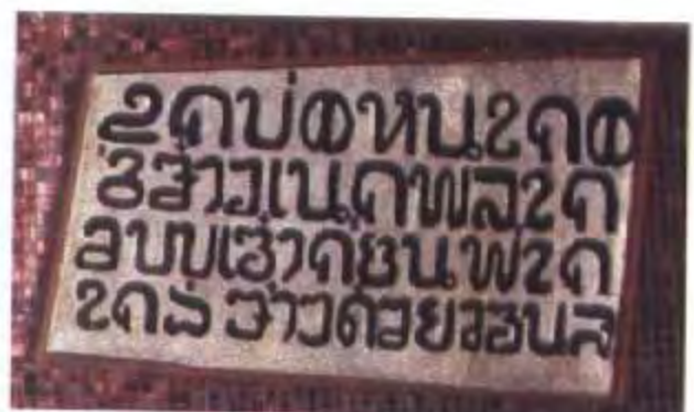
ภาพอักษรจากศิลาจารึกของ พ่อขุนรามคำแหง คัดลอกมาจากบรรทัดที่ว่า “พ่อขุนฯ ขันช้างเข้ากระทำการยุทธหัตถี กับขุนสามชน” เป็นสัญลักษณ์แสดงถึง อธิปไตยความเป็นไทย ความมั่นคง และ การเตรียมการป้องกันประเทศของชาวไทย