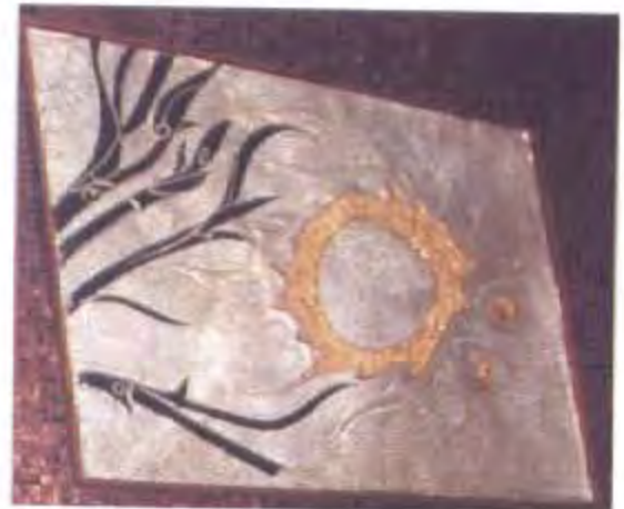
ภาพพระอาทิตย์ส่องแสงเต็มดวง แสดงถึงความสามัคคีอันจะนำมาสู่ความ เจริญรุ่งเรือง