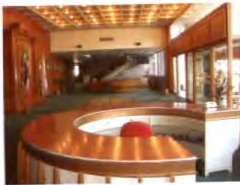
บริเวณด้านหน้าห้อง ประชุมรัฐสภา