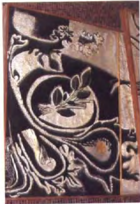
ภาพใบไม้กิ่งจากกิ่ง หมายถึง การเริ่มต้นใหม่ของความเจริญของประเทศ