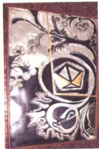
ภาพสัญลักษณ์ของการค้าและเศรษฐกิจ ทั้งหมดอยู่ในความเสมอภาคและความเป็นธรรม แสดงออกด้วยรูปซึ่งวางไว้บนแกนสมดุลแบบดาซังคูลาการ