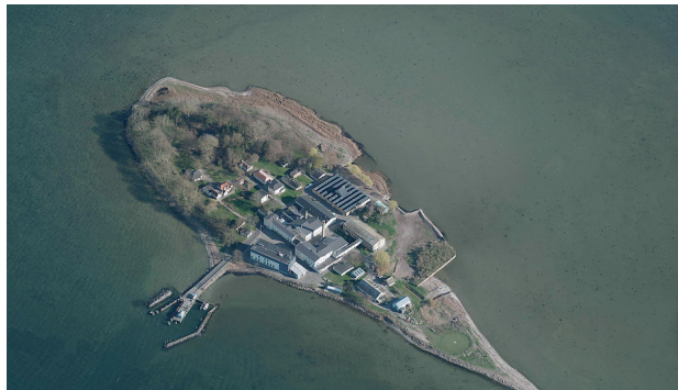
เกาะลินด์โฮล์ม

วันที่ ๒๐ ธันวาคม ๒๕๖๑ รัฐสภาเดนมาร์กได้อนุมัติแผนงบประมาณประจำปี ๒๐๑๙ ของรัฐบาล ซึ่งหนึ่งในนั้นมีแผนดำเนินการปรับเปลี่ยนศูนย์วิจัยโรคระบาดบนเกาะลินด์โฮล์ม นอกชายฝั่งทางไกลกลางทะเลนอกคาบสมุทรจัตแลนด์ ซึ่งเป็นที่ตั้งของศูนย์วิจัยโรคระบาดในสัตว์ ให้กลายเป็นสถานที่รองรับกลุ่มผู้อพยพชาวมุสลิม และอาชญากรต่างชาติราว ๑๐๐ คนที่รัฐบาลเดนมาร์กไม่สามารถผลักดันออกนอกประเทศได้ แผนการเนรเทศดังกล่าวนี้ ได้รับเสียงวิจารณ์อย่างมาก เนื่องจากกังวลว่าแผนดังกล่าวอาจจะเข้าข่ายที่รัฐบาลเดนมาร์กละเมิดอนุสัญญาเจนีวา ที่ว่าด้วยการห้ามคุมขังโดยมิชอบ และเป็นการกระทำที่ไร้มนุษยธรรม