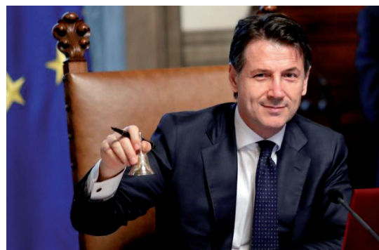
นายจูเซปเป คอนเต

ความเคลื่อนไหวดังกล่าวมีขึ้น หลังจากเมื่อเดือนพฤศจิกายน EU ได้ปฏิเสธที่จะให้การรับรองงบประมาณประจำปี ๒๕๖๒ ของอิตาลี พร้อมกับประกาศเตรียมลงโทษอิตาลีด้วยการตั้งปรับเนื่องจากร่างงบประมาณดังกล่าวขัดต่อกฎหมายทางการเงินของ EU หลังจากที่รัฐบาลอิตาลีได้เพิ่มตัวเลขขาดดุลงบประมาณสู่ระดับ ๒.๔ เปอร์เซ็นต์ ของผลิตภัณฑ์มวลรวมภายในประเทศ (GDP) ในปี ๒๕๖๒ ซึ่งสูงกว่าตัวเลขขาดดุลงบประมาณ ๐.๘ เปอร์เซ็นต์ ของ GDP ของรัฐบาลชุดเดิม นอกจากนี้ ร่างงบประมาณฉบับเดิมของอิตาลี