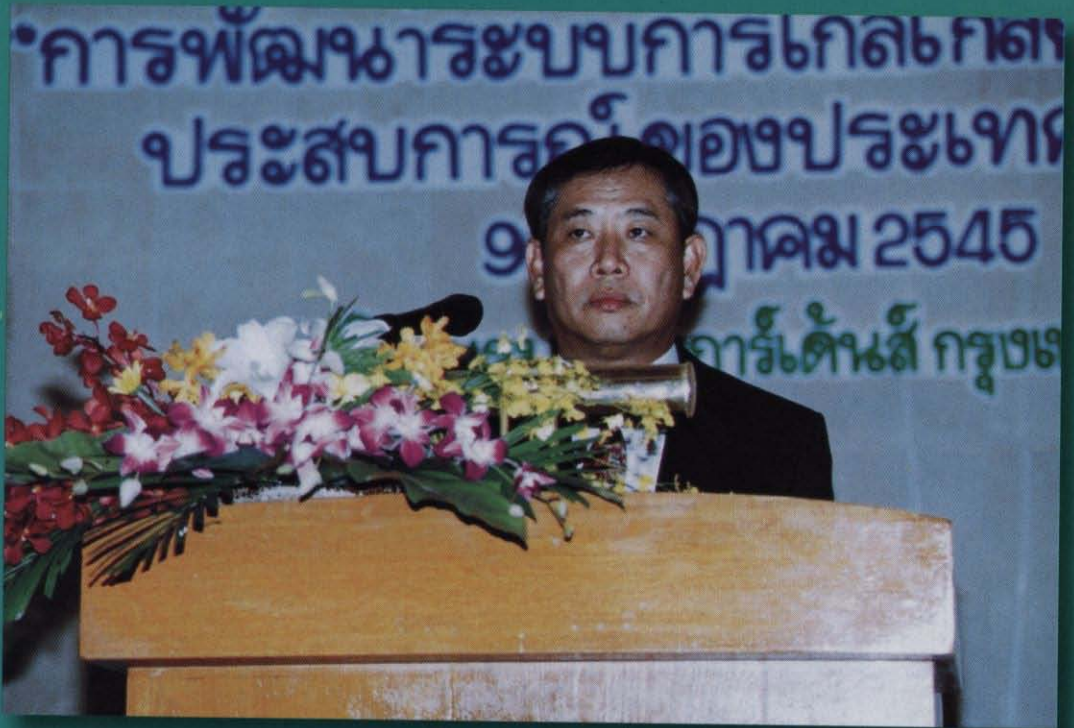
นายกรองเกียรติ คมสัน เลขานุการสำนักงานศาลยุติธรรม