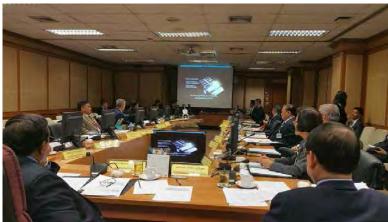
การประชุมคณะกรรมการเพื่อการพิจารณาเกี่ยวกับ ดาวเทียมสื่อสารและกิจการอวกาศของประเทศไทย