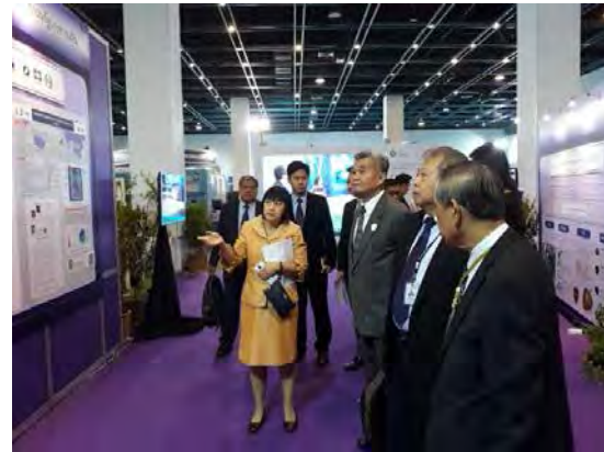
ศึกษาดูงานและเยี่ยมชมนิทรรศการผลงานวิจัยด้านวิทยาศาสตร์ เทคโนโลยี และนวัตกรรม ณ อุทยานวิทยาศาสตร์ประเทศไทย จังหวัดปทุมธานี