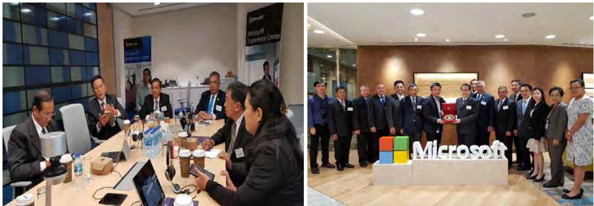
การศึกษาดูงานการใช้งานระบบการประชุมรูปแบบอิเล็กทรอนิกส์ (e - Meeting) ณ บริษัท ไมโครซอฟท์ (ประเทศไทย) จำกัด