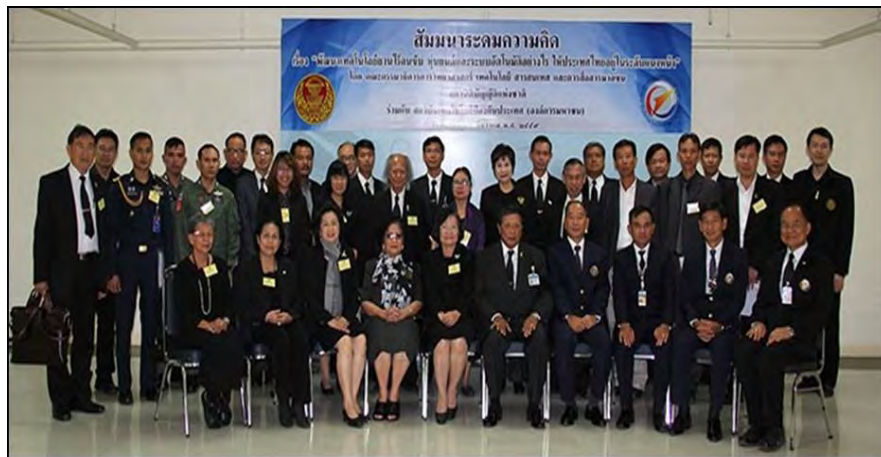
การสัมมนาระดมความคิดเรื่อง “พัฒนาเทคโนโลยียานไร้คนขับ หุ่นยนต์ และระบบอัตโนมัติอย่างไร ให้ประเทศไทยอยู่ในระดับแนวหน้า” ณ สถาบันเทคโนโลยีป้องกันประเทศ (องค์การมหาชน)