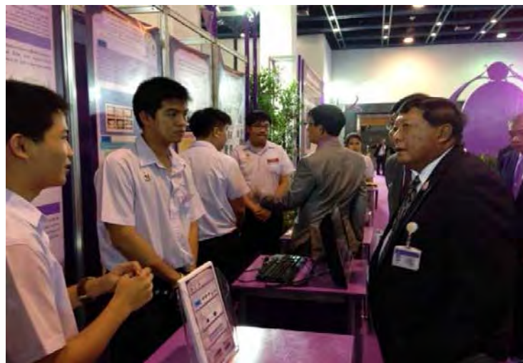
การศึกษาดูงานและเยี่ยมชมนิทรรศการ ณ อุทยานวิทยาศาสตร์ จ.ปทุมธานี