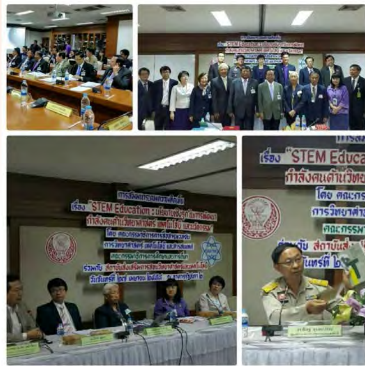
การสัมมนาเรื่อง STEM Education นโยบายเชิงรุกในการพัฒนากำลังคน ด้านวิทยาศาสตร์ เทคโนโลยี และนวัตกรรม