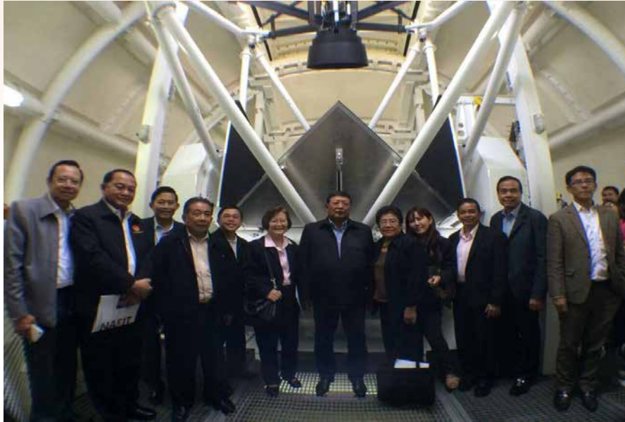
การเดินทางศึกษาดูงาน ณ สถาบันดาราศาสตร์ จังหวัดเชียงใหม่

ของคณะกรรมการการการวิทยาศาสตร์ เทคโนโลยี สารสนเทศ และการสื่อสารมวลชน