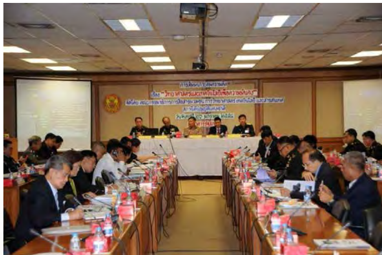
การสัมมนาเรื่อง “วิทยาศาสตร์และเทคโนโลยีเพื่อความมั่นคง”