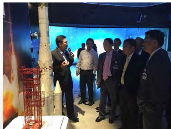
ศึกษาดูงานการใช้เทคโนโลยีดาวเทียมและการให้บริการสถานีดาวเทียมภาคพื้นดิน ของบริษัท กสท โทรคมนาคม จำกัด (มหาชน) ณ สถานีดาวเทียมนนทบุรี จังหวัดนนทบุรี