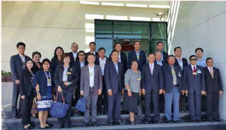
การศึกษาดูงานเกี่ยวกับระบบการดำเนินงานของศูนย์กระจายสินค้าของบริษัท ซีพี ออลล์ จำกัด (มหาชน) เขตลาดกระบัง กรุงเทพฯ