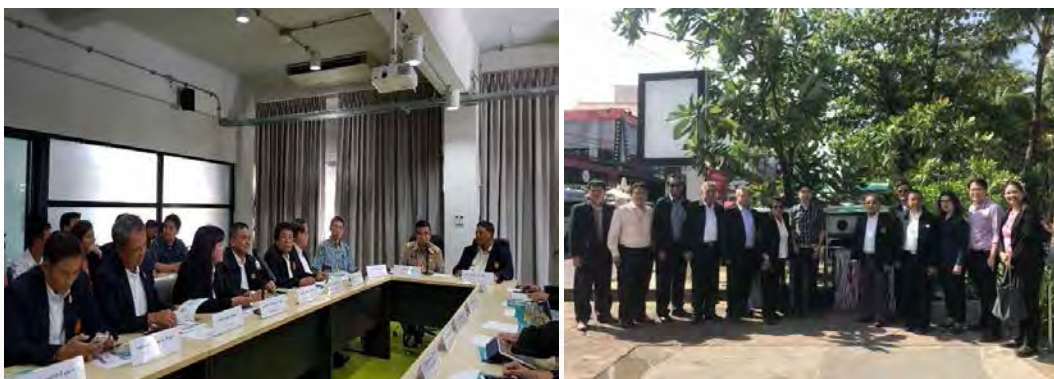
ศึกษาดูงานการดำเนินงานของโครงการส่งเสริมพื้นที่พิเศษสำหรับเศรษฐกิจดิจิทัล (Smart City) ณ จังหวัดภูเก็ต