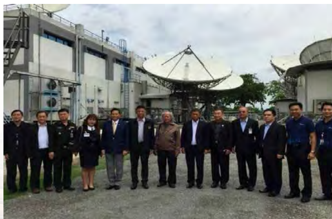
การศึกษาดูงานเกี่ยวกับการใช้ประโยชน์จากดาวเทียม ณ สถานีบริการภาคพื้นดินดาวเทียมไทยคม จังหวัดปทุมธานี