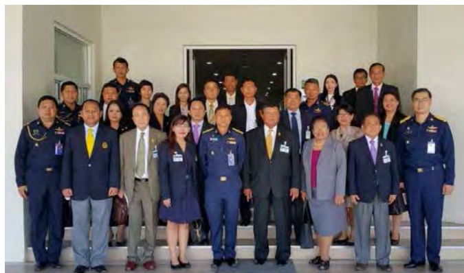
การศึกษาดูงานด้านเทคโนโลยีเพื่อความมั่นคงในส่วนของการทำงาน ของศูนย์ปฏิบัติการกองทัพอากาศ กองทัพอากาศ เขตดอนเมือง กรุงเทพฯ