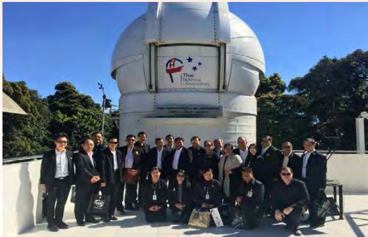
การศึกษาดูงานเกี่ยวกับการเฝ้าระวังวัตถุใกล้โลกและวัตถุอวกาศ รวมถึงการวิจัยและพัฒนาด้านดาราศาสตร์ ณ จังหวัดเชียงใหม่