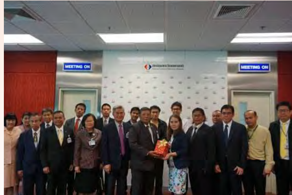
ศึกษาดูงานด้านเทคโนโลยีและระบบมาตรฐานของประเทศ ณ สถาบันมาตรวิทยาแห่งชาติ กระทรวงวิทยาศาสตร์และเทคโนโลยี จังหวัดปทุมธานี