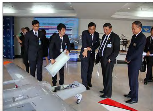
การศึกษาดูงานเกี่ยวกับการพัฒนาเทคโนโลยียานไร้คนขับ หุ่นยนต์ และระบบอัตโนมัติ ณ สถาบันเทคโนโลยีป้องกันประเทศ (องค์การมหาชน)