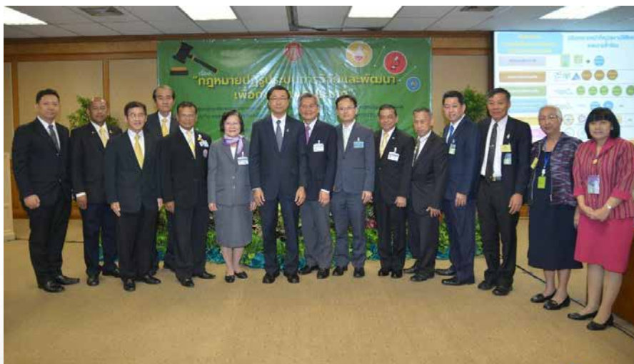
การเสวนาระดมความคิดเรื่อง “แนวทางการบัญญัติกฎหมายเพื่อกำกับดูแลสิ่งมีชีวิตดัดแปลงพันธุกรรม (GMOs)”