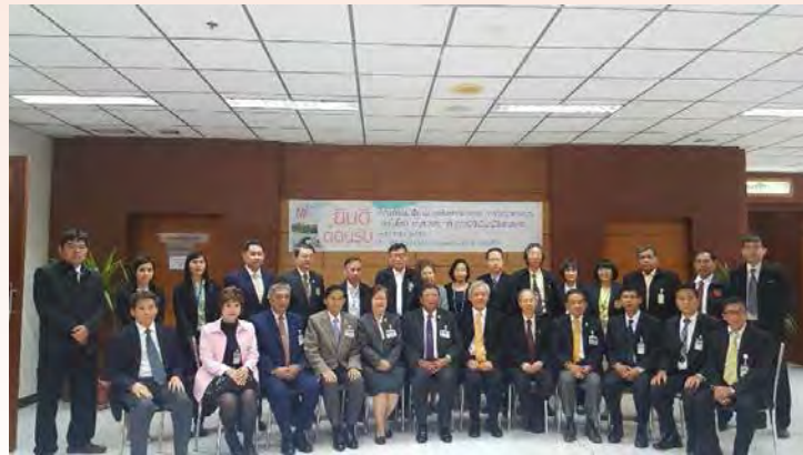
การศึกษาดูงานเกี่ยวกับความพร้อมของการพัฒนาวิทยาศาสตร์ เทคโนโลยี และนวัตกรรมในพื้นที่เขตกรุงเทพฯ ณ มหาวิทยาลัยเทคโนโลยีพระจอมเกล้าธนบุรี (มจร.)