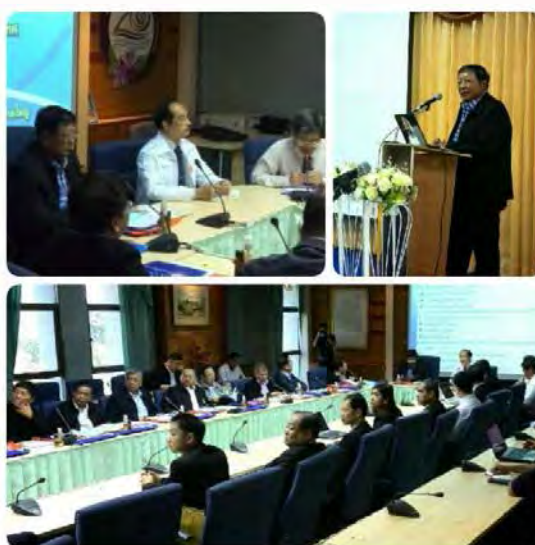
การศึกษาดูงานเกี่ยวกับวิทยาศาสตร์ เทคโนโลยี และนวัตกรรม เพื่อพัฒนาชุมชน ณ จังหวัดสงขลา