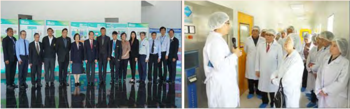
การเดินทางไปศึกษาดูงานด้านเทคโนโลยีวัคซีน ณ โรงงานผลิตวัคซีน องค์การเภสัชกรรม และศูนย์วิจัยไพรเมทแห่งชาติ จุฬาลงกรณ์มหาวิทยาลัย จังหวัดสระบุรี