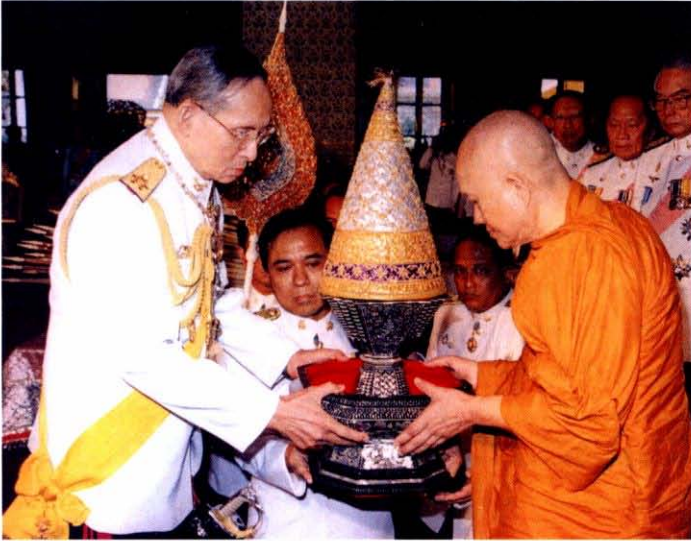
ภาพพระราชทาน ในวโรกาสที่พระธรรมปิฎก (ป. อ. ปยุตฺโต) ได้รับพระราชทานสถาปนาสมณศักดิ์ เป็นพระราชาคณะเจ้าคณะรอง ชั้นหิรัญบัฏ ที่ พระพรหมคุณาภรณ์ ณ พระที่นั่งอมรินทรวินิจฉัย ในพระบรมมหาราชวัง วันพฤหัสบดี ที่ ๑๒ สิงหาคม ๒๕๔๗