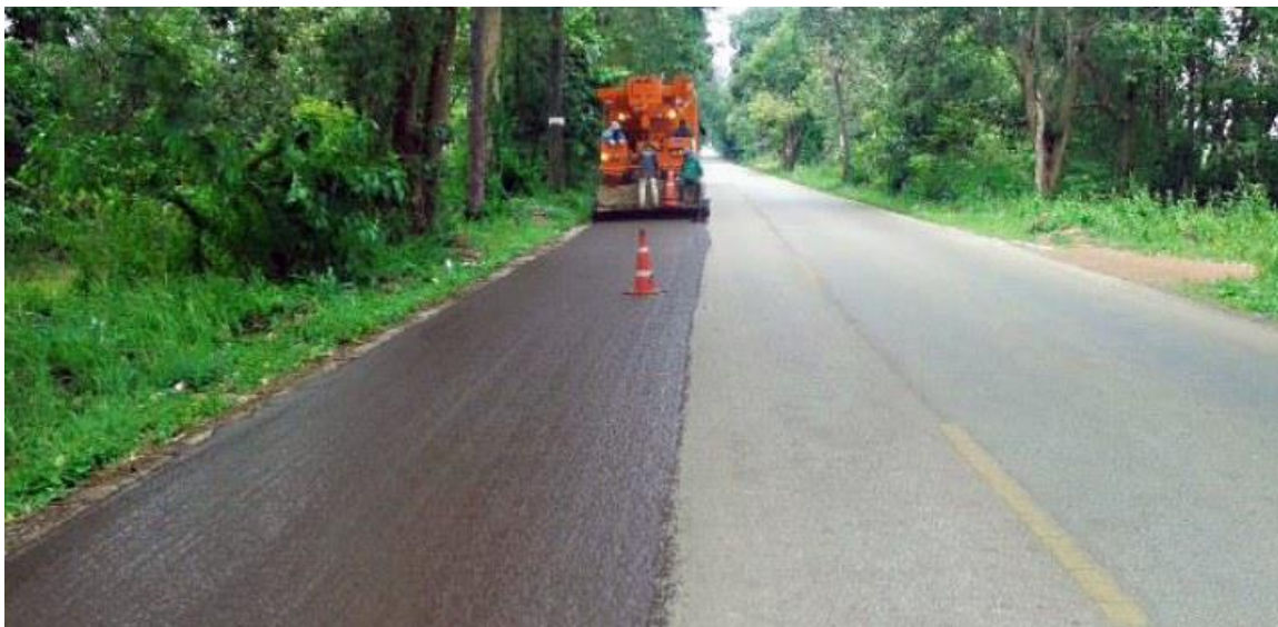
ถนนยางพารา