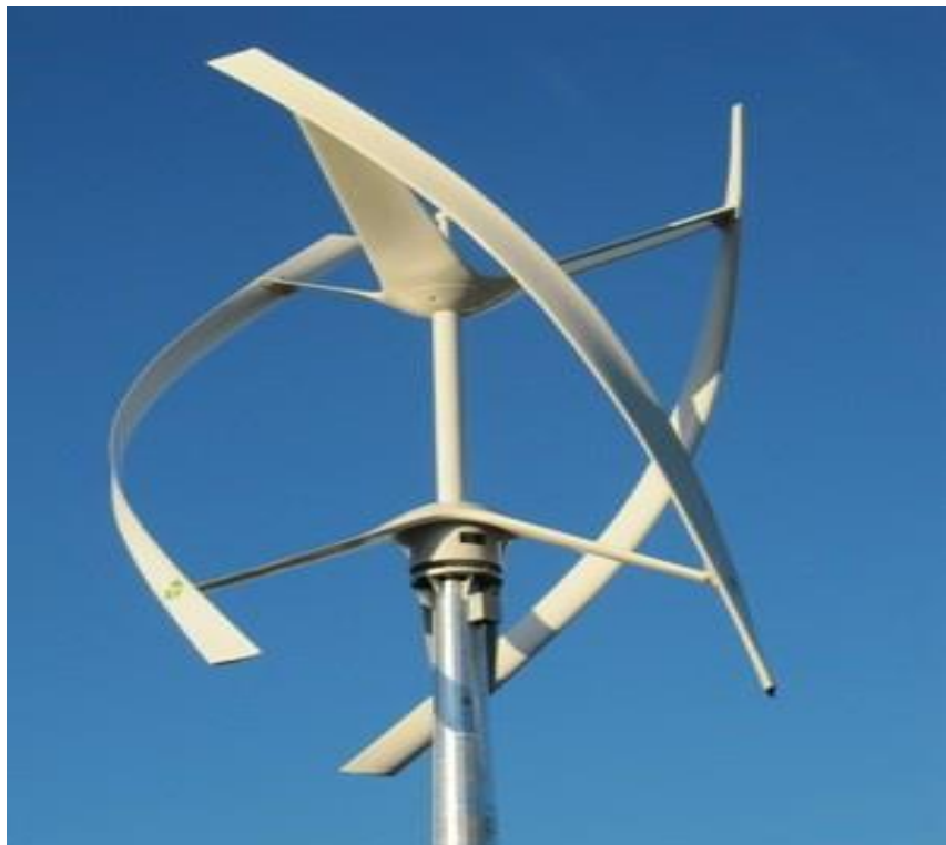
กังหันลมแกนหมุนแนวตั้ง (Vertical Axis Wind Turbine)

1. กังหันลมแกนหมุนแนวตั้ง (Vertical Axis Wind Turbine) เป็นกังหันลมที่มีแกนหมุนและใบพัดตั้งฉากกับการเคลื่อนที่ของลมในแนวราบ และเนื่องจากกังหันลมประเภทนี้มีการตั้งฉากกับการเคลื่อนที่ของลมในแนวราบทำให้สามารถรับลมได้ทุกทิศทาง ปัจจุบันนี้มีการใช้กังหันลมประเภทนี้ค่อนข้างมาก อย่างไรก็ตามกังหันลมประเภทนี้มีปัญหาในประเด็นของประสิทธิภาพการสร้างพลังงาน ด้วยเหตุข้อจำกัดในการขยายให้มีขนาดใหญ่และการยกชุดใบพัดเพื่อรับแรงลม