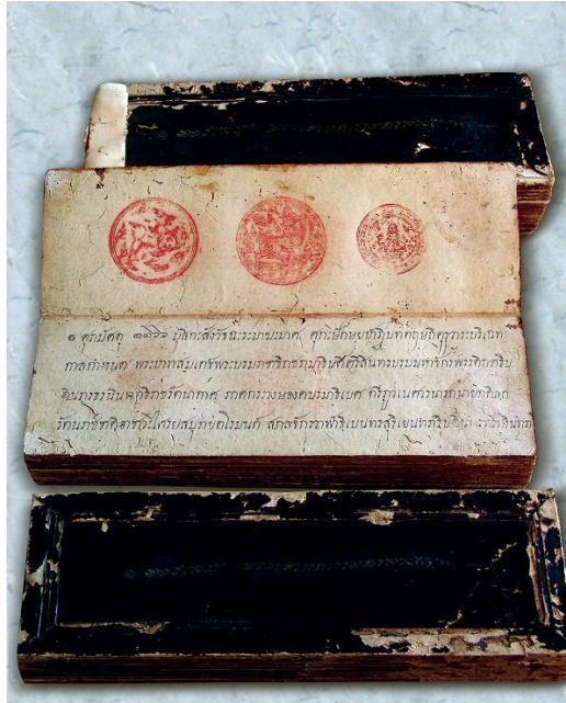
กฎหมายตราสามดวง