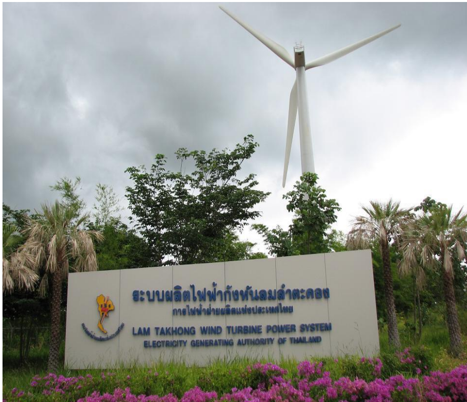
โรงไฟฟ้าพลังงานลมของการไฟฟ้าฝ่ายผลิตแห่งประเทศไทยที่จังหวัดนครราชสีมา

อย่างไรก็ตาม กรณีศึกษาการดำเนินการโรงไฟฟ้าพลังงานลมของการไฟฟ้าฝ่ายผลิตแห่งประเทศไทย ซึ่งเริ่มทำการเก็บข้อมูลสถิติความเร็วลมที่ระดับความสูง 45 เมตรมาตั้งแต่ พ.ศ. 2547 นั้นพบว่า ที่บริเวณลำตะคอง ตำบลคลองไผ่ อำเภอสีคิ้ว จังหวัดนครราชสีมา เป็นแหล่งที่มีศักยภาพพลังงานลมดีที่สุดแห่งหนึ่ง โดยมีลมพัดถึง 2 ช่วง คือช่วงฤดูลมมรสุมตะวันออกเฉียงเหนือ ระหว่างเดือนพฤศจิกายนถึงปลายเดือนมีนาคม และลมมรสุมตะวันตกเฉียงใต้ ระหว่างเดือนพฤษภาคมถึงกลางเดือนตุลาคม ทำให้มีความเร็วลมเฉลี่ยทั้งปี ประมาณ 5-6 เมตรต่อวินาที ซึ่งสามารถนำมาผลิตไฟฟ้าได้ จึงดำเนินโครงการติดตั้งกังหันลม ขนาดกำลังผลิต 1,250 กิโลวัตต์ จำนวน 2 ชุด รวมกำลังผลิต 2,500 กิโลวัตต์ โดยติดตั้งแล้วเสร็จพร้อมทั้งเชื่อมโยงเข้าสู่ระบบการจำหน่ายของการไฟฟ้าส่วนภูมิภาค (กฟภ.) ตั้งแต่ พ.ศ. 2552 เป็นต้นมา