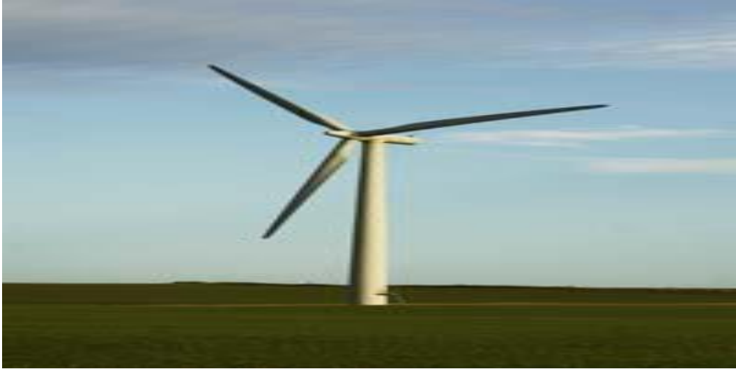
กังหันลมแกนหมุนแนวนอน (Horizontal Axis Wind Turbine)