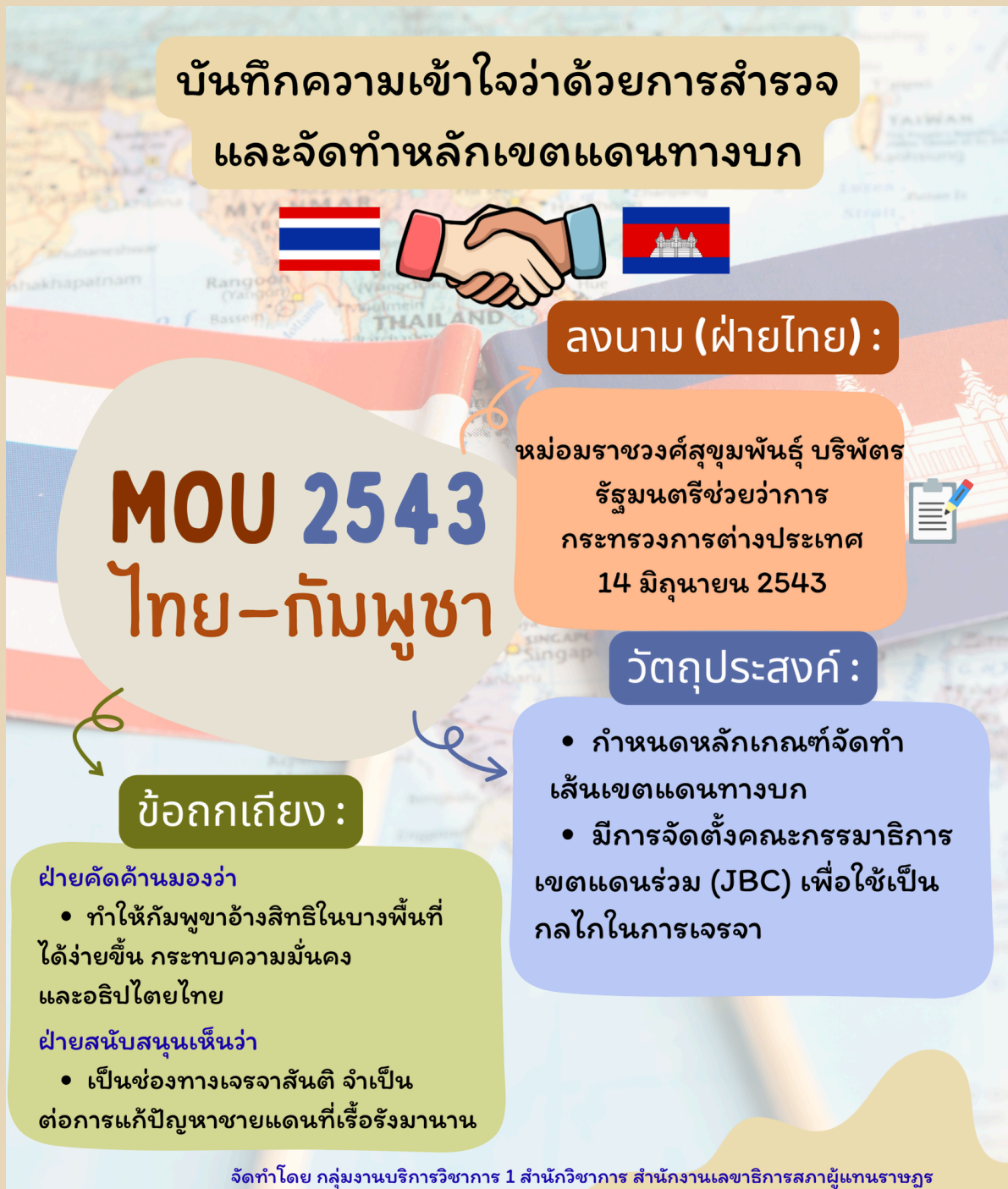
ภาพที่ 1 ภาพรวม MOU 2543 ระหว่างไทยกับกัมพูชา