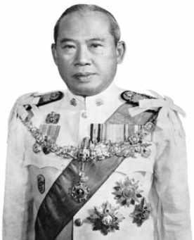
จอมพลถนอม กิตติขจร