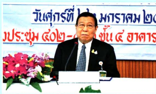
ศาสตราจารย์พิเศษพรเพชร วิชิตชลชัย ประธานวุฒิสภา

เกี่ยวกับสาระสำคัญของร่างพระราชบัญญัติฯ และเป็นการเปิดโอกาสให้สมาชิกวุฒิสภาได้อภิปรายแสดงความคิดเห็นต่อร่างพระราชบัญญัติดังกล่าว ซึ่งมีผลกระทบต่อศีลธรรมและส่งผลต่อการเปลี่ยนแปลงทางสังคมให้ประชาชนได้รับรู้ รวมทั้งให้การพิจารณากฎหมายดังกล่าวดำเนินไปอย่างมีประสิทธิภาพและเกิดประโยชน์สูงสุดต่อประเทศชาติและประชาชน โดยการสัมมนาสมาชิกวุฒิสภาพร้อมแสดงความคิดเห็น สรุปได้ดังนี้