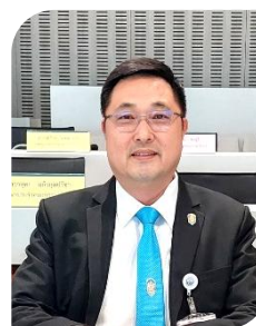
นายสรชัช สุจิตต์ รองประธานคณะกรรมการ คนที่หก