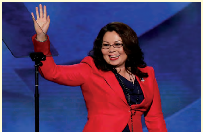
พลโทหญิง แทมมี ลัดดา ดักเวิร์ธ

ที่จะปกป้องรัฐธรรมนูญสหรัฐอเมริกา และยืนหยัดและดำรงความยุติธรรมอย่างสุดความสามารถ