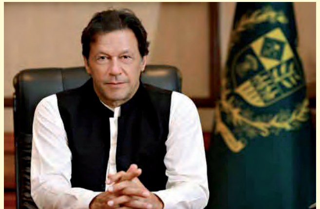
นายอิมราน ข่าน

ทั้งนี้ นายข่านได้ถูกสภาลงมติไม่ไว้วางใจทำให้พ้นตำแหน่งเมื่อเดือนเมษายน ๒๕๖๕ และจากนั้นได้วิจารณ์รัฐบาลและกองทัพ และเดินสายปราศรัยทั่วประเทศเพื่อกดดันให้มีการเลือกตั้งทั่วไปครั้งใหม่ ซึ่งได้รับคะแนนนิยมจากประชาชน แต่การตัดสิทธิทางการเมืองล่าสุดจะทำให้ไม่สามารถลงสมัครรับเลือกตั้งในการเลือกตั้งทั่วไปในปี ๒๕๖๖ ได้