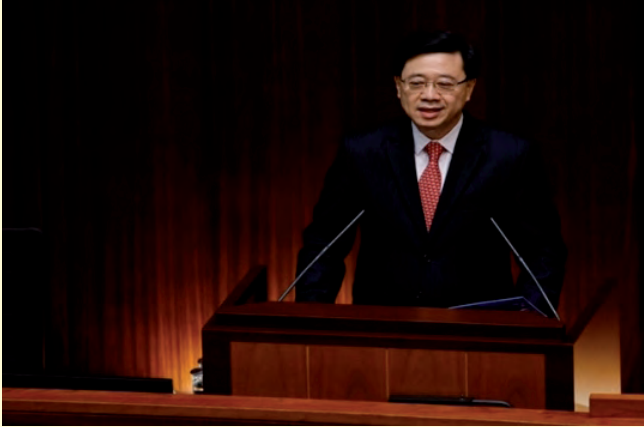
นายจอห์น ลี

วันที่ ๑๙ ตุลาคม ๒๕๖๕ นายจอห์น ลี ผู้บริหารสูงสุดของฮ่องกง แถลงนโยบายประจำปีต่อรัฐสภา เร่งฟื้นฟูและกระตุ้นให้ต่างชาติกลับมาลงทุน โดยประกาศให้มีความสำคัญเรื่องการฟื้นฟูภาพลักษณ์ของฮ่องกงในฐานะศูนย์กลางธุรกิจระดับโลกและเสมือนประตูทางเข้าไปยังประเทศจีน รวมถึง