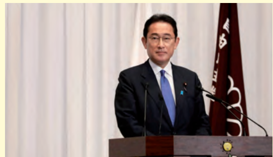
นายฟูมิโอะ คิชิดะ

และสมาชิกของโบสถ์มักจะถูกคนภายนอกตั้งฉายาว่า พวกมูนนี่ส์ (Moonies) และได้เผยแพร่คำสอนที่อยู่บนฐานของพระคัมภีร์ไบเบิล ทั้งนี้ กิจกรรมที่สร้างชื่อเสียงให้โบสถ์มากที่สุดคือ “พิธีสมรสหมู” และปัจจุบันคาดว่าโบสถ์แห่งนี้มีสมาชิกอยู่หลายแสนคนทั่วโลก แม้ทางโบสถ์จะยืนยันว่าไม่ได้ทำอะไรผิดแต่กลับถูกอดีตสมาชิกหลายคนออกมาวิจารณ์แนวปฏิบัติ และยังระบุถึงสายสัมพันธ์ระหว่างโบสถ์กับนักการเมืองระดับสูงของญี่ปุ่นหลายคน ซึ่งมีส่วนทำให้คะแนนนิยมของรัฐบาลลดลงมาก