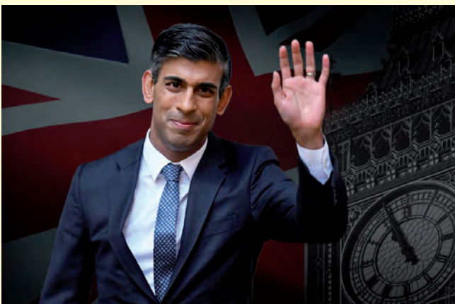
นายริชี ซุนด์

นายริชี ซุนด์ ได้ดำรงตำแหน่งหัวหน้าพรรคอนุรักษ์นิยม และนายกรัฐมนตรีคนใหม่ หลังจากเพนนี มอร์ดอนท์ คู่แข่งได้เสียงสนับสนุนจากสมาชิกสภาผู้แทนราษฎรของพรรคอนุรักษ์นิยมไม่ถึง ๑๐๐ เสียง ทำให้ตัดสินใจถอนตัว จากนั้น เพนนี มอร์ดอนท์ ได้แถลงการณ์ผ่านทางทวิตเตอร์ สนับสนุนนายริชี ซุนด์ และเรียกร้องพรรคอนุรักษ์นิยมให้สนับสนุนนายกรัฐมนตรีคนใหม่ด้วย ทั้งนี้ นายริชี ซุนด์ ถือเป็นนายกรัฐมนตรีอังกฤษคนแรกที่มีเชื้อสายอินเดีย และมีอายุเพียง ๔๒ ปี ทำให้เขาเป็นผู้นำอายุน้อยที่สุดในประวัติศาสตร์การเมืองอังกฤษสมัยใหม่