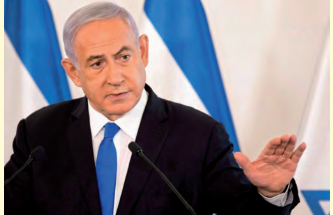
นายเบนจามิน เนทันยาฮู

โดยการเลือกตั้งทั่วไปครั้งนี้ ถือเป็น การเลือกตั้งครั้งที่ ๕ ของอิสราเอล ภายในระยะเวลาไม่ถึง ๔ ปี ผลคะแนนเลือกตั้งอย่างเป็นทางการนี้จะนำเสนอต่อประธานาธิบดีไอแซค เฮอร์ซอก ของอิสราเอล เพื่อลงนามรับรอง และมอบหมายให้นะทันยาฮูเริ่มจัดตั้งรัฐบาลใหม่ได้ต่อไป