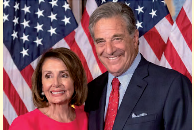
นายพอล เพโลซี

ปลอดภัยของสมาชิกในครอบครัวผู้แทนสหรัฐ นับจากเกิดเหตุ มีอบขาจัดบุกอาคารรัฐสภาเมื่อสองปีก่อน อีกทั้งยังเกิดก่อนถึงวันเลือกตั้งกลางเทอมของสภาสหรัฐ ๑๑ วัน