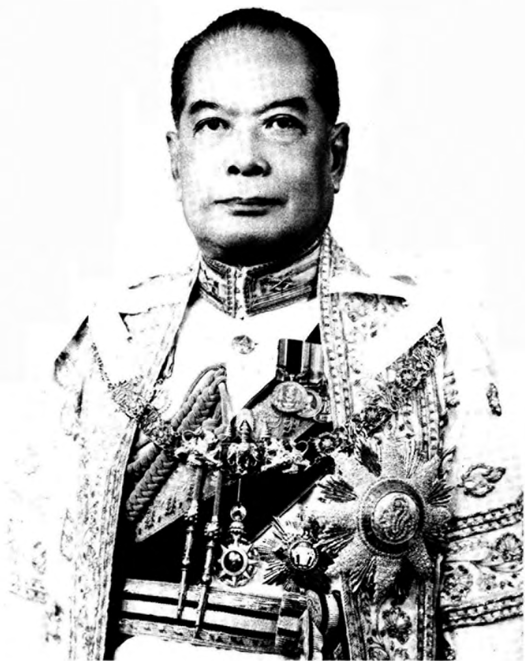
พลเอก หลวงบสุภะธิสารนการ ป.จ.,ม.ป.ช.,ม.ว.ม.