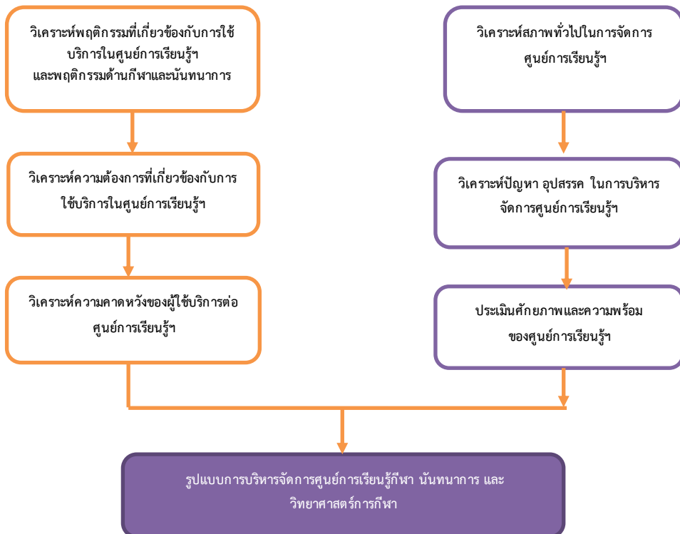
ภาพที่ ๑ กรอบแนวคิดของการวิจัย

จากการทบทวนวรรณกรรมที่เกี่ยวข้องสามารถกำหนดกรอบแนวคิดของการวิจัยเรื่อง แผนงานรูปแบบการบริหารจัดการศูนย์การเรียนรู้กีฬา นันทนาการ และวิทยาศาสตร์การกีฬาในสังกัดกรมพลศึกษา ได้ดังนี้