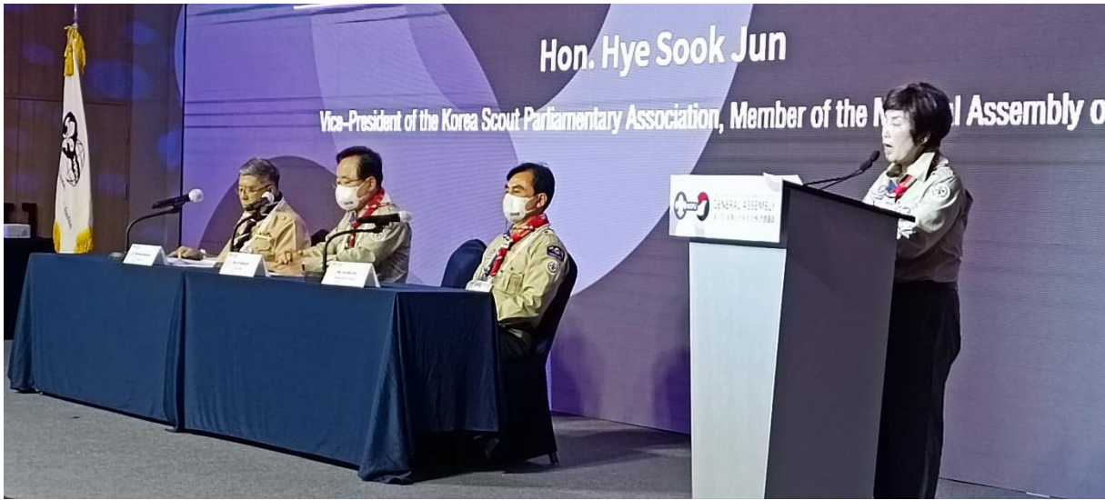
Hon. Hye-Sook Jun สมาชิกสภาและรองประธานชมรมลูกเสือรัฐสภาเกาหลี กล่าวทักทายและต้อนรับผู้เข้าร่วมการประชุม