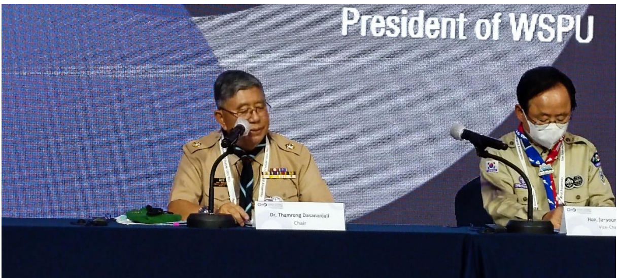
นายธำรง ทศนาญชลี ประธานสหภาพลูกเสือรัฐสภาโลก ทำหน้าที่ประธานการประชุมเต็มคณะ ในการประชุมสมัชชาใหญ่สหภาพลูกเสือรัฐสภาโลก ครั้งที่ ๑๐

จากนั้น นายธำรง ทศนาญชลี ประธานการประชุมกล่าวสุนทรพจน์ต้อนรับผู้เข้าร่วมประชุมมีเนื้อหาโดยสรุปกล่าวถึงผลงานในตลอด ๔ ปีที่ผ่านมาในฐานะประธานสหภาพลูกเสือรัฐสภาโลก ซึ่งตนเองได้ทำงานอย่างมุ่งมั่นในการขับเคลื่อนปฏิญญากรุงเทพฯ แผนปฏิบัติการสหภาพลูกเสือรัฐสภาโลก ปี ๒๕๖๒-๒๕๖๕ วาระการพัฒนา ๒๐๓๐ เพื่อการพัฒนาที่ยั่งยืนให้เกิดผลอย่างเป็นรูปธรรม รวมถึงการให้ความสำคัญกับเรื่องการจัดการความเสี่ยงในการจัดกิจกรรมลูกเสือให้แก่เด็กและเยาวชนเพื่อให้สามารถเรียนรู้ได้อย่างปลอดภัยและสนุกสนาน นอกจากนี้ ยังได้กล่าวถึงความประทับใจและประสบการณ์ที่มีคุณค่าอย่างมากตลอดระยะเวลาที่ดำรงตำแหน่งประธานสหภาพลูกเสือรัฐสภาโลก รวมถึงได้กล่าวขอบคุณรัฐสภาไทย เลขาธิการสภาผู้แทนราษฎร รองเลขาธิการสภาผู้แทนราษฎร ด้านต่างประเทศ รวมถึงเจ้าหน้าที่ที่ช่วยสนับสนุนการทำงานของตนให้ประสบผลสำเร็จเป็นอย่างดี