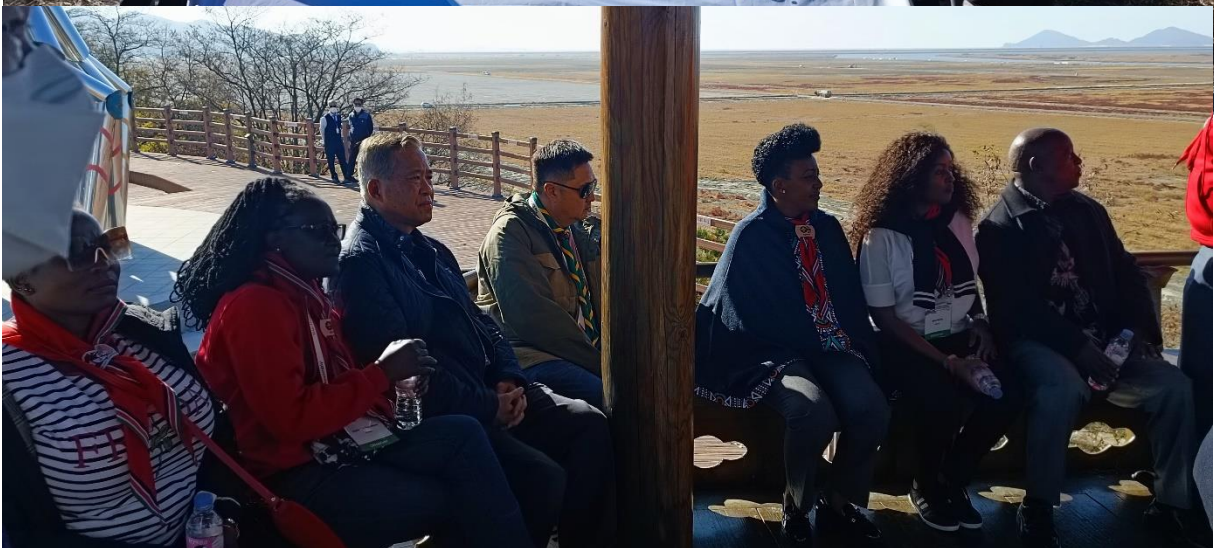
ผู้เข้าร่วมการประชุมเดินทางไปเยี่ยมชมสถานที่จัดงานชุมนุมลูกเสือโลก ครั้งที่ ๒๕ ที่จะจัดขึ้นระหว่างวันที่ ๑ – ๑๒ สิงหาคม ๒๕๖๖ ณ Saemangeum สาธารณรัฐเกาหลี