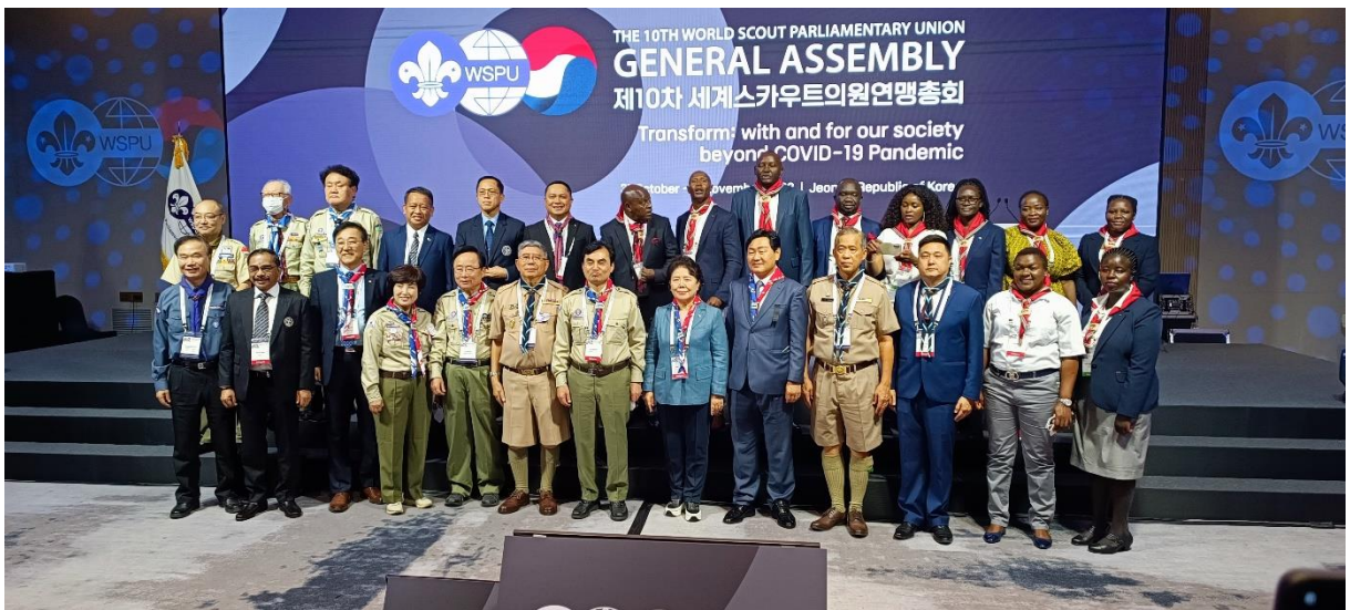
ผู้เข้าร่วมประชุมถ่ายรูปร่วมกัน