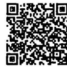
บันทึกการประชุมสภา สำนักrayงาน การประชุมและชวเลข