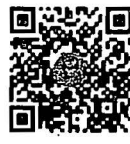
กระทู้ถามสด ด้วยวาจา