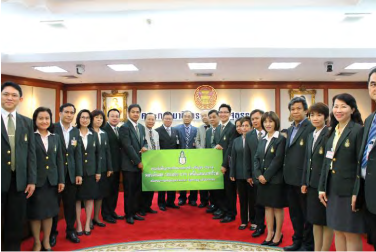
“คณะนักศึกษาศาสนาบ้านพระปกเกล้า หลักสูตร ปรม. ๑๔” สนับสนุนการเผยแพร่จุลสารรัฐธรรมนูญฉบับปฏิรูป