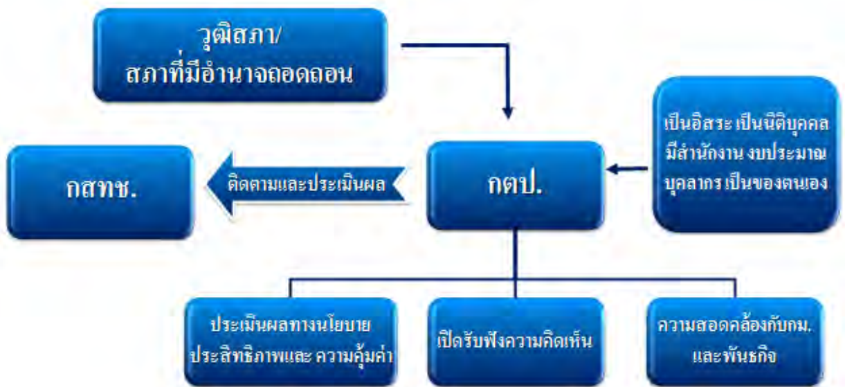
ภาพที่ ๙ : ภาพข้อเสนอด้านการติดตามและประเมินผล