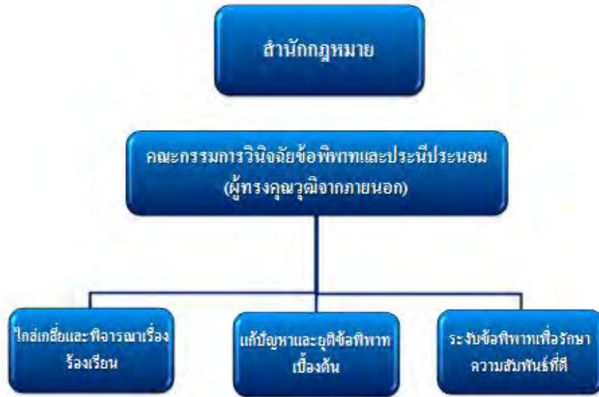
ภาพที่ ๑๐ : ภาพข้อเสนอด้านคณะกรรมการวินิจฉัยข้อพิพาทและประนีประนอม