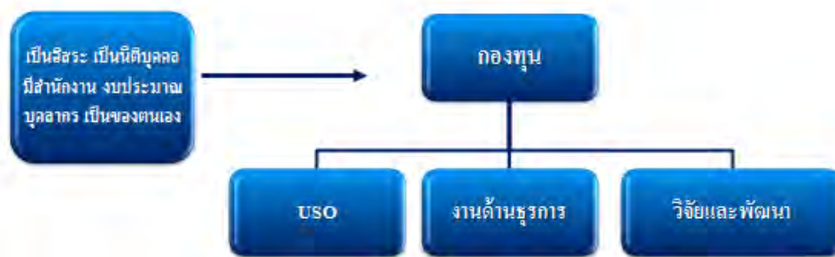
ภาพที่ ๘ : ภาพข้อเสนอด้านการบริหารกองทุน