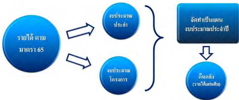
ภาพที่ ๕ : ภาพข้อเสนอด้านงบประมาณ