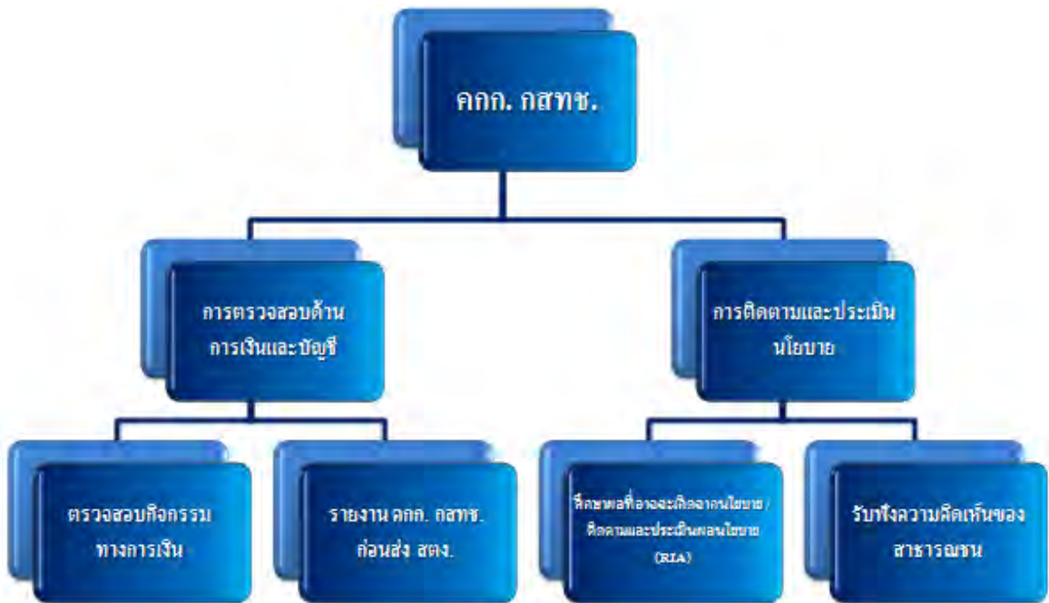
ภาพที่ ๗ : ภาพข้อเสนอด้านโครงสร้างการตรวจสอบภายใน