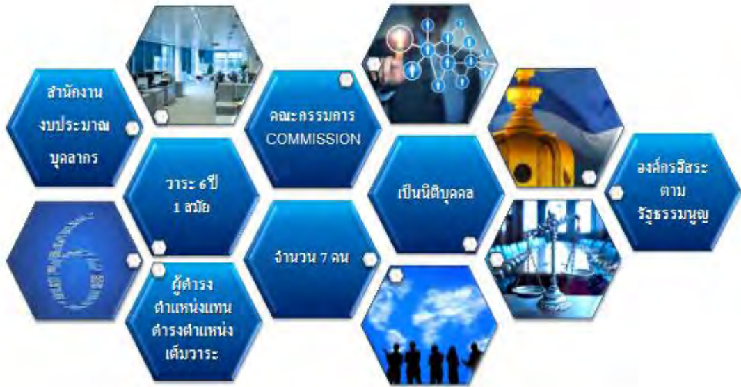
ภาพที่ ๓ : ภาพข้อเสนอด้านรูปแบบองค์กร