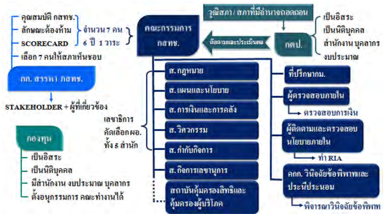
ภาพที่ ๒ : ภาพรวมโครงสร้างข้อเสนอแนะการปฏิรูป

ปัญหาและข้อเสนอแนะการแก้ไขพระราชบัญญัติองค์กรจัดสรรคลื่นความถี่และกำกับการประกอบกิจการวิทยุกระจายเสียง วิทยุโทรทัศน์ และกิจการโทรคมนาคม พ.ศ. ๒๕๕๓ แบ่งออกเป็นด้านต่าง ๆ ดังนี้