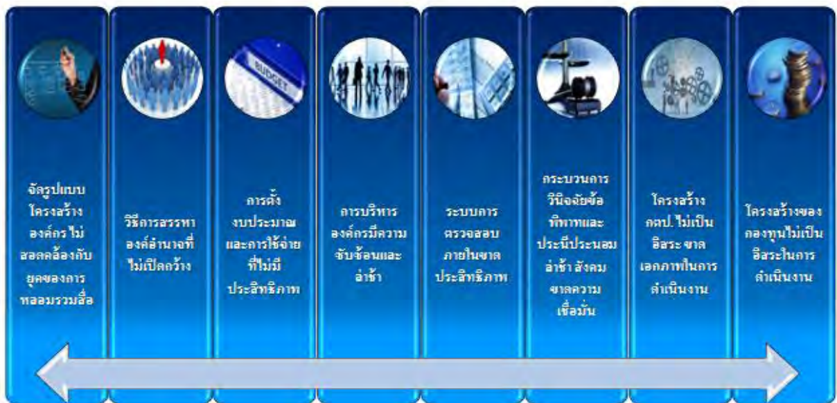
ภาพที่ ๑ : ภาพรวมปัญหาขององค์กรกำกับดูแล

การคุ้มครองผู้บริโภค ไม่ได้ผลดีเท่าที่ควร การประสานงานกับหน่วยงานที่เกี่ยวข้อง ไม่ตอบสนองต่อปัญหาที่เกิดกับผู้บริโภค แม้มีการร้องเรียน แต่การแก้ปัญหาล่าช้าไม่เกิดผล ขาดการบูรณาการ ระหว่างหน่วยงานที่เกี่ยวข้อง อาทิ สำนักงานคณะกรรมการอาหารและยา (อย.) สำนักงานคณะกรรมการ คุ้มครองผู้บริโภค (สคบ.) ซึ่งสร้างความไม่พอใจให้กับประชาชน (ได้มีการศึกษาในคณะกรรมการสิทธิการคุ้มครองผู้บริโภคแล้ว)