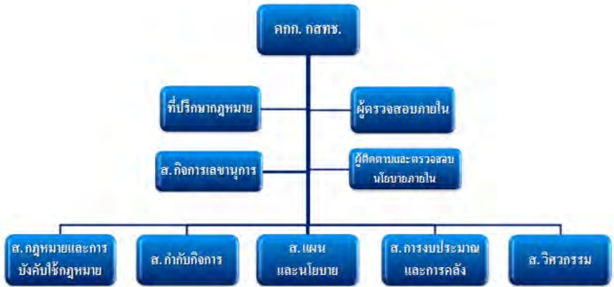
ภาพที่ ๖ : ภาพข้อเสนอด้านโครงสร้างสำนักงาน