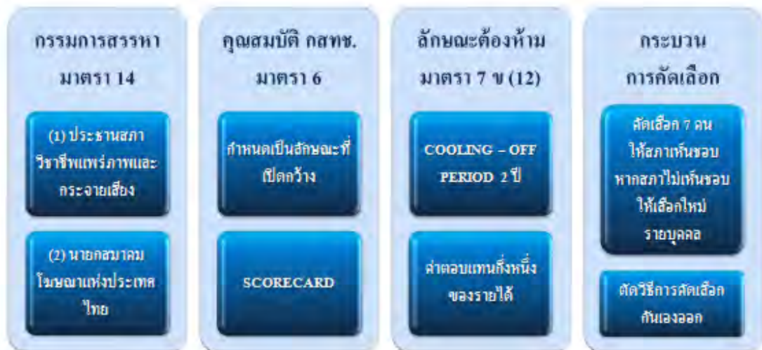
ภาพที่ ๔ : ภาพข้อเสนอด้านการสรรหาองค์อำนาจ