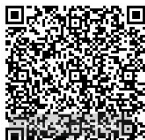
ดาวน์โหลดเอกสารประกอบ การประชุมวุฒิสภา ครั้งที่ ๒