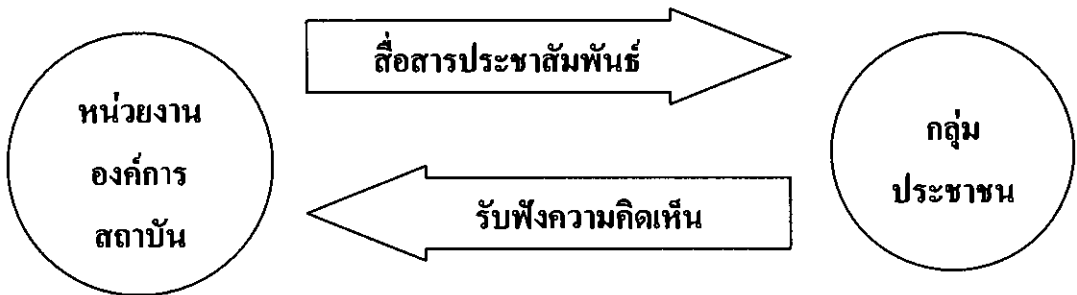
ภาพที่ ๑ แนวคิดเกี่ยวกับการประชาสัมพันธ์

ซึ่งจะยังผลให้เกิดการยอมรับจากประชาชน และให้ความร่วมมือสนับสนุนกับองค์การสถาบัน ในที่สุด