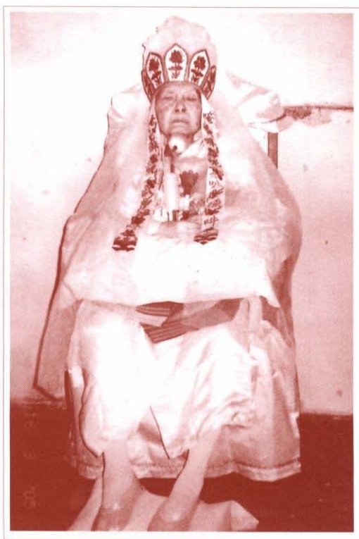
นั่งฟังศิษย์สวดมนต์ ๑๖ มีนาคม ๒๕๔๘