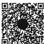
หนังสือนัดประชุม และระเบียบวาระการประชุม ร่วมกันของรัฐสภา

หมายเหตุ เอกสารประกอบการประชุมร่วมกันของรัฐสภา ได้เผยแพร่ทางสื่ออิเล็กทรอนิกส์ ตามข้อบังคับ การประชุมรัฐสภา พ.ศ. ๒๕๖๓ ข้อ ๑๓ โดยท่านสมาชิกฯ สามารถอ่านเอกสารประกอบการประชุมได้ โดยการสแกน QR code ที่ปรากฏอยู่ในหนังสือนัดประชุม หรือทาง www.parliament.go.th