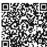
บันทึกการประชุมสภา สำนักแรงงาน การประชุมและชวเลข