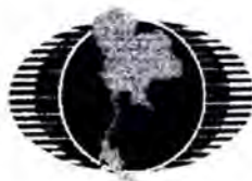
พรรคชาติพัฒนา