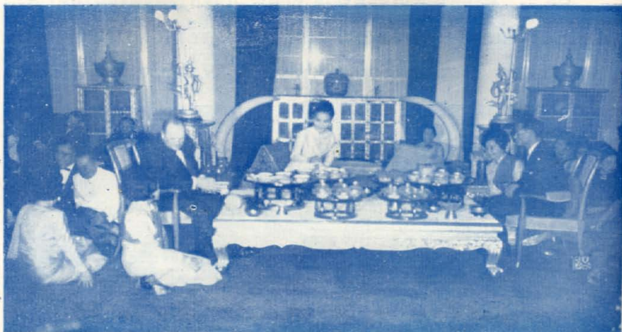
ถวายพระกระยาหารค่ำ ตามประเพณีของนครเชียงใหม่แต่สมเด็จพระเจ้ากรุงนอร์เว ณ พระตำหนักภูพิงคราชนิเวศน์ ๑๘ มกราคม ๒๕๐๘