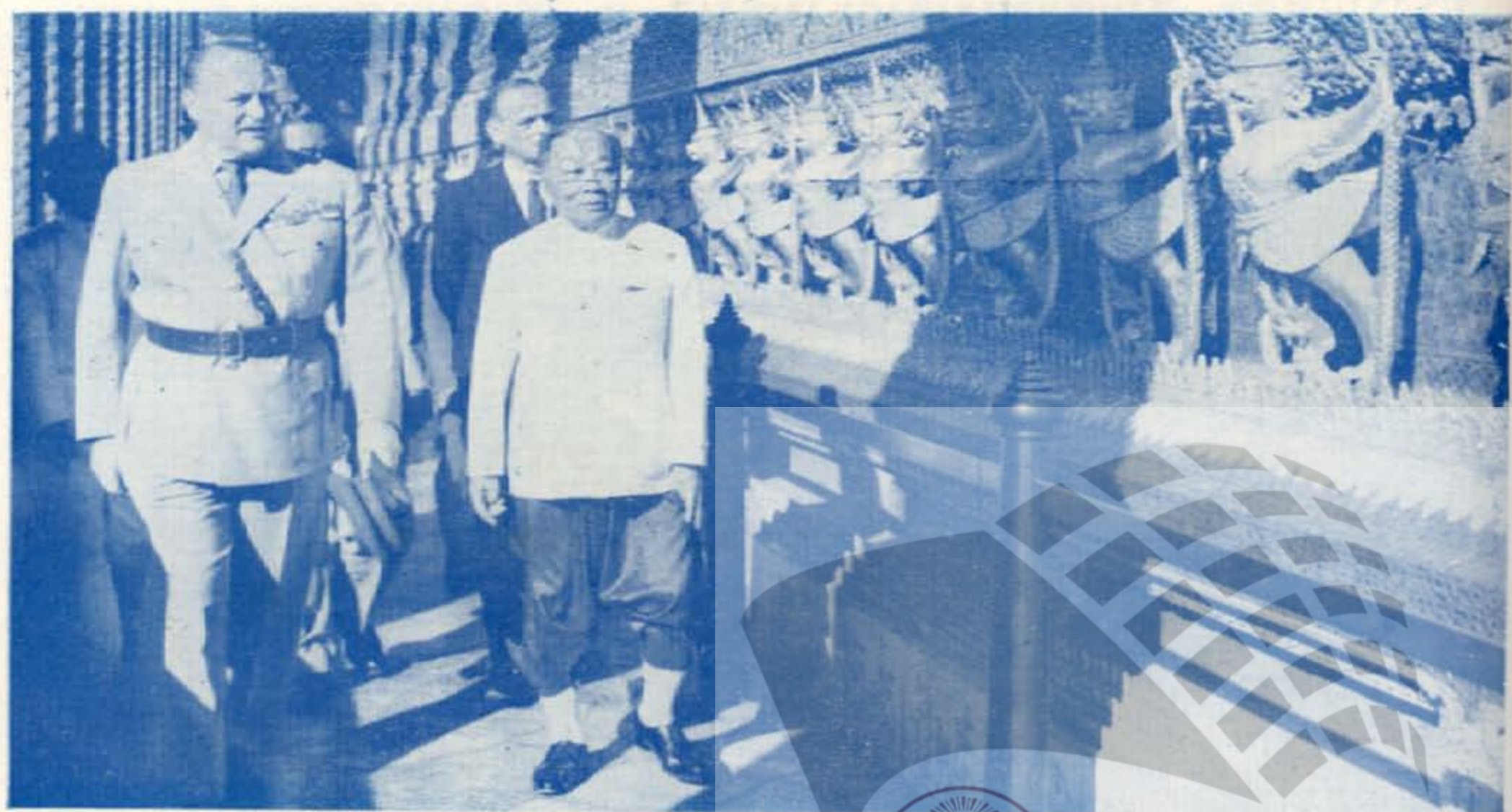
เสด็จ ฯ ทอดพระเนตร วัดพระศรีรัตนศาสดาราม เช้าวันที่ ๑๘ มกราคม ๒๕๐๘