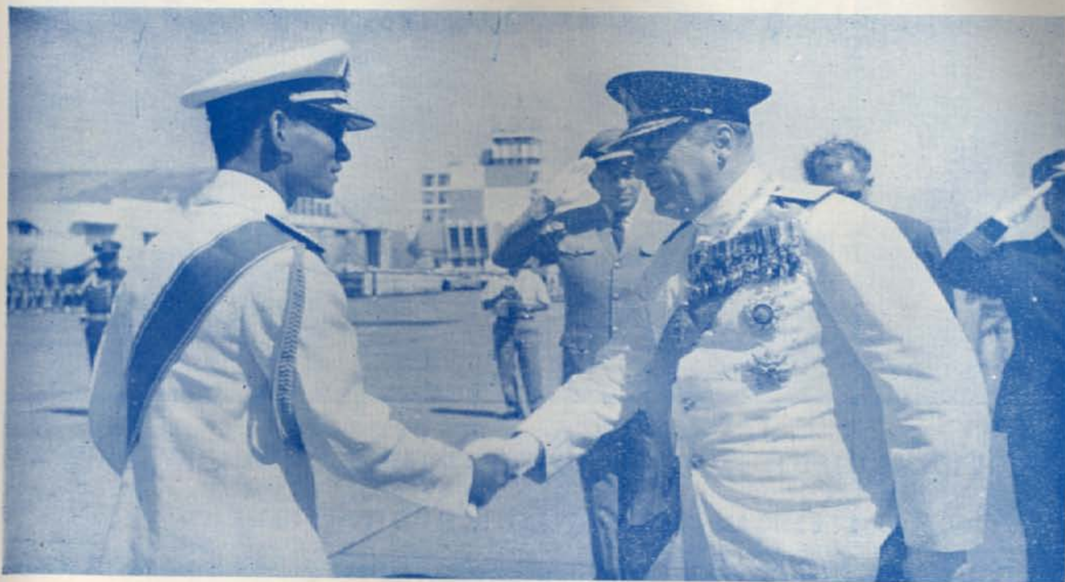
ทรงรับเสด็จ สมเด็จพระเจ้ากรุงนอร์เว ณ ท่าอากาศยานดอนเมือง ๑๕ มกราคม ๒๕๐๘

ปก - พระบาทสมเด็จพระเจ้าอยู่หัว และสมเด็จพระนางเจ้า ฯ พระบรมราชินีนาถ ได้จัดงานถวายพระกระยาหารค่ำ แด่สมเด็จพระเจ้า กรุงนอร์เว ณ พระที่นั่งจักรีมหาปราสาท ๑๕ มกราคม ๒๕๐๘