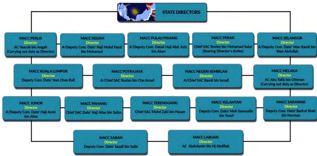
ภาพที่ 2 โครงสร้างสำนักงานประจำรัฐ (State offices)

โครงสร้างขององค์กรจะมีส่วนราชการภายในสำนักงานใหญ่ตั้งอยู่ที่เมืองปุตราจายา (เมืองราชการ) ซึ่งประกอบด้วย 18 กอง เช่น กองสืบสวนสอบสวน (Investigation Division) กองกฎหมายและการฟ้องร้อง (Legal and Prosecution Division) กองตรวจและการให้คำปรึกษา (Inspection and Consultancy Division) เป็นต้น และ 1 สถาบันในสำนักงานใหญ่ คือ “Malaysia Anti-Corruption Academy: MACA” เป็นศูนย์การศึกษานานาชาติ (International Studies Centre) ที่รับผิดชอบเกี่ยวกับการวางแผนและจัดเตรียมหลักสูตรการสัมมนา และการประชุมเชิงปฏิบัติการเกี่ยวกับโครงการป้องกันความเสียหายด้วยการมีส่วนร่วมของสำนักงานจากหน่วยงานบังคับใช้กฎหมายต่างประเทศ โดยดำเนินการในรูปแบบการจัดสัมมนาและการประชุมเชิงปฏิบัติการเกี่ยวกับความพยายามในการต่อต้านการทุจริตในภูมิภาคเอเชียแปซิฟิกด้วยความร่วมมือจากหน่วยงานและองค์กรต่างประเทศ (International Studies Centre, 2016) และมีสำนักงานประจำรัฐ (State officer) 16 หน่วยงาน (Divisions, 2016) ซึ่งมีผู้อำนวยการสำนักงานประจำรัฐเป็นหัวหน้า (สำนักงานคณะกรรมการป้องกันและปราบปรามการทุจริตแห่งชาติ, 2558, น. 65) โดยมีโครงสร้างสำนักงานประจำรัฐ (State offices) ดังต่อไปนี้