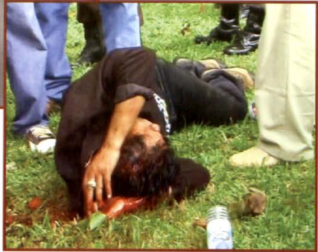
ผู้ชุมนุมกลุ่มพันธมิตรฯ อุตรธานีที่ได้รับบาดเจ็บจากการกลุ่มมรทำร้าย