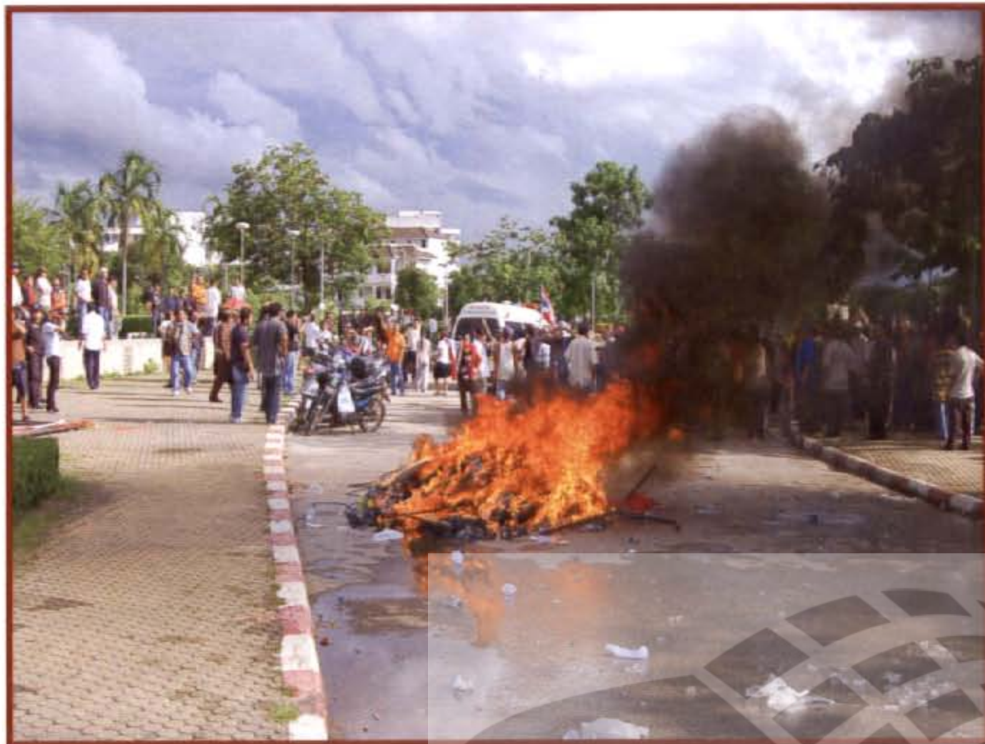
กลุ่มชมรมคนรักอุดร เผาทำลายสิ่งของกลุ่มพันธมิตรฯ อุดรธานี