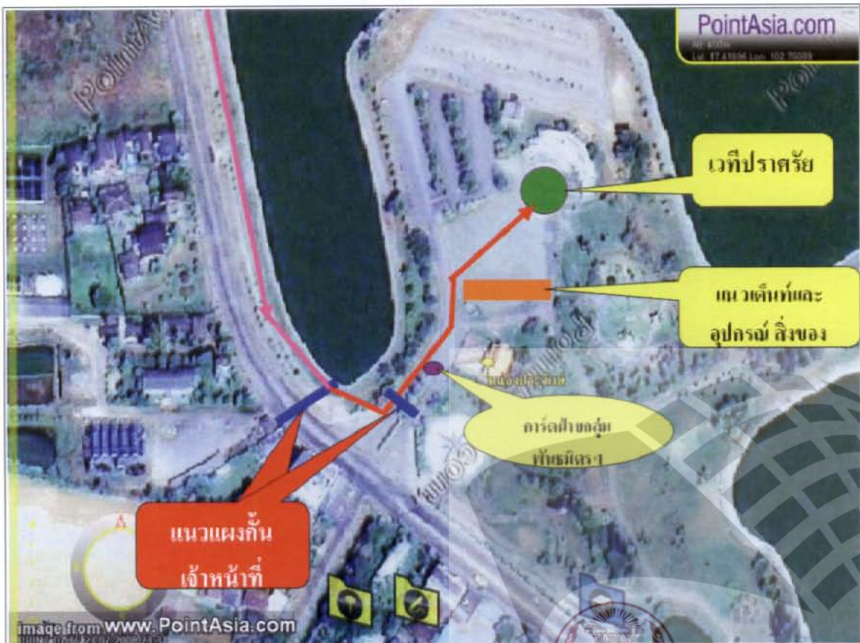
(ภาพ ๗. แสดงจุดสกัดของเจ้าหน้าที่บริเวณหนองปรือจักร์)