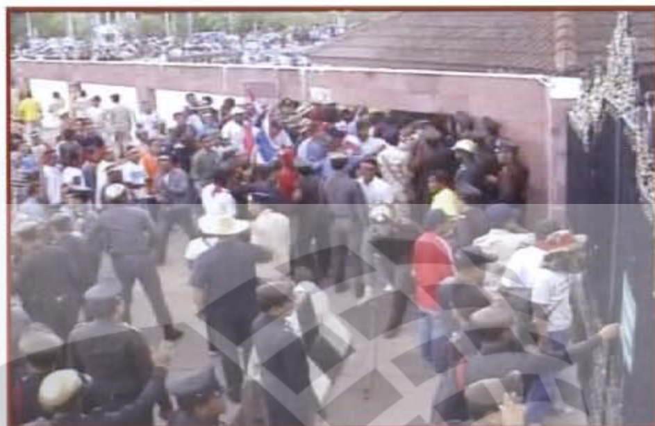
กลุ่มชมรมคนรักอุดร ฝ่าแนวกันตำรวจเข้ามาในพื้นที่หนองประจักษ์