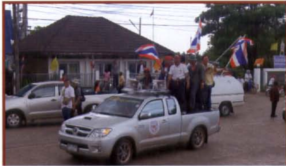
กลุ่มชมรมคนรักอุดรเคลื่อนขบวนจากทุ่งศรีเมืองมายังหนองประจักษ์ศิลปาคม