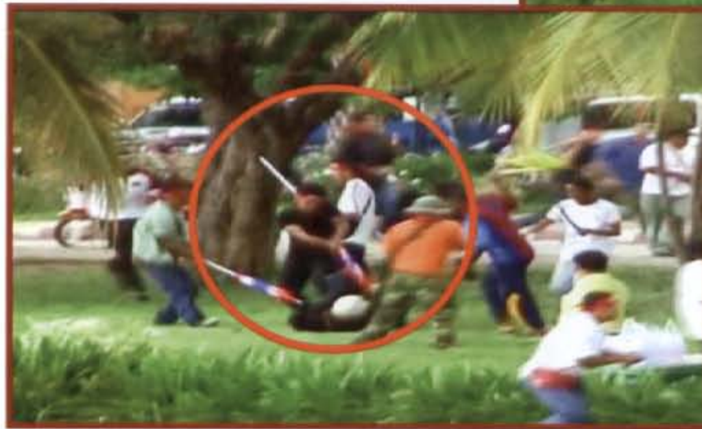
กลุ่มชมรมคนรักอุดร กลุ่มรุมทำร้ายผู้ชุมนุมพันธมิตรฯ อุดรธานีบริเวณในพื้นที่หนองประจักษ์ศิลปาคม