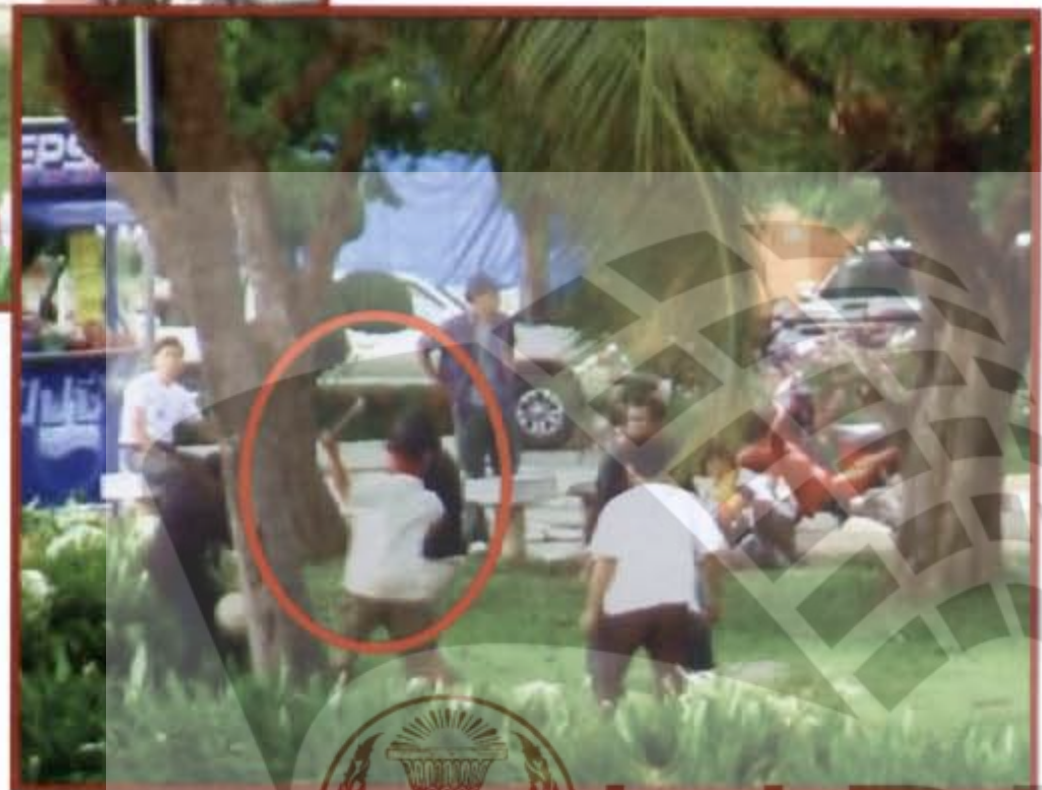
กลุ่มชมรมคนรักอุดร นำค้อนไล่ตีผู้ชุมนุมพันธมิตรฯ อุดรธานีบริเวณในพื้นที่หนองประจักษ์ศิลปาคม