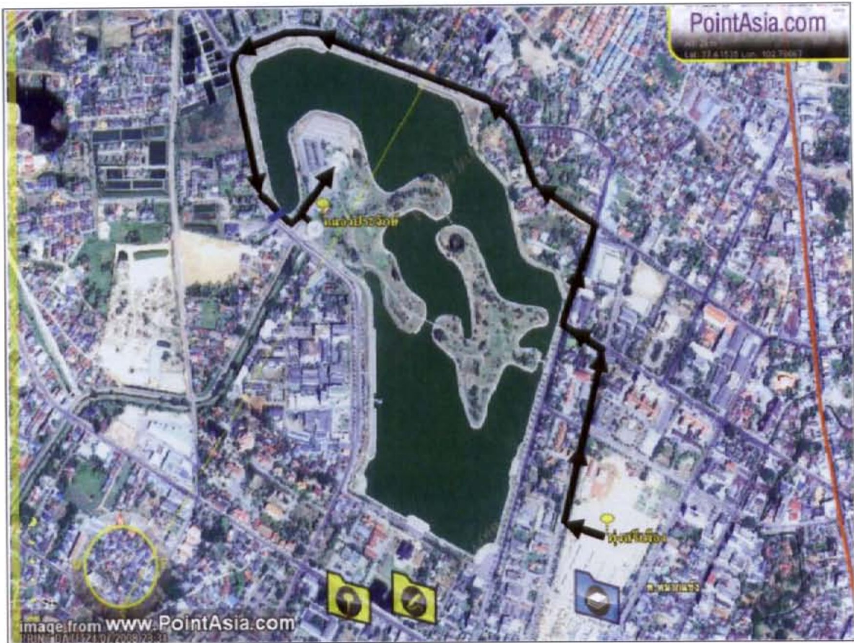
(ภาพ ๖. แสดงเส้นทางการเดินเคลื่อนขบวนของกลุ่มชมรมคนรักอุดร จากทุ่งศรีเมืองไปยังหนองปรือจักร์ ระยะทางประมาณ ๒.๕๑ กิโลเมตร วัดความยาวเส้นทางโดย Point Asia)