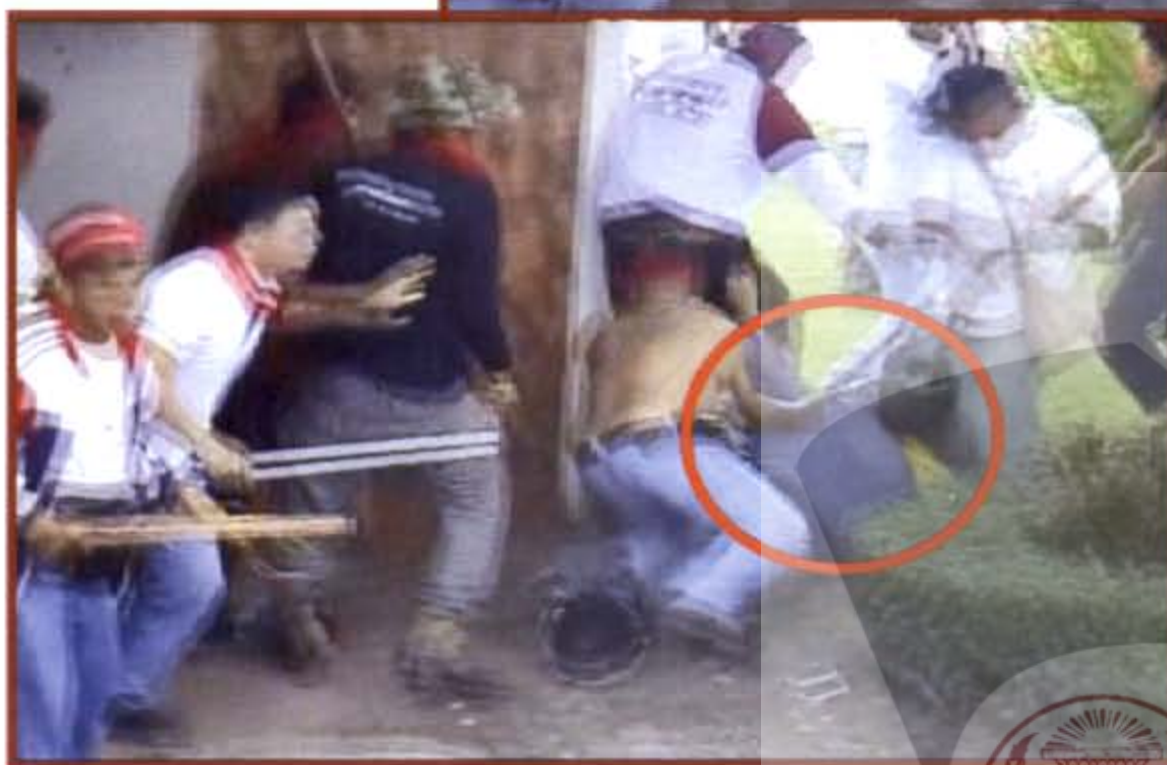
กลุ่มชมรมคนรักอุดร กลุ่มรุมทำร้ายผู้ชุมนุมผู้หญิงของกลุ่มพันธมิตรฯ อุดรธานี ด้วยการใช้ไม้ด้ามยาวรุมตีบริเวณข้างประตูทางเข้า