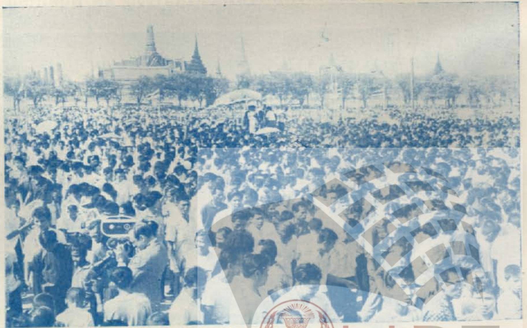
ประชาชนเก็บเมล็ดพันธุ์ข้าว ในบวรเมืองแรกนาขวัญเมื่อเสด็จพิธี