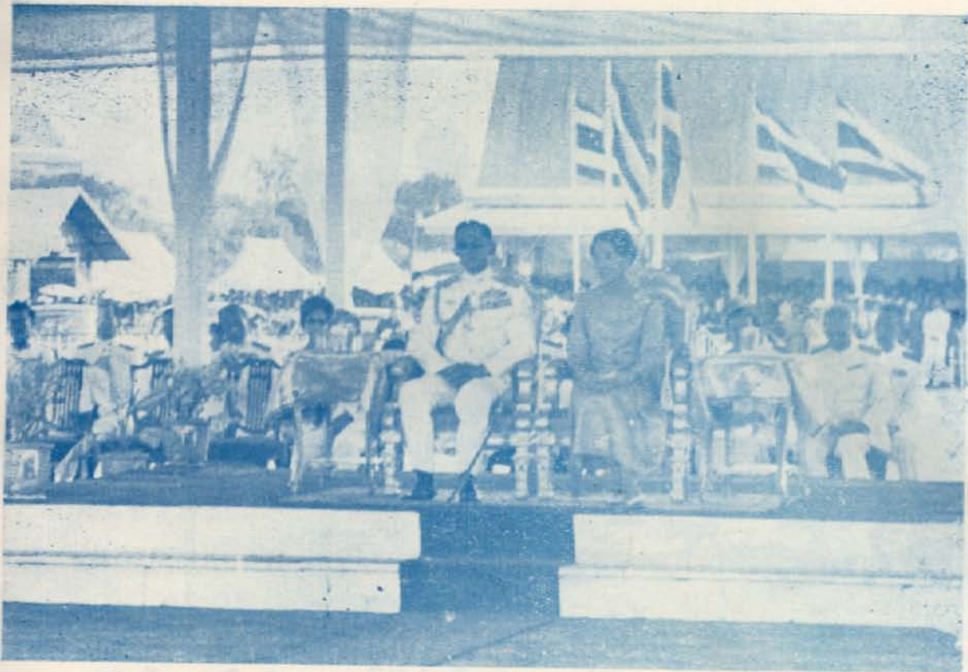
พระบาทสมเด็จพระเจ้าอยู่หัวและสมเด็จพระนางเจ้าฯ พระบรมราชินีนาถ เสด็จพระราชดำเนิน ยังพลับพลาท้องสนามหลวง ประทับทรงเป็นประธาน ในงานพระราชพิธีพืชมงคลจรดพระนังคัลแรกนาขวัญ ๑๓ พฤษภาคม ๒๕๐๕