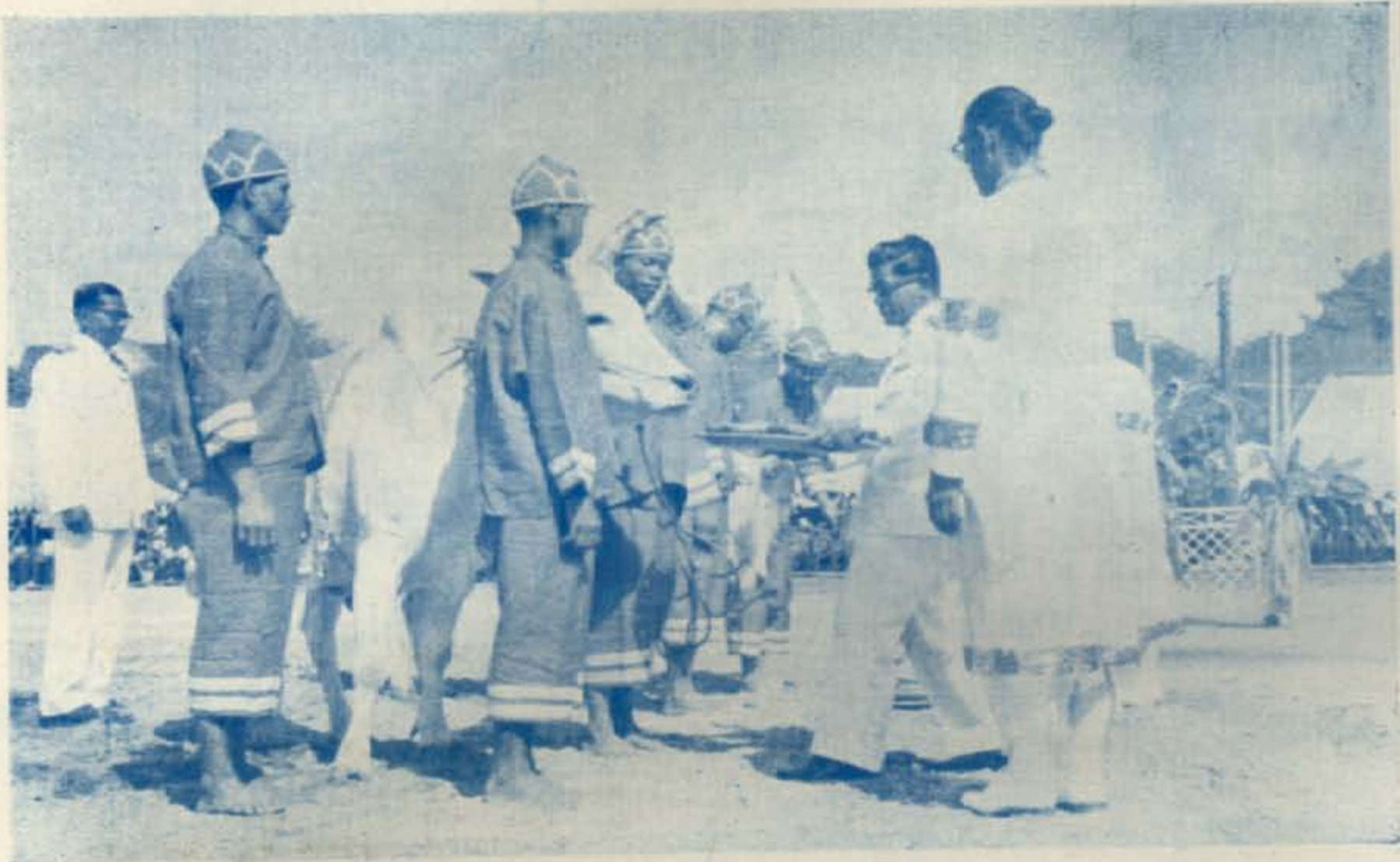
พนักงานเสียงของกิน ๗ สิ่ง เลี้ยงพระโค ปราบภูวามัน พระโคกินเหล่า ทายว่าการคมนาคมสะดวกยิ่งขึ้น การค้าขายกับต่างประเทศดีขึ้น ทำให้เศรษฐกิจเจริญรุ่งเรือง