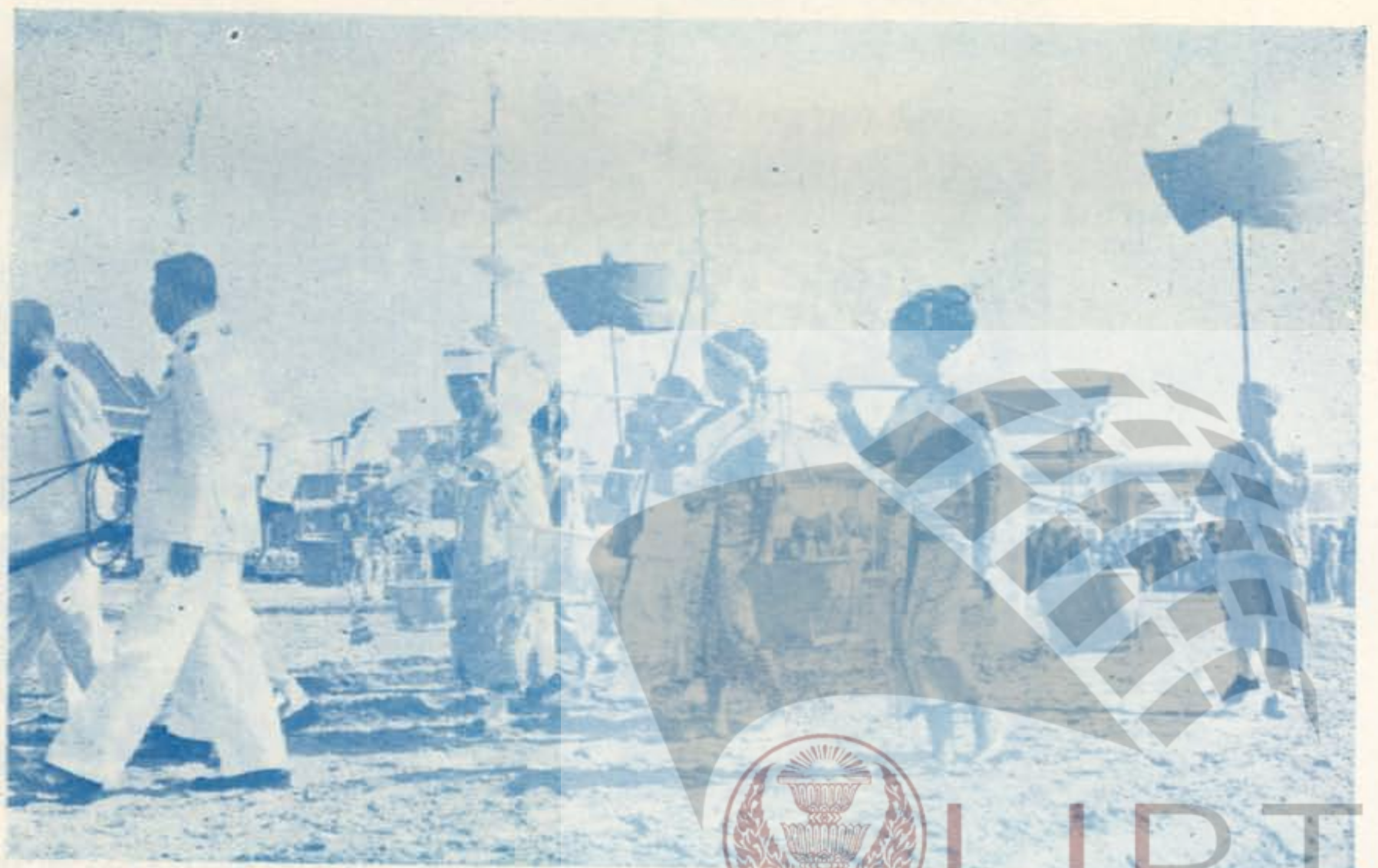
อธิบดีกรมการข้าว ไถ่ตะไปโคยรี ๓ รอบ โดยขวาง ๓ รอบ และหว่านธัญพืช