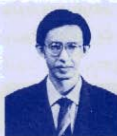
วัลลภ ตั้งคณานุรักษ์