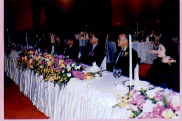
วันที่ ๑๕ มีนาคม ๒๕๔๓ เวลา ๑๘.๓๐ นาฬิกา ได้มีการจัดงานสมาชิกวุฒิสภาสัมพันธ์ขึ้น ณ สโมสรตำรวจ เพื่อเป็นการกระชับความสัมพันธ์และความประทับใจต่อกันระหว่างสมาชิกวุฒิสภาก่อนครบวาระการดำรงตำแหน่ง