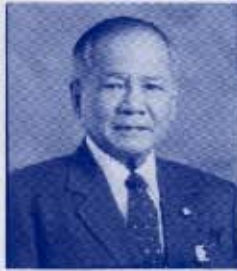
พล.อ. สิทธิ จิรโรจน์

สำหรับ พล.อ. สิทธิ จิรโรจน์ ไม่ได้มาร่วมในงานและท่านเป็นผู้หนึ่ง ที่ได้รับโล่ประกาศเกียรติคุณ ซึ่ง ฯพณฯ ประธานวุฒิสภาได้มามอบให้ท่าน ในวันที่ ๒๑ มีนาคม ๒๕๔๓ ณ ห้องประชุมรัฐสภา