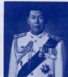
พล.อ. ศิริินทร์ ฐปกล้า