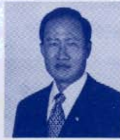
ประยุทธ มหากิจศิริ