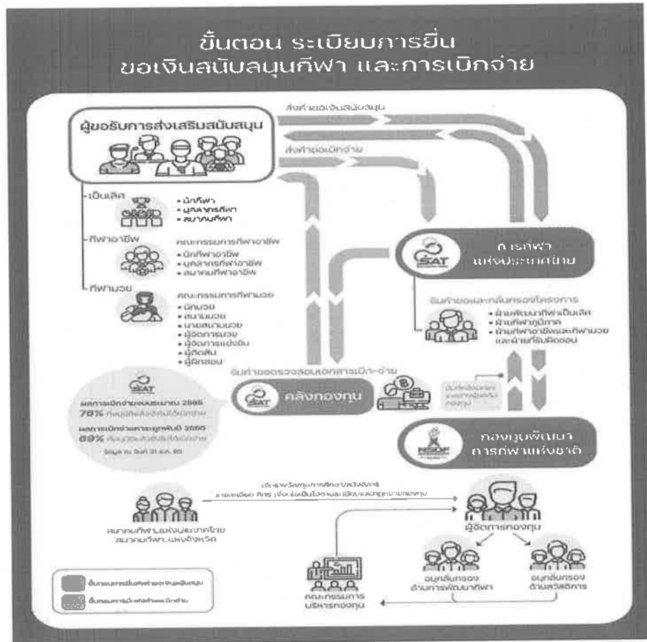
ภาพที่ 1 ขั้นตอนการขอรับเงินสนับสนุนและการเบิกจ่าย สำหรับดำเนินกิจกรรมทางด้านกีฬา 16

ดังนั้น กองทุนพัฒนากีฬาแห่งชาติ เป็นทุนหมุนเวียนสำหรับใช้จ่ายเพื่อการส่งเสริมสนับสนุน พัฒนา ค้ำครอง ช่วยเหลือและจัดสวัสดิการที่เกี่ยวข้องกับการกีฬา ตามบทบัญญัติการกีฬาแห่งประเทศไทย พ.ศ. 2558 จึงมีบทบาทสำคัญในการสนับสนุนและจัดสวัสดิการที่เกี่ยวข้องกับการกีฬา และต้องทำงานร่วมกับกีฬาแห่งประเทศไทย สมาคมกีฬา นักกีฬา และหน่วยงานอื่น ๆ เป็นต้น ในการสนับสนุนนักกีฬาทีมชาติไทยในการแข่งขันในมหกรรมกีฬานานาชาติ ไม่ว่าจะเป็นโอลิมปิก พาราลิมปิก เอเชียนเกมส์ หรือซีเกมส์ เป็นต้น ซึ่งกระทบต่อการพัฒนานักกีฬาในระดับต่าง ๆ ของประเทศ จึงเห็นได้ว่า บทบาทของกองทุนพัฒนากีฬาแห่งชาติมีหน้าที่สำคัญสำหรับการทำงานของสมาคมกีฬา ที่ควรต้องนำมาพิจารณาในงานวิจัยครั้งนี้ด้วย