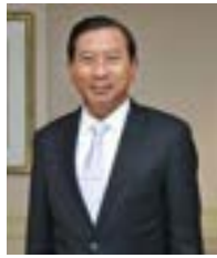
พลเอก ฉัตรชัย สาริกัลยะ ประธานคณะกรรมการ