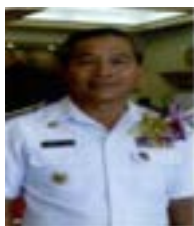
พลเรือตรี กรบุญญพัฒน์ ไพริระย่อเดช ที่ปรึกษาคณะกรรมการ