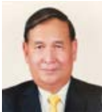
พลเอก ปฐมพงศ์ ประถมภักดิ์ ที่ปรึกษาคณะกรรมาธิการ