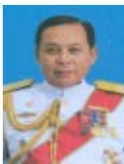
พลเรือเอก ศักดิ์สิทธิ์ เชิดบุญเมือง ประธานคณะทำงาน