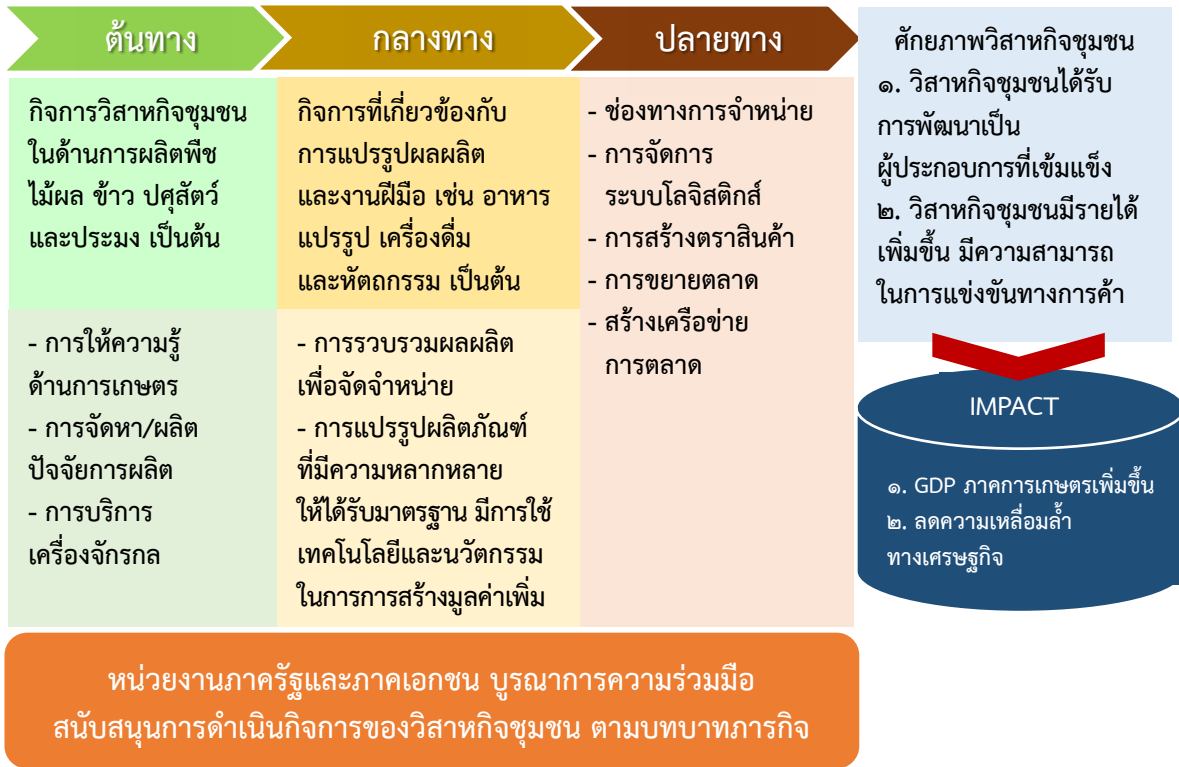
แผนภาพที่ ๒ บทบาทของวิสาหกิจชุมชนภาคการเกษตรในการขับเคลื่อนเศรษฐกิจฐานราก ตลอดห่วงโซ่อุปทาน

๕.๑.๕ ปัญหาในการดำเนินงานของวิสาหกิจชุมชนภาคการเกษตร จากผู้แทนวิสาหกิจชุมชนภาคการเกษตรที่นำเสนอข้อมูลและข้อคิดเห็นผลการประกอบกิจการของวิสาหกิจชุมชนภาคการเกษตรจำนวน ๗ ประเภท ในการประชุมและการศึกษาดูงาน/ตรวจเยี่ยมวิสาหกิจชุมชนภาคการเกษตรของคณะอนุกรรมการด้านการสหกรณ์ และสถาบันเกษตรกรอื่น ในคณะกรรมการการเกษตรและสหกรณ์ วุฒิสภา รวมถึงการศึกษาเอกสารรายงานจากหน่วยงานภาครัฐที่เกี่ยวข้องกับวิสาหกิจชุมชนภาคการเกษตร พบว่า ในการพัฒนาวิสาหกิจชุมชนภาคการเกษตรให้มีการยกระดับศักยภาพให้มีความเข้มแข็งและพร้อมเข้าสู่การดำเนินธุรกิจในระดับที่สูงขึ้นไปนั้น มีปัญหาที่เกิดขึ้นใน ๒ ส่วนคือ ปัญหาของวิสาหกิจชุมชนภาคการเกษตรในการดำเนินงานตลอดห่วงโซ่อุปทาน และปัญหาของหน่วยงานภาครัฐที่เกี่ยวข้องกับการดำเนินงานของวิสาหกิจชุมชนภาคการเกษตรตลอดห่วงโซ่อุปทานสรุปได้ ดังนี้