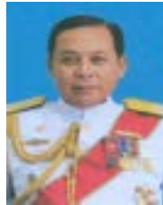
พลเรือเอก ศักดิ์สิทธิ์ เขียดบุญเมือง ที่ปรึกษาคณะกรรมาธิการ