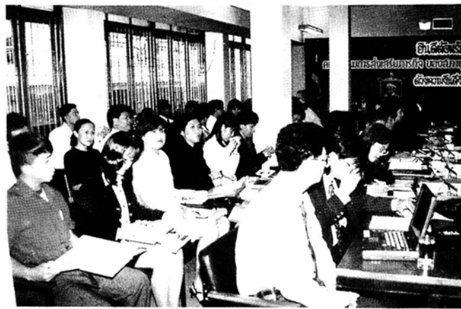
การเยี่ยมชมและรับฟังการบรรยายสรุป ณ สำนักงานการปฏิรูปที่ดินเพื่อการเกษตร ในวันที่ 29 เมษายน 2540