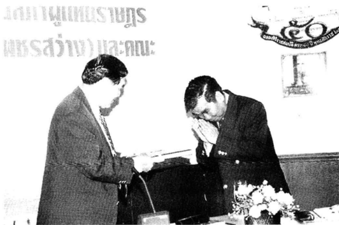
การเยี่ยมชมและรับฟังการบรรยายสรุป ณ กรมอาชีวศึกษา ในวันที่ 8 เมษายน 2540