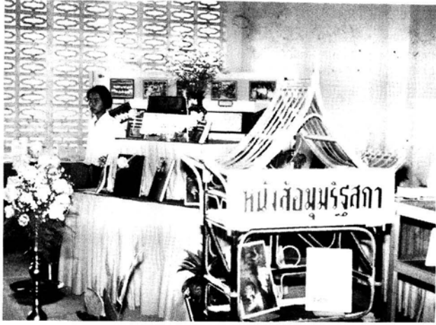
หนังสือที่โครงการฯ นำไปมอบให้ โรงเรียนเพื่อจัดเป็นมุมรัฐสภา