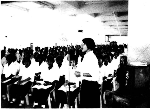
นักเรียนที่ชนะการประกวดบทความ นำเสนองาน