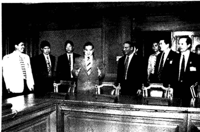
การเยี่ยมชมและรับฟังการบรรยายสรุป ณ สำนักงานคณะกรรมการกฤษฎีกา ในวันที่ 31 มกราคม 2540