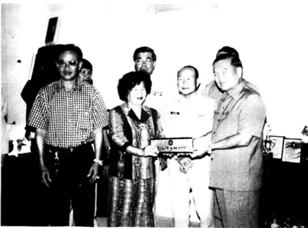
ประธานคณะกรรมการฯ มอบมุมรัฐสภาให้ ผ.อ. โรงเรียน ขลุ่ยระนาดภิเษก จังหวัดจันทบุรี