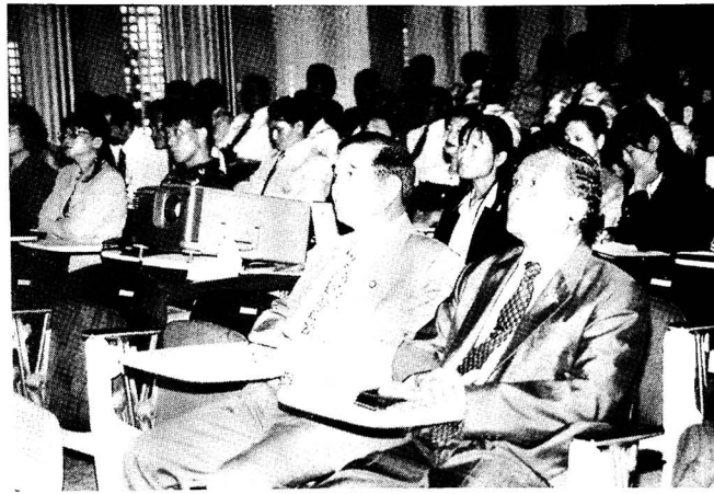
การเยี่ยมชมและรับฟังการบรรยายสรุป ณ กรมป่าไม้ ในวันที่ 30 เมษายน 2540