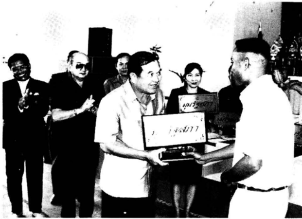
ประธานคณะกรรมการฯ มอบมูวรัฐสภาให้แก่ตัวแทนโรงเรียน ที่เข้าร่วมโครงการฯ ณ โรงเรียน ศิวภุมวิทสัย จังหวัดสุรินทร์