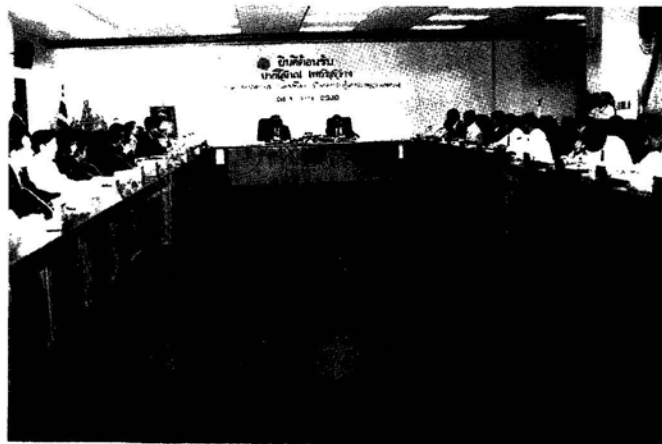
การเยี่ยมชมและรับฟังการบรรยายสรุป ณ กระทรวงยุติธรรม ในวันที่ 28 มกราคม 2540