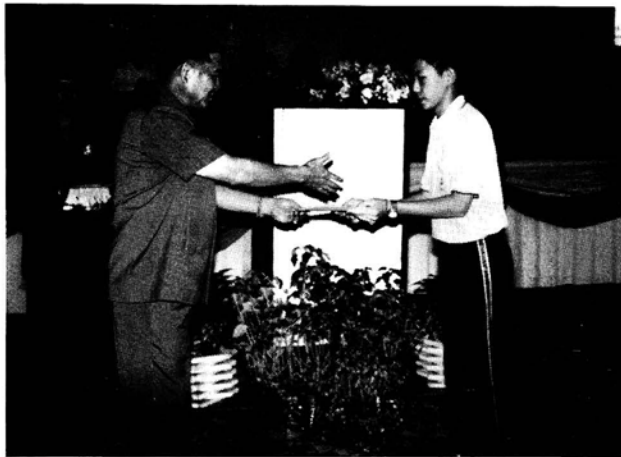
ประธานคณะกรรมการฯ มอวรางวัล และใบประกาศเกียรติคุณ แก่นักเรียน ที่ชนะการประกวดบทความ