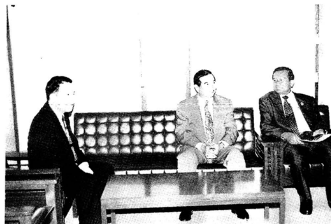
การเยี่ยมชมและรับฟังการบรรยายสรุป ณ กรมป่าไม้ ในวันที่ 30 เมษายน 2540