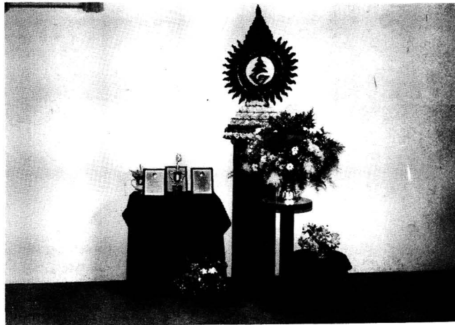
มุนรัฐสภา