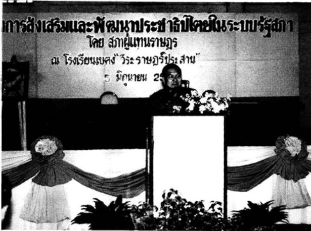
ประธานคณะกรรมการฯ กล่าวปาฐกถาแก่เด็กนักเรียน