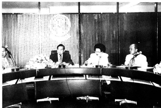
การเยี่ยมชมและรับฟังการบรรยายสรุป ณ กรมสามัญศึกษา ในวันที่ 8 เมษายน ๒๕๔๐