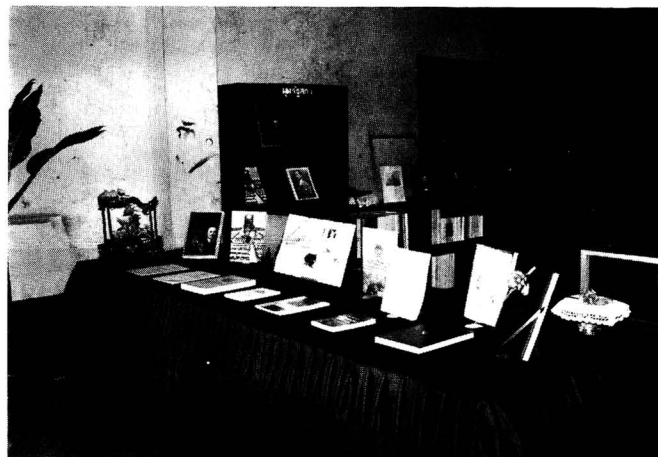
นิทรรศการมุนรัฐสภาโรงเรียนหนองก๊กพิทยาคม จังหวัดบุรีรัมย์