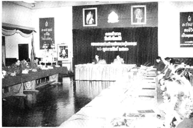
การเยี่ยมชมและรับฟังการบรรยายสรุป ณ กรมตำรวจ ในวันที่ 26 กรกฎาคม ๒๕๔๐