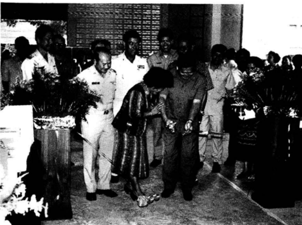
ประธานคณะกรรมการฯ ทำพิธีเปิดมุมรัฐสภา