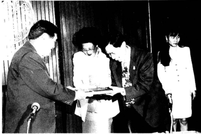
การเยี่ยมชมและรับฟังการบรรยายสรุป ณ กรมสามัญศึกษา ในวันที่ 8 เมษายน 2540