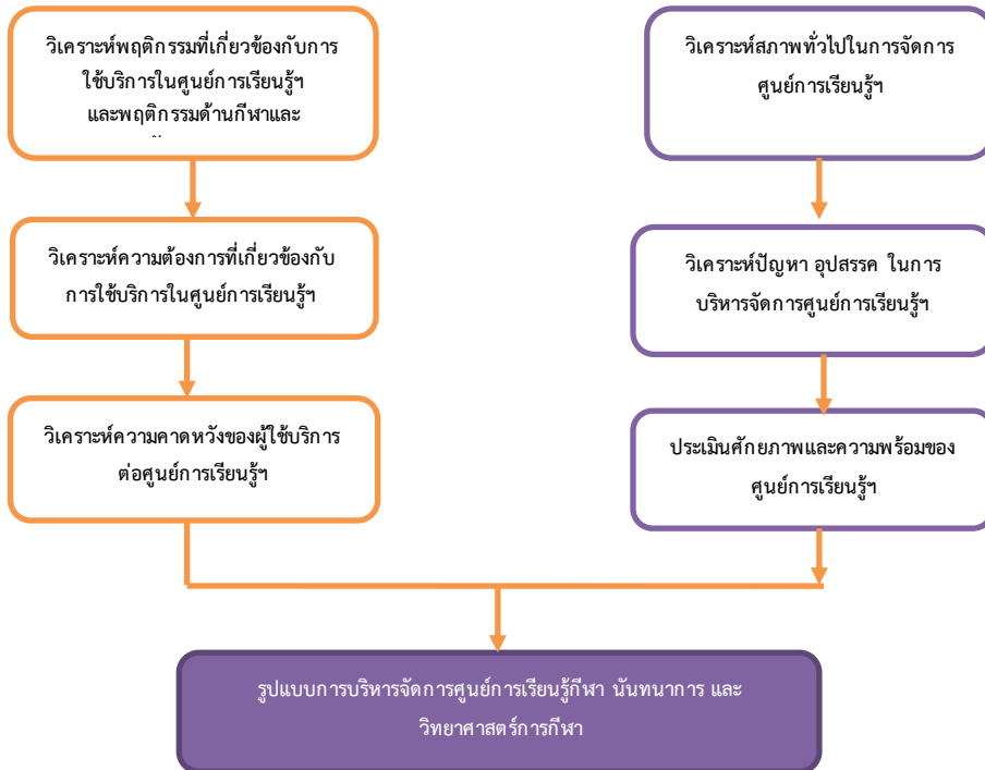
ภาพที่ ๑ กรอบแนวคิดของการวิจัย

จากการทบทวนวรรณกรรมที่เกี่ยวข้องสามารถกำหนดกรอบแนวคิดของการวิจัยเรื่อง แผนงานรูปแบบการบริหารจัดการศูนย์การเรียนรู้กีฬา นันทนาการ และวิทยาศาสตร์การกีฬาในสังกัดกรมพลศึกษา ได้ดังนี้