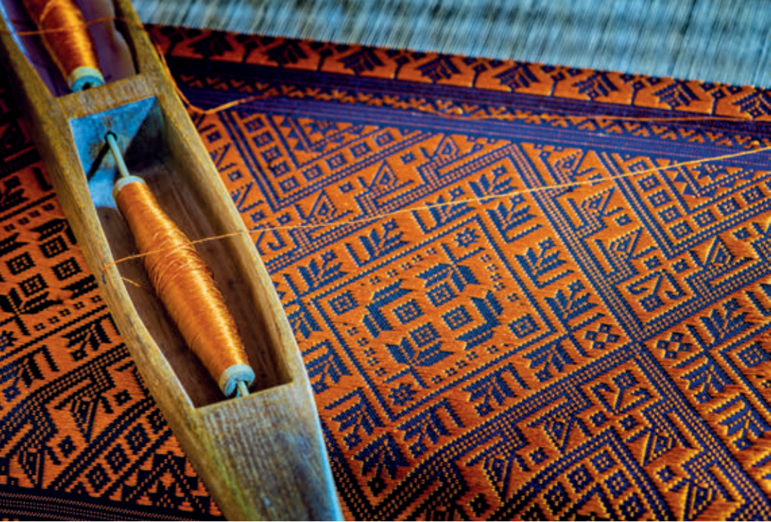
ผ้าแพรวา “แพรวา” หรือ “ผ้าไหมแพรวา”

ยังมีกิจกรรมอีกหลากหลาย ทั้งการรวบรวมข้าวเปลือกมาร่วมทำพิธีบุญคุณลาน ขบวนแห่พานบายศรี เครื่องบูชาพระแม่โพสพ แห่งปราสาททรงข้าวจำลอง พิธีทำบุญตักบาตรและถวายปราสาทรวงข้าว รวมทั้งการแข่งขันเรือยาวชิงถ้วยพระราชทานสมเด็จพระเทพรัตนราชสุดาฯ สยามบรมราชกุมารี สอบถามข้อมูลได้ที่ เทศบาลตำบลเหนือ โทร. ๐ ๔๓๘๔ ๐๘๒๒ การท่องเที่ยวแห่งประเทศไทย สำนักงานขอนแก่น โทร. ๐ ๔๓๒๒ ๗๗๑๔-๕