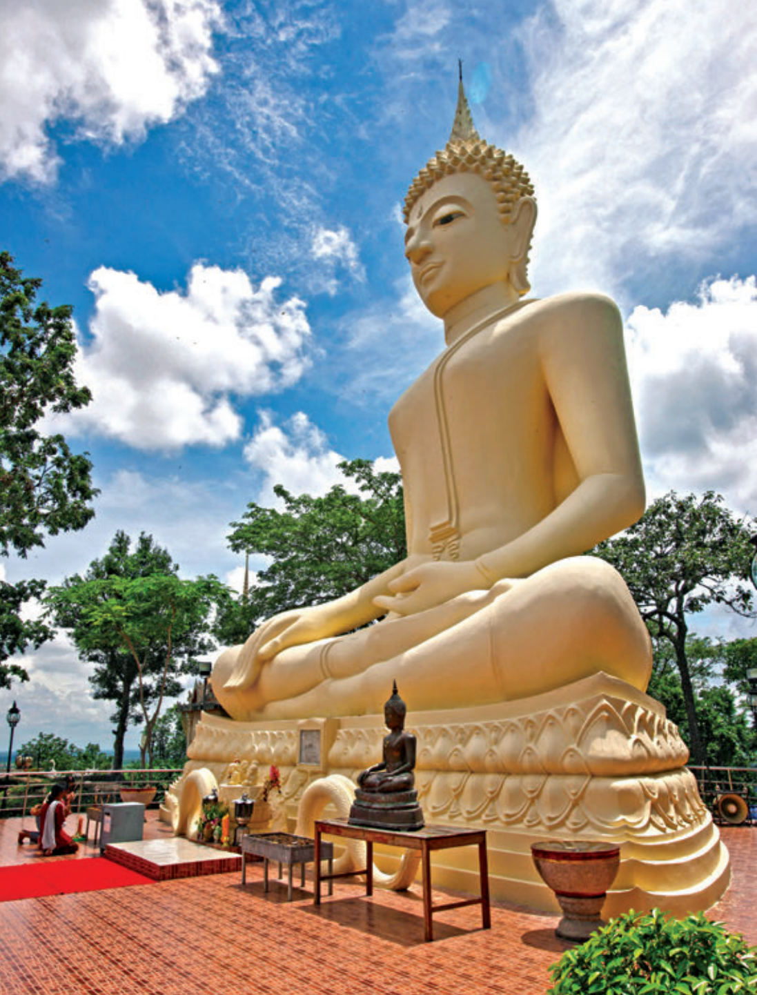
พระพรหมภูมิปาโล วัดพุทธาวาส (กุสิงห์)