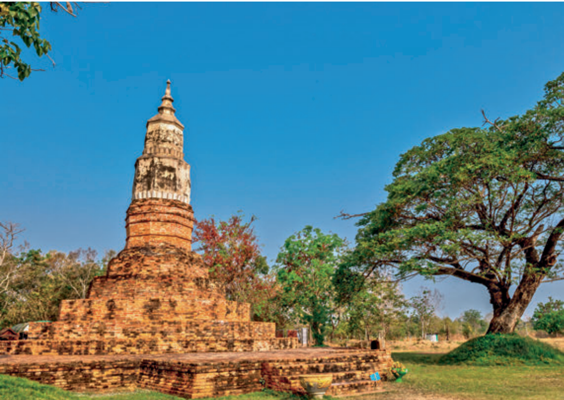
พระธาตุยาकु หรือพระธาตุใหญ่

วัดโพธิ์ชัยเสมาราม อยู่บ้านเสมา ตำบลหนองแปน ตรงข้ามกับทางเข้าเมืองฟ้าแดดสงยาง เป็นวัดเก่าที่ชาวบ้านได้นำใบเสมาหินที่ขุดพบมารวบรวมไว้จำนวนมาก มีใบเสมาหินขนาดใหญ่ที่อาจถือเป็นเอกลักษณ์ของอีสานเนื่องจากแทบจะไม่พบในภาคอื่นเลย ใบเสมาที่พบในเมืองฟ้าแดดสงยางมีความโดดเด่น คือ นิยมแกะสลักภาพเล่าเรื่องราวพุทธ