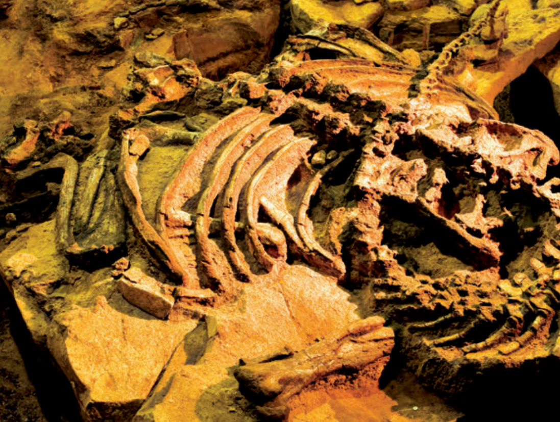
กระดูกไดโนเสาร์ ค้นพบโดยพระครูวิจิตรสหัสคุณ ภายในพิพิธภัณฑสถานแห่งชาติสุรินทร์

อยู่ จึงมีการย้ายมาประดิษฐานไว้ที่วัดสั๊กกะวัน เมื่อเดือนพฤษภาคม พ.ศ. ๒๕๑๐ เป็นต้นมา