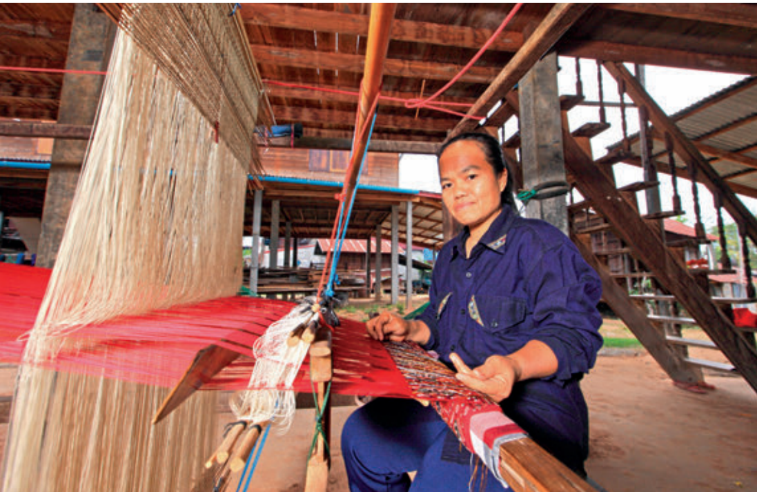
หมู่บ้านทอผ้าไหมแพรวาบ้านโพน

หมู่บ้านทอผ้าไหมแพรวาบ้านโพน อยู่ตำบลโพน เป็นหมู่บ้านชาวผู้ไทยที่เป็นแหล่งทอผ้าไหมแพรวาอันมีเอกลักษณ์และมีชื่อเสียง ซึ่งเดิมการทอผ้าไหมแพรวาเป็นเพียงวิถีชีวิตของชาวผู้ไทยที่ทอใช้เป็นผ้า