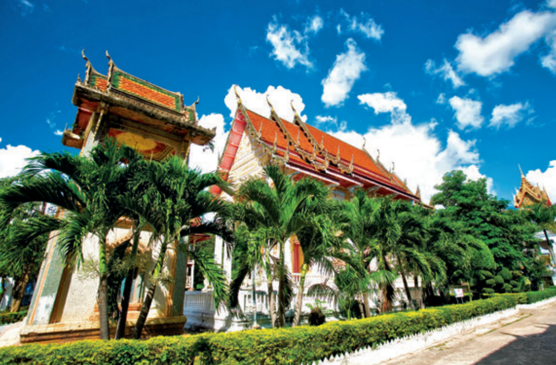
วัดศรีบุญเรือง (วัดเหนือ)

วัดศรีบุญเรือง (วัดเหนือ) อยู่ถนนอนรรฆวนาค ตำบลกาฬสินธุ์ ใกล้กับวัดกลาง เป็นวัดเก่าแก่ในเขตเทศบาลเมือง ซึ่งมีเสมาจำหลักเมืองฟ้าแดดสงยาง จำนวนหนึ่งเก็บรักษาไว้ โดยปักไว้รอบพระอุโบสถหลักเสมาจำหลักที่สวยงาม คือ หลักที่จำหลักเป็นรูปเทวดาเหาะอยู่เหนือปราสาททำเป็นซุ้มเรือนแก้ว ศิลปะแบบทวารวดี ซ้อนกันเป็น ๒ ชั้น ด้านล่างสุดมีรูปกษัตริย์ พระมเหสี และพระราชโอรส