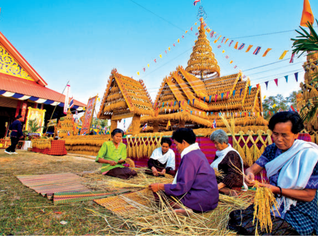
งานประเพณีบุญบายศรีสู่ขวัญข้าวคุณลาน (ปราสาทรวงข้าว)

แพร่หลายทั่วไป เพื่อเป็นการสร้างอาชีพและรายได้ให้กับชาวผู้ไทย ภายในงานมีกิจกรรมที่น่าสนใจ อาทิ การประกวดผ้าไหมแพรวา การแสดงแบบชุดแพรวา นิทรรศการผ้าไหมแพรวา การแสดงศิลปวัฒนธรรมพื้นเมืองกาฬสินธุ์ การออกร้านจำหน่ายผ้าไหมแพรวาและอาหารท้องถิ่น ฯลฯ สอบถามข้อมูลได้ที่ สำนักงานปกครองจังหวัดกาฬสินธุ์ โทร. ๐ ๔๓๘๑ ๑๒๑๓ การท่องเที่ยวแห่งประเทศไทย สำนักงานขอนแก่น โทร. ๐ ๔๓๒๒ ๗๗๑๔-๕