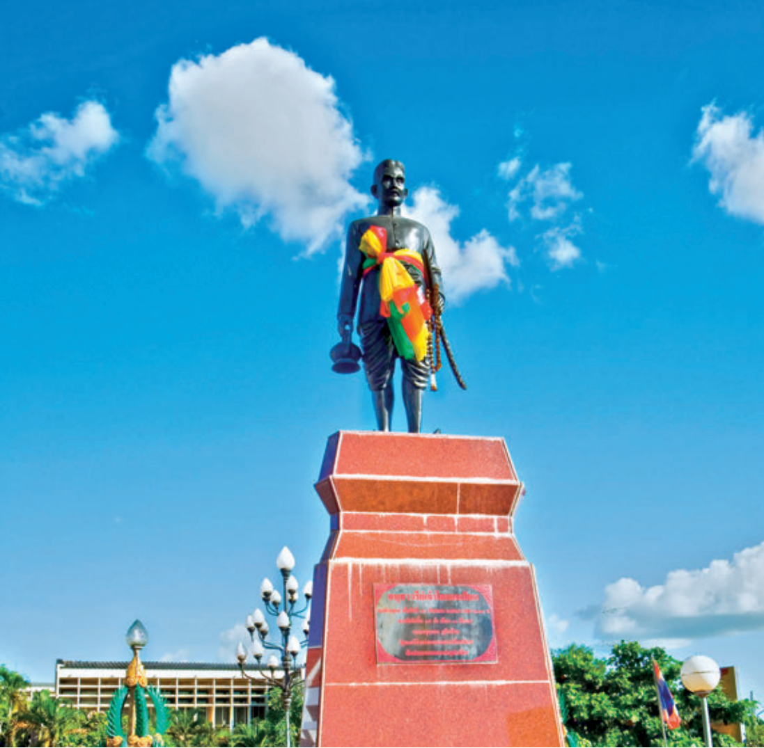
อนุสาวรีย์พระยาชัยสุนทร (ท้าวโสมพะมิตร)

สุนทรหล่อด้วยสัมฤทธิ์เท่าตัวจริงยืนบนแท่น มือขวาถือกาน้ำ มือซ้ายถือดาบอาญาสิทธิ์ ชาวกาฬสินธุ์ได้ร่วมกันก่อสร้างอนุสาวรีย์ขึ้น เพื่อแสดงกตเวทิตาต่อผู้ก่อตั้งเมืองกาฬสินธุ์