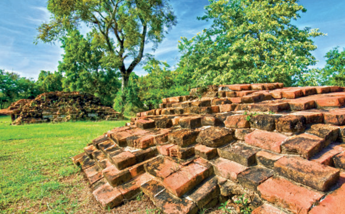
เมืองฟ้าแดดสงยาง

การเดินทาง จากอำเภอกุฉินารายณ์ ใช้ทางหลวงหมายเลข ๒๐๔๒ ประมาณ ๑๒ กิโลเมตร ถึงบ้านนาไคร้ แล้วเลี้ยวซ้ายไปตามถนนลาดยาง ตรงไปอีก ๓ กิโลเมตร ถึงบ้านโคกโก่ง