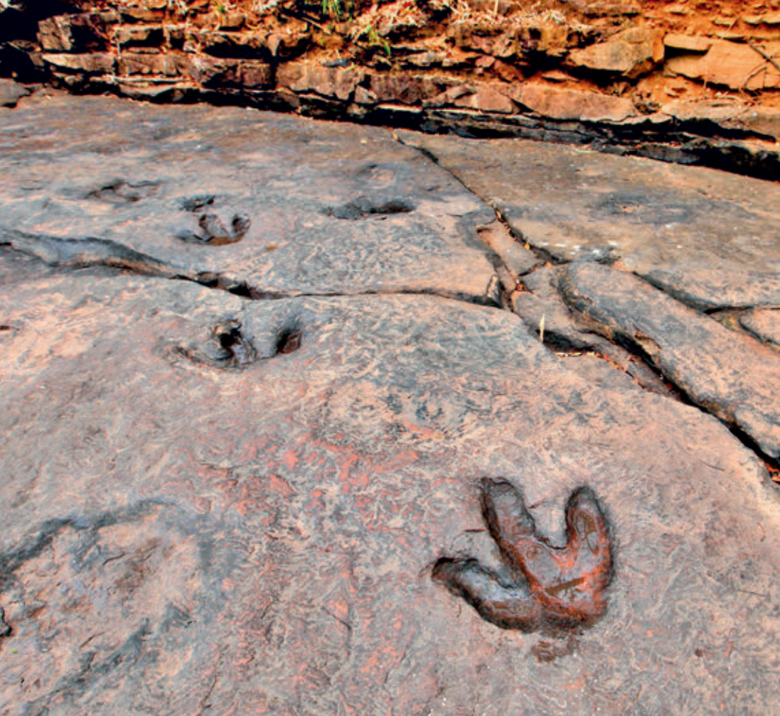
วนอุทยานภูแฝก (แหล่งรอยเท้าไดโนเสาร์)

สไบเท่านั้น จนกระทั่งในวันที่ ๒๙ พฤศจิกายน พ.ศ. ๒๕๒๐ สมเด็จพระนางเจ้าสิริกิติ์ พระบรมราชินีนาถ (ในรัชกาลที่ ๙) เสด็จพระราชดำเนินเยี่ยมพสกนิกรที่อำเภอคำม่วง ทรงทอดพระเนตรเห็นผ้าไหมแพรวา ทรงสนพระทัยและทรงให้คำแนะนำ เพื่อส่งเสริมพัฒนาผ้าไหมแพรวาที่ชาวบ้านทออยู่ให้สามารถใช้ตัดเสื้อได้ เป็นการอนุรักษ์ให้ผ้าไหมแพรวาได้รับการสืบสานต่อยอด พร้อมกันนี้พระองค์ทรงรับผ้าไหมแพรวาไว้ในโครงการศิลปาชีพอีกด้วย