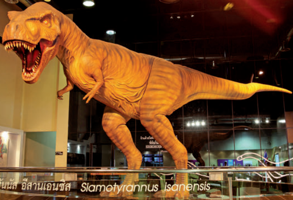
โมเดลไดโนเสาร์ อีสานเอนทิส Siamotyrannus isanensis