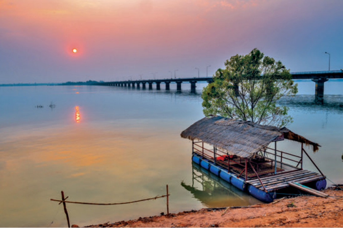
สะพานเทพสุดา

เขตแดนเหนือองค์พระตกแต่งด้วยประติมากรรมไม้แกะสลักนูนต่ำเรื่องพุทธประวัติ ทาสีทอง นอกจากนี้ยังมี “วิหารสังฆนิมิต” ซึ่งเป็นที่เก็บพระพุทธรูปและพระเครื่องรุ่นต่าง ๆ ที่หายาก สถานที่สำคัญอีกแห่งหนึ่งของวัดนี้คือ “พระมหาธาตุเจดีย์พุทธนิมิต” เป็นเจดีย์ยอดทองคำหนัก ๓๐ กิโลกรัม ภายในประดิษฐานพระบรมสารีริกธาตุจาก ๕ ประเทศ ได้แก่ ไทย อินเดีย ศรีลังกา เนปาล และพม่า รวมทั้งพระอรหันตธาตุ พระพุทธรูปนิตลึงค์ และพระพุทธรูปหินทรายอีกเป็นจำนวนมาก