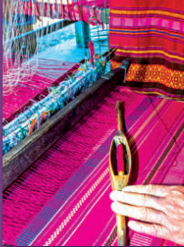
ผ้าแพรวา