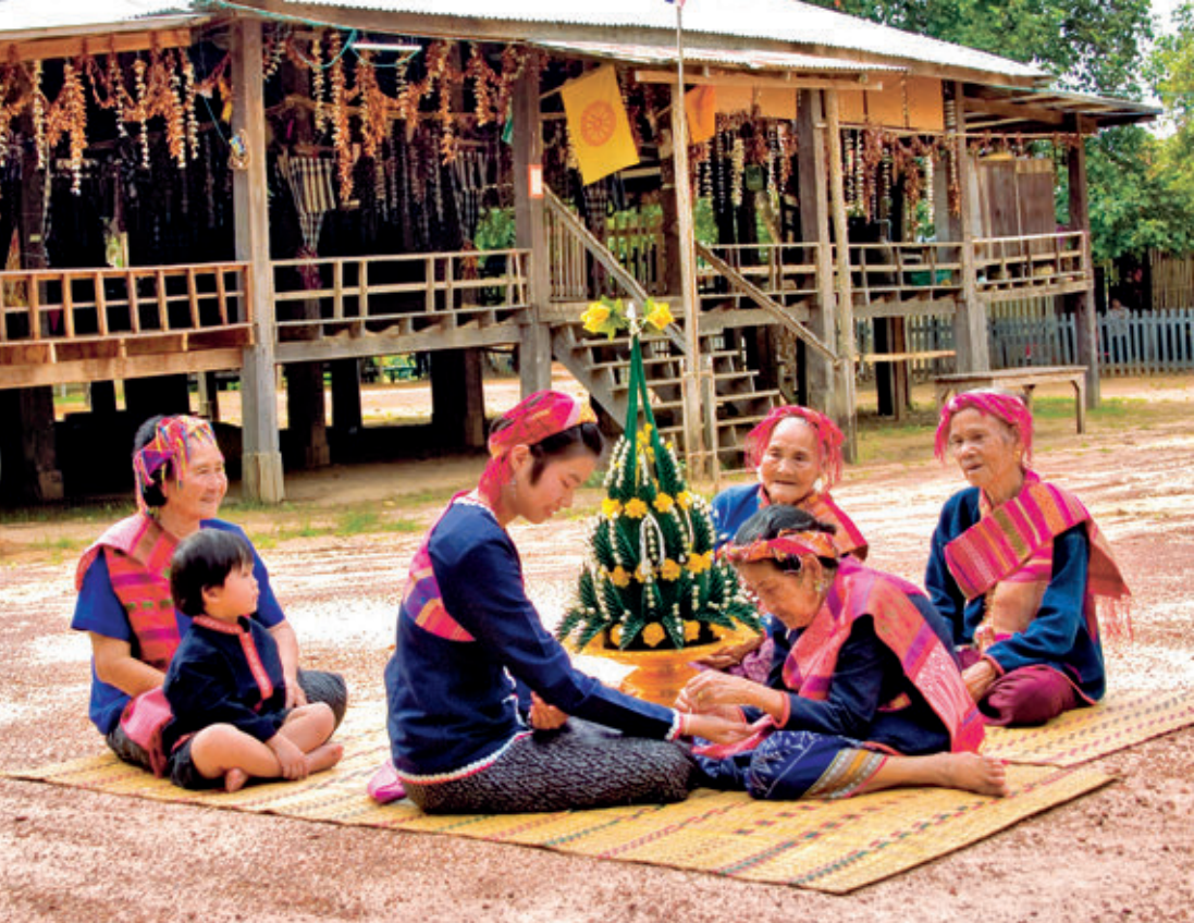
หมู่บ้านวัฒนธรรมผู้ไทยบ้านโคกไก่อ่ง

การเดินทาง จากอำเภอเขาวง ใช้ทางหลวงหมายเลข ๒๒๙๑ ต่อด้วยทางหลวงชนบท กส. ๔๐๓๐ และทางหลวงชนบท กส. ๕๐๗๔ ระยะทางจากอำเภอเขาวง ประมาณ ๑๔ กิโลเมตร