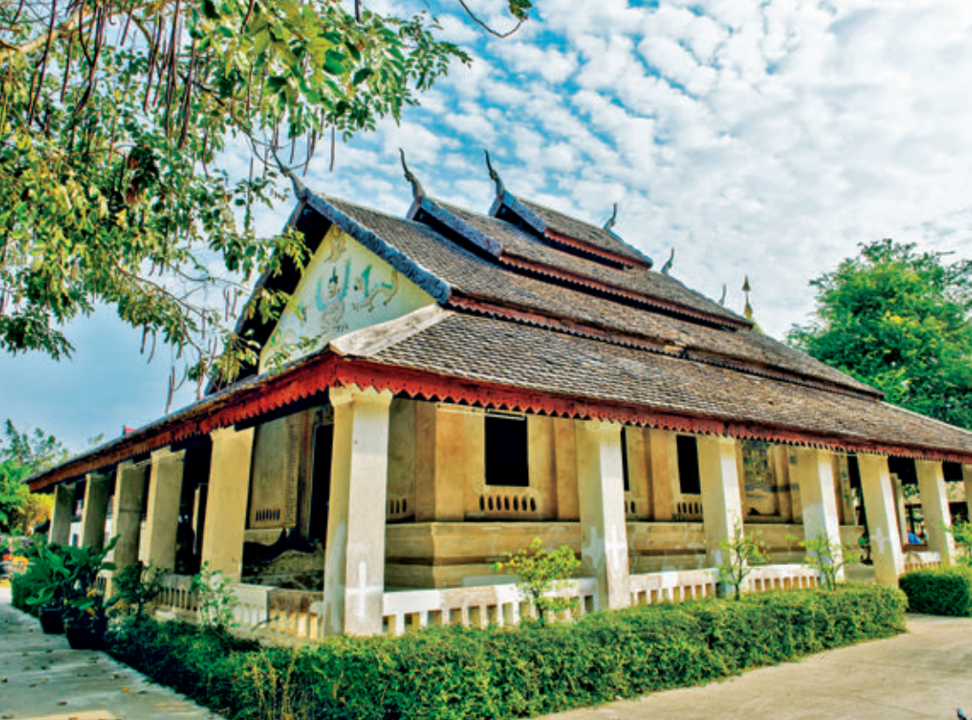
ลิม วัดอุดมประชาราษฎร์

ศึกษาในทางการแพทย์ มุ่งเน้นสื่อให้เห็นถึงสัจธรรม เรื่องสังขารที่ไม่เที่ยง และ “อุโบสถกลางน้ำ” เป็น อุโบสถไม้ที่ตั้งดงาม ภายในประดิษฐานพระพุทธรูปชิน ปัญญาเป็นพระประธานภายในอุโบสถ วัดแห่งนี้ยังมี “พุทธบูชาคลินิก” ซึ่งให้การรักษาพยาบาล ผู้เจ็บป่วยโดยไม่คิดค่ารักษาอีกด้วย