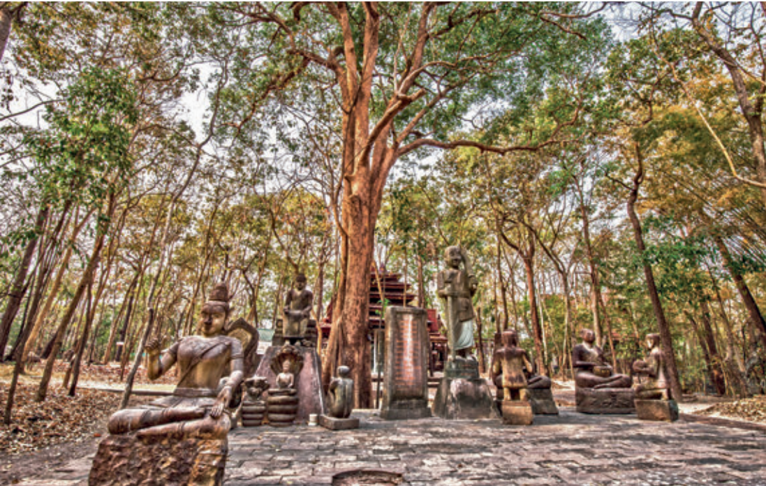
วัดพุทธนิมิต (ภูค่าว)

ภายในวัดยังมี “พระอุโบสถไม้” เป็นพระอุโบสถ แบบเปิด สร้างจากไม้ได้เชื่อมลำปาว เป็นอาคารไม้ ทรงไทย ตั้งบนฐานลวดบัวปูนปั้น หลังคาจั่วซ้อน กันสามชั้น มีชายคาปีกนกทั้งสองด้าน รอบพระอุโบสถ แกะสลักลวดลายงดงามเป็นภาพสามมิติและภาพปูน ต่ำเป็นเรื่องราวพุทธประวัติ ทศชาติชาดก และพระ เวสสันดรชาดก ภายในพระอุโบสถไม้ประดิษฐาน “พระมงคลชัยสิทธิ์โรจนฤทธิ์ประสิทธิพร” เป็นพระ ประธานปางตรัสรู้หรือปางสมาธิสีทองสุกอร่าม โดม