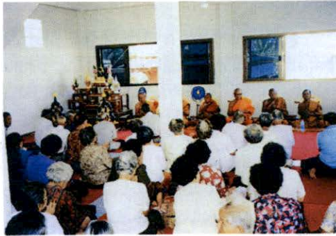
บุญเข้าพรรษา

ต่อจากนั้นพระสงฆ์จะพร้อมกันทำวัตรสวดมนต์ จบแล้วทำวัตรพระพุทธรูป เพราะวันเพ็ญเดือนแปดถือว่าเป็นวันพระพุทธรูปเข้าพรรษาด้วย พระสงฆ์จัดเครื่องสักการะมาพร้อมกันแล้ว ให้เจ้าอาวาสเป็นตัวแทนพระพุทธรูป นั่งหันหน้าลงมาทางพระสงฆ์ พระสงฆ์ทั้งหลายนั่งคุกเข่า กราบ ๓ คน ยกขันดอกไม้ไปตั้งไว้ข้างหน้า แล้วกล่าวคำทำวัตรพระพุทธรูป จบแล้วเจ้าอาวาสจะให้โอวาทเกี่ยวกับการเข้าพรรษา พระพุทธรูปเป็นสรีจพิจิ