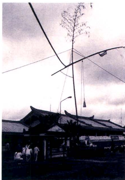
เสาโกเต็ง สัญลักษณ์ของพิธีกินเจ