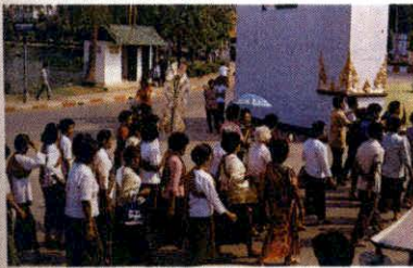
แห่กัณฑ์เทศน์