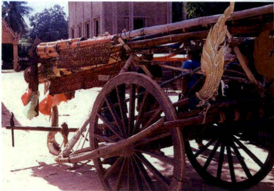
เสลี่ยงไฟ