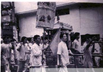
ขบวนแห่ไม้ของเทศบาลต่างๆ ในพิธีกินเจที่ภูเก็ต