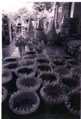
พิธีบูชาเทพเจ้าในพิธีกินเจที่ภูเก็ต