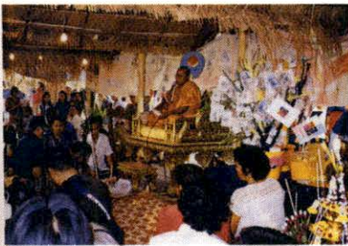
บุญพระเวสส์

พระภิกษุที่เทศน์แต่ละกัณฑ์นั้น จะมีเจ้าภาพถวายจตุปัจจัยประจำแต่ละกัณฑ์ แต่จะมีกัณฑ์อีกประเภทหนึ่งที่บรรดาหนุ่มสาวแห่เข้ามาขังวัดโดยไม่เจาะจงว่าจะถวาย กัณฑ์ใดหากแต่เข้ามาถึงในวัดในขณะใด พระภิกษุของวัดใดกำลังเทศน์อยู่ ก็จะ ถวายของตนั้น กัณฑ์ที่แห่เข้ามานี้เรียก กัณฑ์หลอน การแห่กัณฑ์หลอนนี้ บางที่มี เสียงอึกทักกรีกโครม แต่ชาวบ้านเขาไม่ถือสาหาความ ถือว่าเป็นการทำบุญกุศล บางแห่งมีกัณฑ์หลอนแห่กันตลอดวันตลอดคืนก็มี