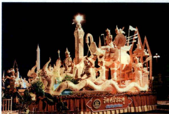
แห่สมิทธิเจ้าพระยา

ในตอนปลายทางวัดจะตีกลองโหม ให้ประชาชนพากันนำขี้ไฟมารวมกันที่วัด แล้วจัดการให้มีการแห่ขี้ไฟ มีขบวนแห่ ขบวนเซ็งขี้ไฟ มีการเล่นตลก ทอดแห หาปลา ฯลฯ การแห่ขี้ไฟนั้นมีการเซ็ง คำเซ็ง มีเกือบทุกประเภท เช่น สุภาษิต คำสอน การทำมาหากิน เซ็งตลกหยาบโตน ซึ่งการเซ็งในงานบุญขี้ไฟนี้แม้จะหยาบโตน แต่บรรดาชาวบ้านทั้งหลายต่างก็ไม่ถือสา