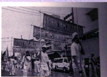
ขบวนเป่าซอเพื่อและธงประจำเขตของเทศบาล ในพิธีกินเจที่ภูเก็ต