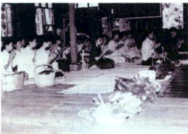
บุญข้าวประดับดิน

การทำบุญข้าวประดับดินของชาวบ้าน เมื่อถึงวันแรม ๑๓ ค่ำ เดือน ๙ ชาวบ้านจะจัดหาอาหารคาวหวานแบ่งออกเป็น ๔ ส่วน ส่วนหนึ่งสำหรับตนเอง ส่วนหนึ่งแจกญาติพี่น้อง ส่วนหนึ่งทำบุญอุทิศส่วนกุศลแก่ผู้ตาย ส่วนหนึ่ง ถวายทานแก่พระภิกษุสามเณร