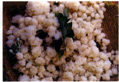
สักบทรข้าวพันก้อน