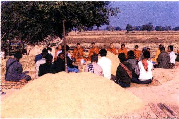
บุญคุณลาน

เมื่อพระสงฆ์เจริญพระพุทธมนต์ แล้วจึงถวายอาหารบิณฑบาต จากนั้นจึงเลี้ยง ญาติมิตร พระสงฆ์อนุโมทนา ประพรมน้ำพระพุทธมนต์ให้แก่ญาติมิตรผู้มาร่วมพิธี ตลอดจนนำไปประพรมลานข้าว นา ไร่ ทั่วราย เจ้าของนา เพื่อเป็นสิริมงคลต่อไป