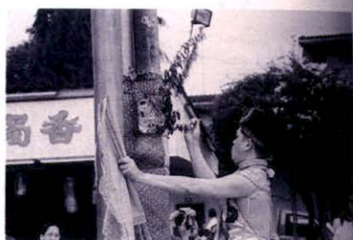
การประกอบพิธีกรรมที่สถานี