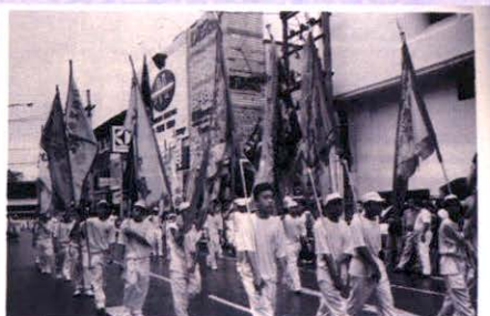
ชาวจีนในเขตภาคใต้ของประเทศไทย ไหว้พระจันทร์

ชาวจีนภาคใต้มีงานบุญทั่ว ๆ ไป เช่นเดียวกับชาวจีนในภาคอื่น ๆ ของไทย เช่น งานไหว้ศพไหว้บรรพบุรุษ ไหว้กิ้ง ไหว้เจ้า ไหว้พระจันทร์ เป็นต้น ส่วนที่เป็นงานบุญที่เด่นเป็นพิเศษของชาวจีนในภาคใต้ คือ งานประเพณีกินเจ ซึ่งกระทำกันใหญ่โตมากในภูเก็ต และที่ปัตตานี (คือ ประเพณีไหว้เจ้าแม่หลิมกอเหนี่ยว)