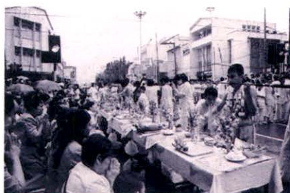
ประชาชนจัดโต๊ะบูชาเพื่อรอรับขบวนแห่ของเจ้าที่จะผ่านมา