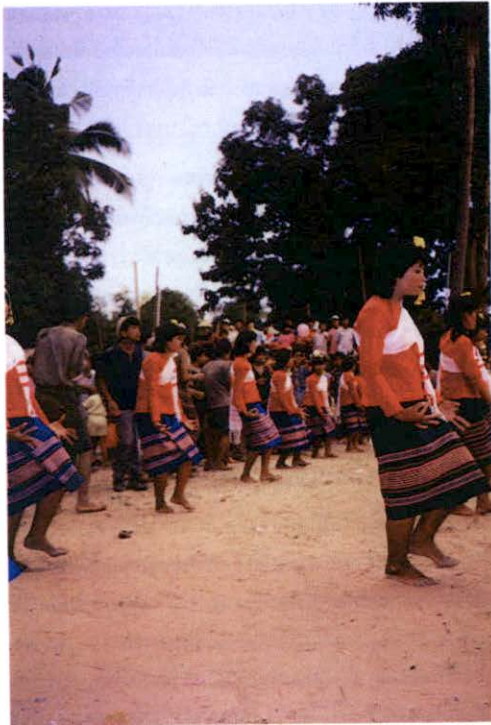
เซิ้งม้งไฟ