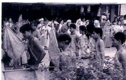
ขบวนรำวงของเจ้าในเทศกาลกินเจที่จังหวัดศรี