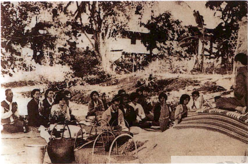
บุญข้าวใหญ่ (ภาพ - หนังสือนิทานพื้นบ้านไทย)

ในการทำบุญข้าวจี จะนิมนต์พระภิกษุสามเณรมาพร้อมกันที่ศาลาโรงธรรม จากนั้นอาราธนาศีล พระภิกษุสามเณรสวดมนต์ เสร็จแล้วอนุโมทนา อาจจะมีการ เทศน์ฉลองข้าวจีเทศน์หนึ่งสือลำต่าง ๆ ตลอดวัน ในการเทศน์ฉลองข้าวจีนั้น พระสงฆ์มักจะยกอาณิสยส่งแห่งทานข้าวจีที่นางปุดเนทาสีในสมัยพระพุทธกาลที่ทานข้าวจี ให้พระพุทธเจ้า และได้ฟังพระธรรมเทศนาจากพระพุทธเจ้า จนได้บรรลุโสดาบัน เป็นพระอริยบุคคลในพระพุทธศาสนา