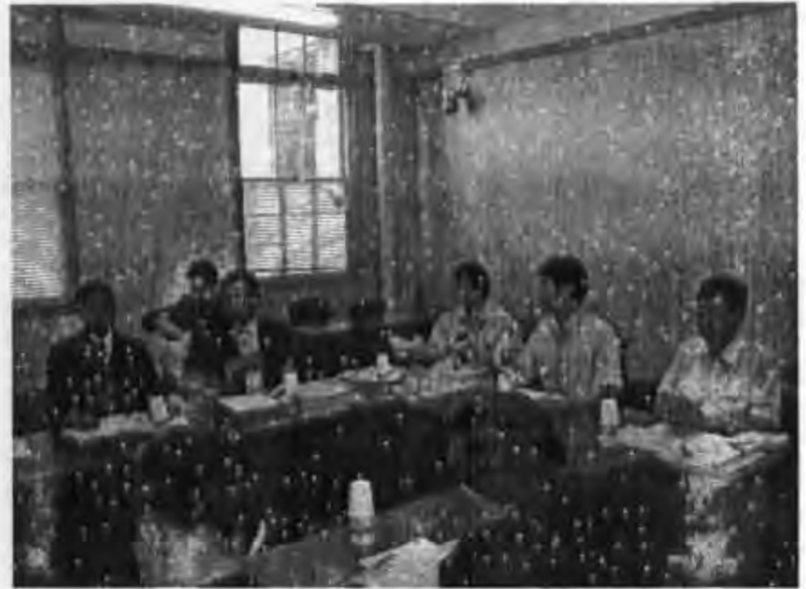
คณะกรรมการฯ เข้าพบผู้บริหาร

ปัจจุบันประเทศญี่ปุ่น มีประชากรที่มีอายุ ๖๕ ปีขึ้นไปประมาณร้อยละ ๑๐ เมื่อเทียบกับประเทศไทยในปัจจุบันนั้นเท่ากับประเทศญี่ปุ่นเมื่อปี ๑๙๗๕ ซึ่งเป็นปีที่เศรษฐกิจของประเทศญี่ปุ่นมีความเจริญเติบโตอย่างรวดเร็ว และพบปัญหาเรื่องผู้สูงอายุมีจำนวนเพิ่มมากขึ้นอย่างรวดเร็วตามไปด้วย