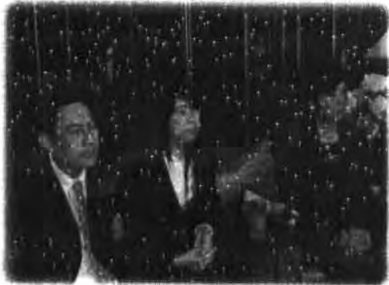
การเข้าเยี่ยมชมการระแอกอัครราชทูต ไทยประจำกรุงโตเกียว