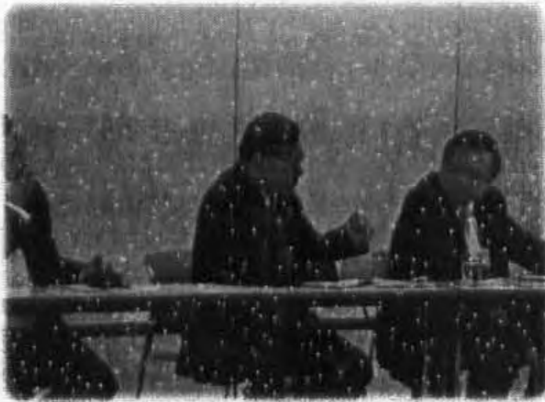
การเข้าพบผู้บริหารองค์กรเพื่อการฟื้นฟู และช่วยเหลือคนพิการแห่งญี่ปุ่น

อย่างไรก็ตามแม้มีการจ่ายเบี้ยยังชีพผู้พิการให้กับผู้พิการแต่ก็ยังไม่สามารถแก้ไขปัญหาได้ เนื่องจากค่าครองชีพในประเทศญี่ปุ่นสูงมาก การจ่ายเบี้ยยังชีพจึงเป็นเพียงการบรรเทาปัญหาเท่านั้น