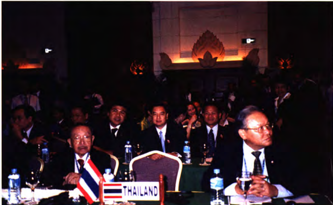
คณะผู้แทนไทย เข้าร่วมประชุมเต็มคณะ ครั้งที่ ๑ ของการประชุมสมัชชาใหญ่ขององค์การรัฐสภาอาเซียน ครั้งที่ ๒๕ ในวันที่ ๑๓ กันยายน ๒๕๕๗ ณ โรงแรมอินเตอร์คอนติเนนทัล