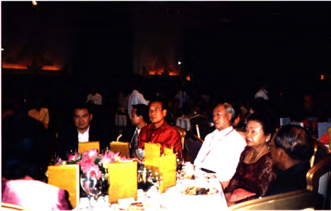
ประธานรัฐสภา และคณะผู้แทนไทย เข้าร่วมงานเลี้ยงต้อนรับ คณะผู้แทนประเทศสมาชิกองค์การรัฐสภาอาเซียน และประเทศผู้สังเกตการณ์พิเศษ ในวันที่ ๑๒ กันยายน ๒๕๕๗ ณ โรงแรมอินเทอร์คอนติเนนทัล