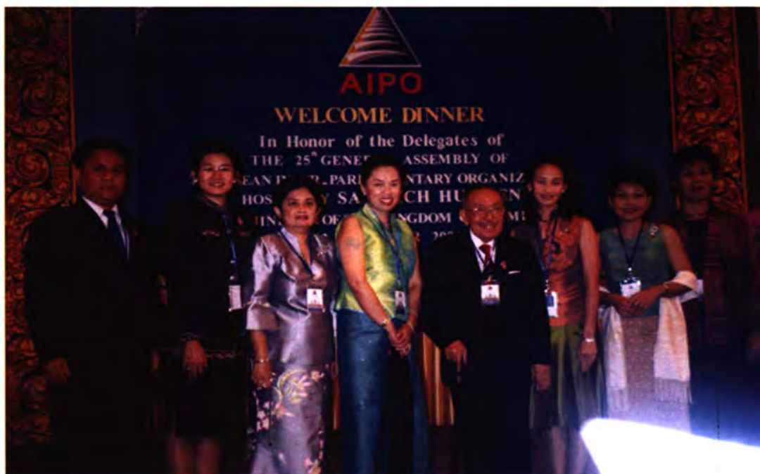
คณะผู้แทนไทย เข้าร่วมงานเลี้ยงอาหารค่ำในวันที่ ๑๓ กันยายน ๒๕๕๗ ณ โรงแรมอินเตอร์คอนติเนนทัล