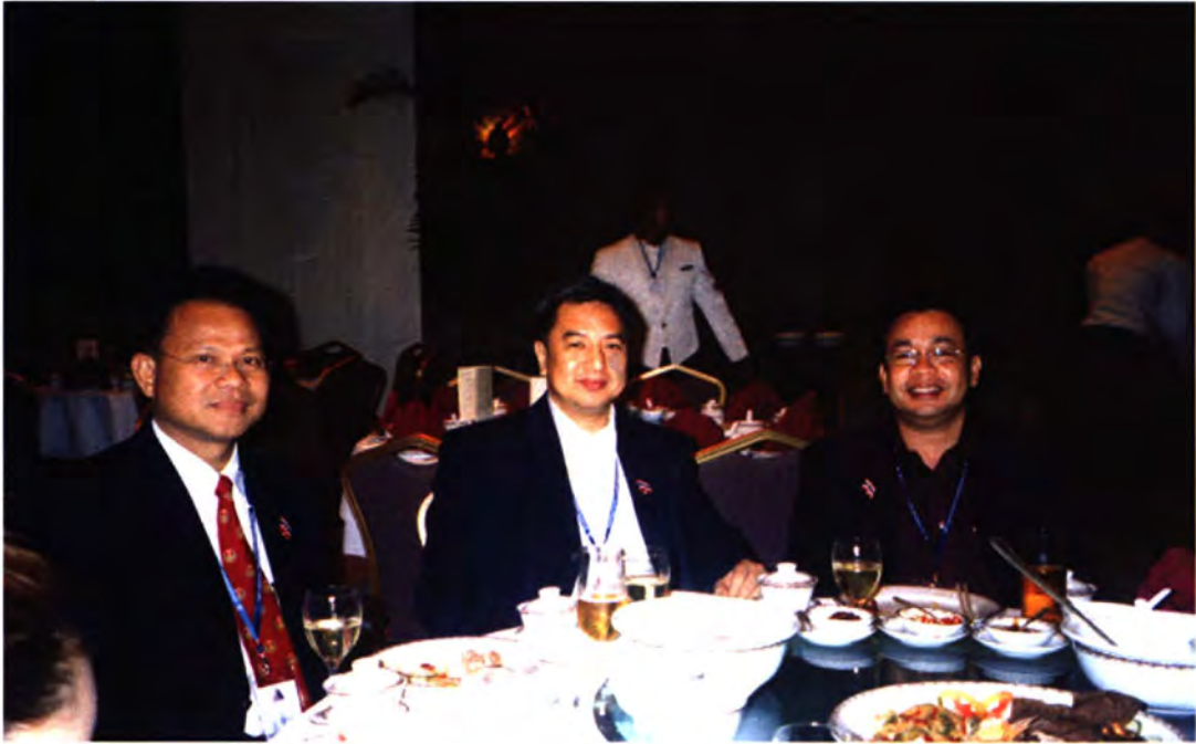
คณะผู้แทนไทย เข้าร่วมงานเลี้ยงอาหารค่ำ ในวันที่ ๑๓ กันยายน ๒๕๕๗