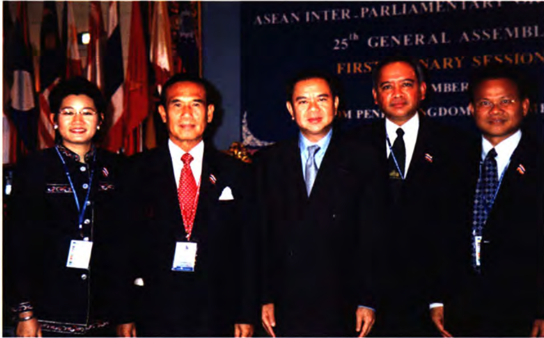
ประธานรัฐสภา ในฐานะหัวหน้าคณะผู้แทนไทย เข้าร่วมการประชุมเต็มคณะ ครั้งที่ ๑ ของการประชุมสมัชชาใหญ่ขององค์การรัฐสภาอาเซียน ครั้งที่ ๒๕ ในวันที่ ๑๓ กันยายน ๒๕๕๗ ณ โรงแรมอินเตอร์คอนติเนนทัล