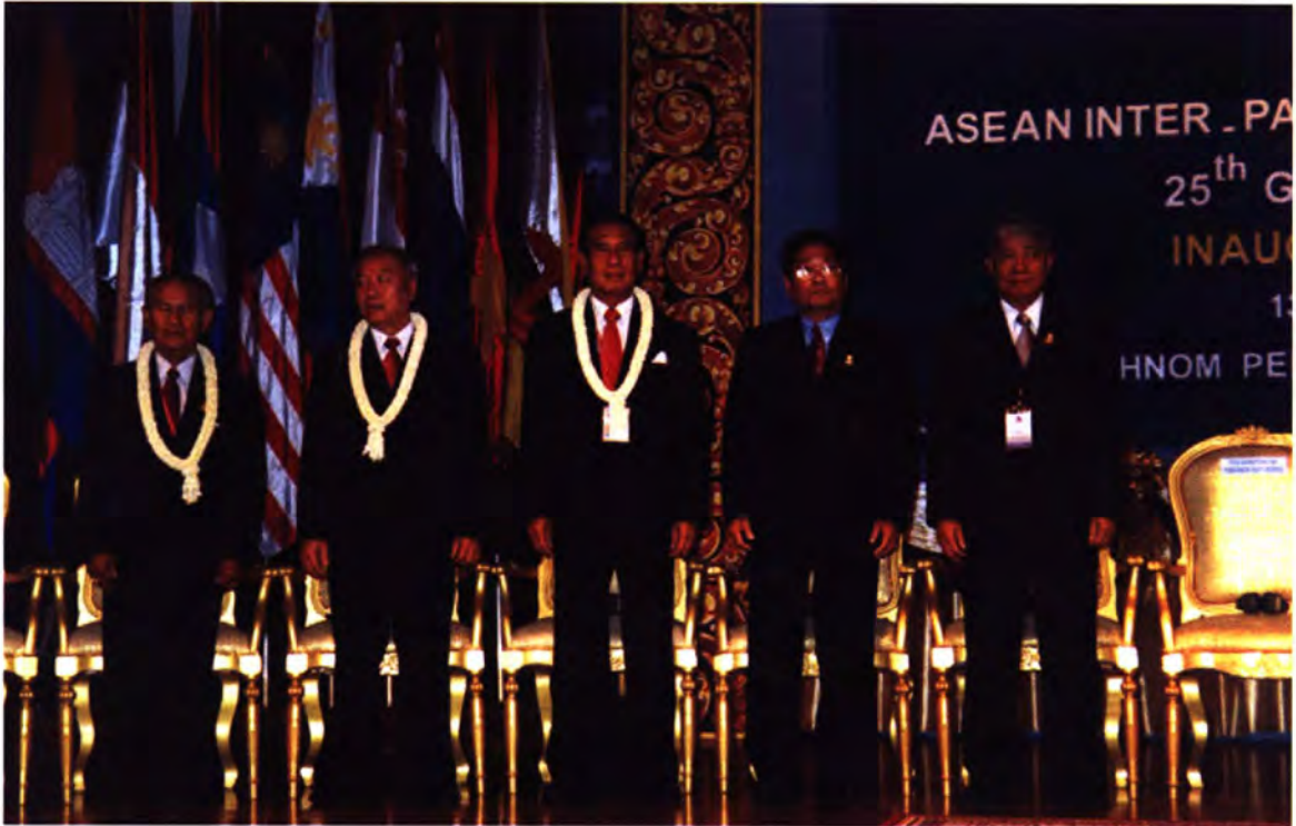
ประธานรัฐสภา ในฐานะหัวหน้าคณะผู้แทนไทย