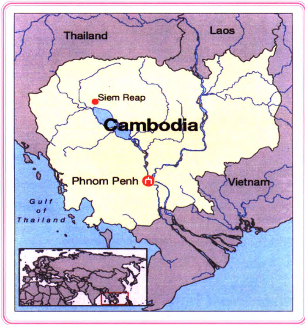
แผนที่ราชอาณาจักรกัมพูชา