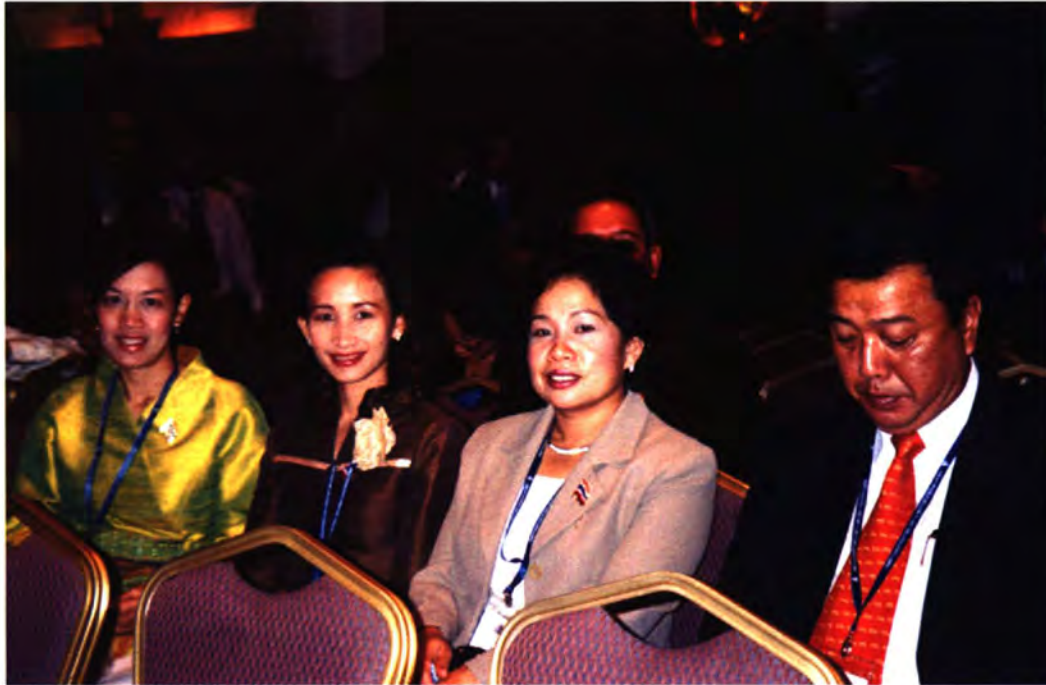
คณะผู้แทนไทย เข้าร่วมพิธีเปิดการประชุม และการประชุมเต็มคณะ ครั้งที่ ๑ ของการประชุมสมัชชาใหญ่องค์การรัฐสภาอาเซียน ครั้งที่ ๒๕ ในวันที่ ๑๓ กันยายน ๒๕๕๗ ณ กรุงพนมเปญ ราชอาณาจักรกัมพูชา