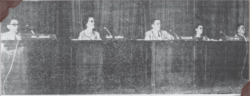
● สตรีชั้นนำอภิปรายปัญหาสังคมและภาพอ่างทรงผมปะแตกคามริ เจือวกับตอนไม้