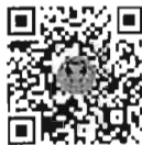
กระทู้ถามสด ด้วยวาจา