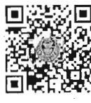
กระทู้ถามสด ด้วยวาจา