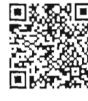
เอกสารประกอบ การพิจารณา สำนักวิชาการ