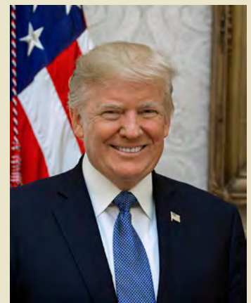
นายโดนัลด์ ทรัมป์

วันที่ ๑๐ กุมภาพันธ์ ๒๕๖๑ นายโดนัลด์ ทรัมป์ ประกาศการลงนามร่างกฎหมายงบประมาณที่สำคัญพร้อมกล่าวชื่นชมการผ่านร่างกฎหมายดังกล่าวจากทั้งสภาผู้แทนราษฎรและรัฐสภา และให้การสนับสนุนทหารว่ากองทัพทหารอเมริกันจะแข็งแกร่งยิ่งขึ้น และรัฐบาลจะให้ทุกอย่างแก่ทหาร ทั้งนี้ สมาชิกสภาผู้แทนราษฎรได้ลงมติ ๒๔๐ ต่อ ๑๘๖ เสียง สนับสนุนร่างงบประมาณดังกล่าว ซึ่งจะทำให้รัฐบาลสามารถขยายการใช้จ่ายเงินได้ไปจนกระทั่งถึงวันที่ ๒๓ มีนาคม และได้ยกเลิกการจำกัดการใช้จ่ายของรัฐบาลกลางประมาณ ๓๐๐,๐๐๐ ล้านดอลลาร์สหรัฐในช่วง ๒ ปีข้างหน้า จากที่ผ่านมารัฐสภาไม่สามารถผ่านร่างงบประมาณดังกล่าวได้ทันกำหนดเส้นตายเวลาเที่ยงคืนตามเวลาที่ท้องถิ่นทำให้รัฐบาลเผชิญภาวะขัดตาวน้อีกครั้ง แต่ขณะนี้ นายทรัมป์ได้ลงนามร่างงบประมาณดังกล่าวแล้ว ทำให้สำนักงานรัฐบาลสหรัฐกลับมาเปิดดำเนินการได้อีกครั้ง และถือเป็นการสิ้นสุดภาวะขัดตาวน้อครั้งที่ ๒ ของรัฐบาลนายทรัมป์