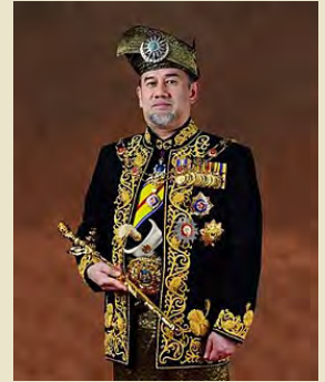
สมเด็จพระราชาธิบดี มาเลเซีย