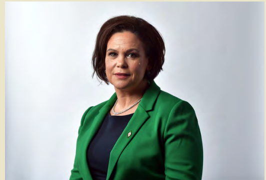
นางแมรี ฌู แม็คโดนัลด์

ทั้งนี้ การแต่งตั้งนางแม็คโดนัลด์ รองผู้นำพรรคชินน์ เฟน เท่ากับเป็นการยุติการเชื่อมโยงพรรคชินน์ เฟนกับกองทัพสาธารณรัฐไอริช หรือ IRA ซึ่งเป็นขบวนการของชนกลุ่มน้อยชาวไอริชที่ต่อสู้เรียกร้องเอกราชจากสหราชอาณาจักรด้วยการใช้วิธีการรุนแรงมาตั้งแต่เริ่มก่อตั้งองค์กรเมื่อปี ๒๕๑๒ เพื่อไปอยู่ร่วมกับไอร์แลนด์ จนทำให้มีผู้เสียชีวิตจากการก่อเหตุร้ายหลายรูปแบบ อาทิ การลอบสังหาร การปล้นธนาคาร และการวางระเบิดมากกว่า ๑,๗๐๐ คน