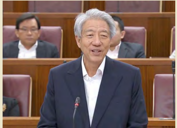
นายเตียว ซี เอียน

นายเอียน กล่าวว่า เศรษฐกิจของประเทศกำลังอยู่ในช่วงเปลี่ยนผ่าน รัฐบาลจึงตัดสินใจประเมินสถานการณ์สภาพเศรษฐกิจที่เปลี่ยนไปก่อน แทนที่จะเร่งตัดสินใจในตอนี้ และจะทบทวนมาตรการดังกล่าวอีกครั้งในอีก ๕ ปี ข้อเสนอดังกล่าวเป็นส่วนหนึ่งของมติให้พิจารณาเงินเดือนรัฐมนตรีทุก ๕ ปี ที่เริ่มใช้บังคับตั้งแต่ปี ๒๐๑๒ โดยรัฐบาลไม่เคยปรับขึ้นเงินเดือนอีกเลยนับตั้งแต่ปรับลงในปี ๒๐๑๒ หลังประชาชนกดดันรัฐบาล เพราะไม่พอใจที่รัฐมนตรีได้ค่าจ้างสูงเกินจำเป็น ทั้งนี้ เงินเดือนของนายกรัฐมนตรีสิงคโปร์อยู่ที่ ๑.๗ ล้านดอลลาร์สหรัฐ (ประมาณ ๕๓ ล้านบาท) ต่อปี ขณะที่รัฐมนตรีจะอยู่ที่ ๑.๑ ล้านดอลลาร์ (ประมาณ ๓๔ ล้านบาท)