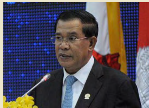
สมเด็จฮุนเซน

การเลือกตั้งสมาชิกวุฒิสภากัมพูชาจัดขึ้นทุก ๖ ปี แต่ประชาชนไม่ได้มีสิทธิในการเลือกตั้ง โดยมีที่นั่งทั้งหมด ๖๒ ที่นั่ง แต่เป็นการลงคะแนนเลือก ๕๘ ที่นั่ง ส่วน ๒ ที่นั่งเป็นการแต่งตั้งจากกษัตริย์กัมพูชาและอีก ๒ ที่นั่งแต่งตั้งจากสภาผู้แทนราษฎร