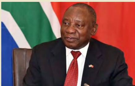
นายซีริล รามาโฟซา

วันที่ ๑๖ กุมภาพันธ์ ๒๕๖๑ รัฐสภาของประเทศแอฟริกาใต้ให้การรับรองนายซีริล รามาโฟซา รองประธานาธิบดี ที่เพิ่งได้รับเลือกเป็นหัวหน้าพรรคเอเอ็นซีเมื่อเดือนธันวาคมที่ผ่านมาให้เป็นประธานาธิบดีคนใหม่ แทนนายจาค็อบ ซูมา อดีตประธานาธิบดี ที่ชนะเลือกตั้งเป็นประธานาธิบดีแอฟริกาใต้ตั้งแต่ปี ๒๕๕๒ โดยนายซูมา ได้แถลงลาออกทางโทรทัศน์ ซึ่งได้ระบุว่า การลาออกของเขามีผลในทันที ทั้งนี้ เพื่อปฏิบัติตามมติของพรรคแอฟริกัน เนชั่นแนล คองเกรส (เอเอ็นซี)