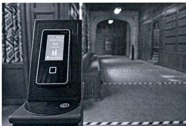
เครื่อง Pass-Reader ที่ติดตั้งอยู่ที่โถงทางเดินข้างห้องประชุม