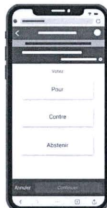
ตัวเลือกมติ เห็นชอบ ไม่เห็นชอบ งดออกเสียง