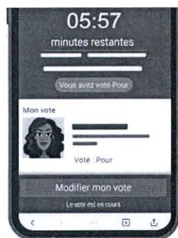
การยืนยันตัวตนด้วยรูปถ่าย