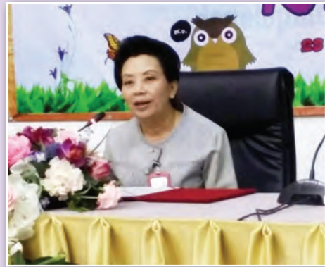
๒๓ กันยายน ๒๕๕๗ ณ อาคารสุขประพฤติ กรุงเทพฯ 23 September 2014, at Sookprapruet Building, Bangkok

สำนักงานเลขาธิการวุฒิสภา ปฏิบัติหน้าที่สำนักงานเลขาธิการสภานิติบัญญัติแห่งชาติ จัดโครงการพัฒนาองค์ความรู้ “กิจกรรมวันแห่งการเรียนรู้ (KM DAY)” เพื่อแลกเปลี่ยนเรียนรู้และถ่ายทอดประสบการณ์การทำงาน เพื่อนำความรู้ไปพัฒนาการปฏิบัติราชการให้มีประสิทธิภาพสูงสุด โดยมี นางนรรัตน์ พิมเสน เลขาธิการวุฒิสภา ปฏิบัติหน้าที่เลขาธิการสภานิติบัญญัติแห่งชาติ เป็นประธานในพิธี