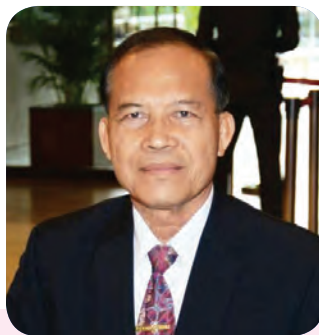
๒. พลโท จเรศักดิ์ อานุภาพ สมาชิกลำดับที่ ๔๒