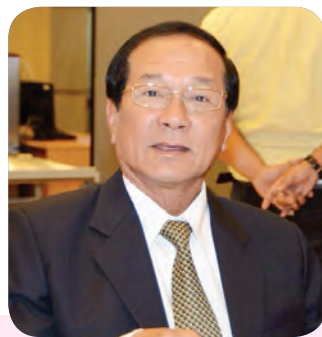
๒๖. พลเอก อรุณ สมตนะ สมาชิกลำดับที่ ๒๑๘