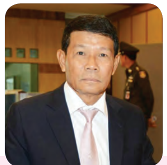
๑๒. พลเอก โปฏก บุนนาค สมาชิกลำดับที่ ๒๐๔