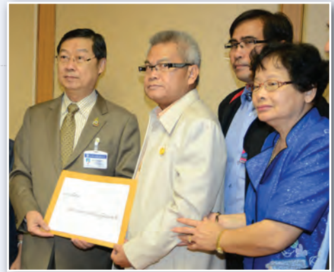
๒๔ กันยายน ๒๕๕๗ ณ อาคารรัฐสภา ๒ กรุงเทพฯ 24 September 2014, at Parliament building 2, Bangkok