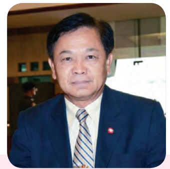
๒๐. พลเอก ศุภวุฒิ อุตมะ สมาชิกลำดับที่ ๒๑๒