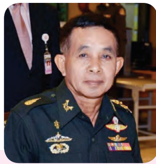
๑๘. พลเอก วินัย สร้างสุขดี สมาชิกลำดับที่ ๒๑๐