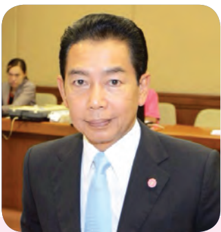
๒๕. พลตรี อภิรัชต์ คงสมพงษ์ สมาชิกลำดับที่ ๒๑๗