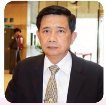
๑๖. พลเอก ยุทธศิลป์ โดยชื่นงาม สมาชิกลำดับที่ ๒๐๘