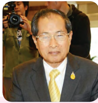
๒๒. พลเอก สุนทร ขำมงคล สมาชิกลำดับที่ ๒๑๔