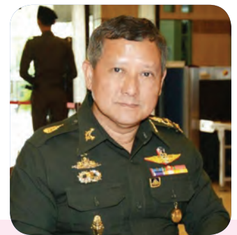
๒๘. พลเอก อุทิศ สุนทร สมาชิกลำดับที่ ๒๒๐