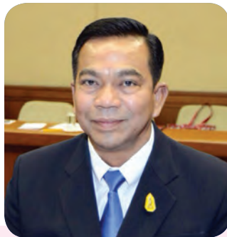
๖. พลตรี ญัฐ อินทเจริญ สมาชิกลำดับที่ ๑๙๑