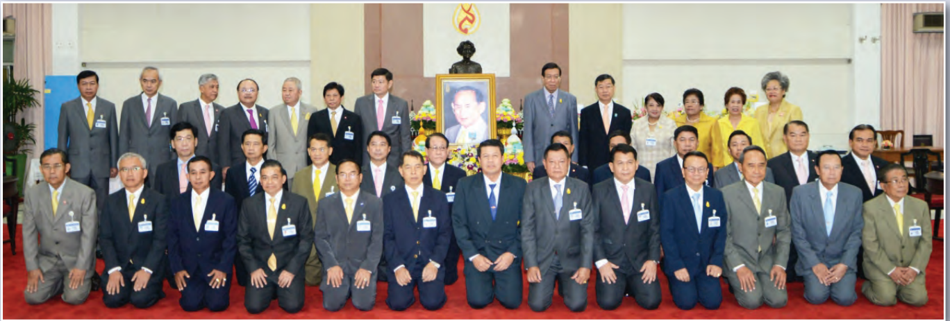
๕ - ๗ ตุลาคม ๒๕๕๗ ณ โรงพยาบาลศิริราช กรุงเทพฯ 5 - 7 September 2014, at Siriraj Hospital, Bangkok