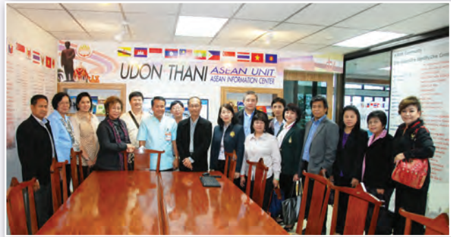
๑๙ - ๒๑ กันยายน ๒๕๕๗ ณ จังหวัดอุดรธานี 19 - 21 September 2014, in Udon Thani Province

นางนรรัตน์ พิมเสน เลขาธิการวุฒิสภา ปฏิบัติหน้าที่เลขาธิการสภานิติบัญญัติแห่งชาติ นำคณะผู้บริหารของสำนักงานเลขาธิการวุฒิสภา ศึกษาดูงานเกี่ยวกับกิจกรรมผู้นำต้นแบบตามประมวลจริยธรรมข้าราชการรัฐสภาและธรรมาภิบาล