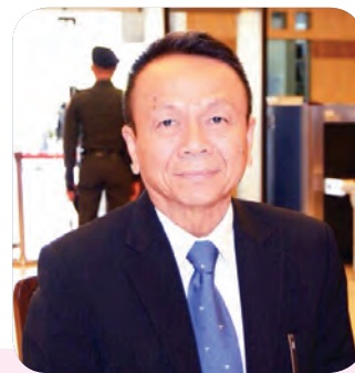
๒๗. พลเอก อุดมชัย ธรรมสาโรรัชต์ สมาชิกลำดับที่ ๒๑๙