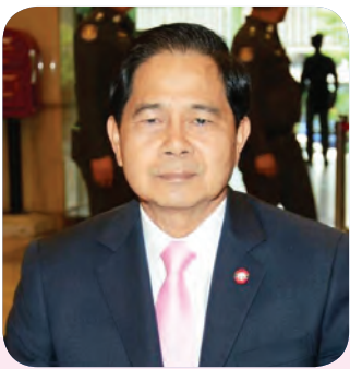
๑๗. พลเอก รัชสาทรย์ แซ่มะเชื้อ สมาชิกลำดับที่ ๒๐๙