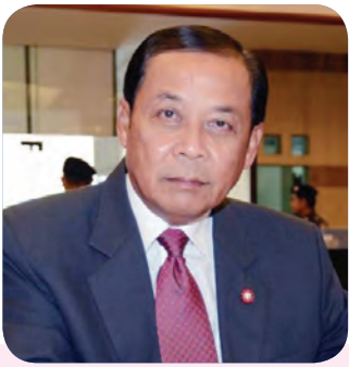
๒๑. พลเรือเอก ศักดิ์สิทธิ์ เขตบุญเมือง สมาชิกลำดับที่ ๒๑๓