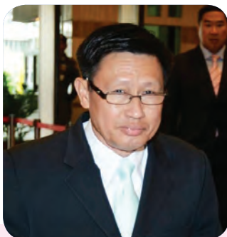
๙. พลโท เทพพงศ์ ทิพยจันทร์ สมาชิกลำดับที่ ๒๐๑