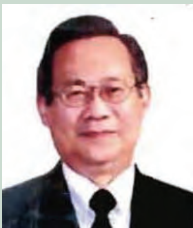
ศาสตราจารย์เมธี ครองแก้ว