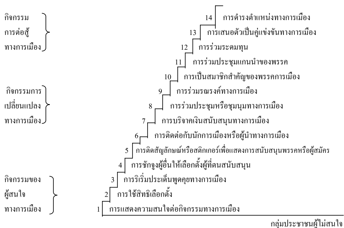
กระบวนการ ขั้นตอน การมีส่วนร่วมของประชาชน

2.2.1.2 ปารีชาติ วลัยเสถียร (2542 : 138 - 139) ให้ความหมายของการมีส่วนร่วมในการปกครองใน 2 ลักษณะ คือ