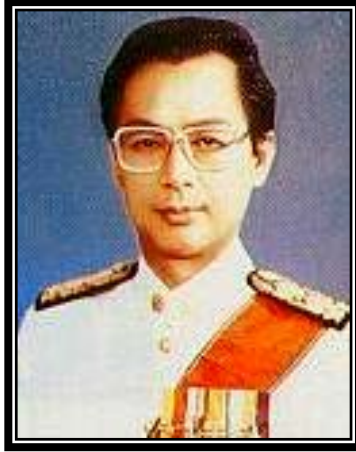
นายชวน หลีกภัย นายกรัฐมนตรี