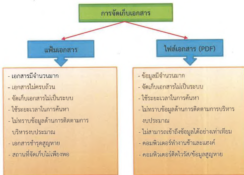
ภาพที่ 3 แสดงปัญหาในการจัดเก็บเอกสารของกลุ่มงานคณะกรรมการศึกษาการจัดทำและติดตามการบริหารงบประมาณ

นอกจากปัญหาดังกล่าวข้างต้น การสนับสนุนภารกิจของคณะกรรมการติดตามการบริหารงบประมาณที่ผ่านมายังขาดการบูรณาการ และขาดการพัฒนาาระบบเทคโนโลยีสารสนเทศและการสื่อสาร หรือการพัฒนาฐานข้อมูลที่น่าเชื่อถือได้ ถูกต้อง เป็นปัจจุบันและตรงตามความต้องการของคณะกรรมการ เพื่อสนับสนุนภารกิจของคณะกรรมการให้มีประสิทธิภาพ ก้าวหน้า ทันสมัย และครอบคลุมภารกิจของคณะกรรมการ ดังจะเห็นได้จากหน้าเว็บไซต์ของคณะกรรมการติดตามการบริหารงบประมาณ สภาผู้แทนราษฎร ที่ผ่านมามีข้อมูลเพียงเล็กน้อย ไม่ครบถ้วน สมบูรณ์ ข้อมูลไม่เป็นปัจจุบันและไม่ทันสมัย