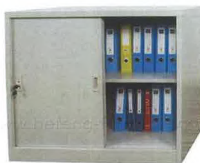
ภาพที่ 2 ระบบการจัดเก็บเอกสารกระดาษเข้าตู้เอกสารแบบเดิม