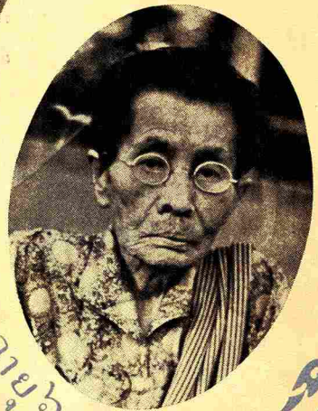
อายุ ๖๗ ปี