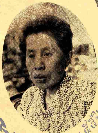
อายุ ๕๕ ปี