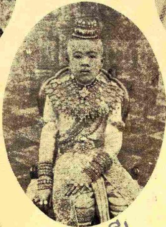
อายุ ๑๓ ปี