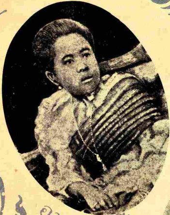
อายุ ๒๐ ปี