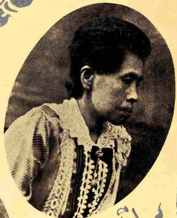
อายุ ๔๗ ปี