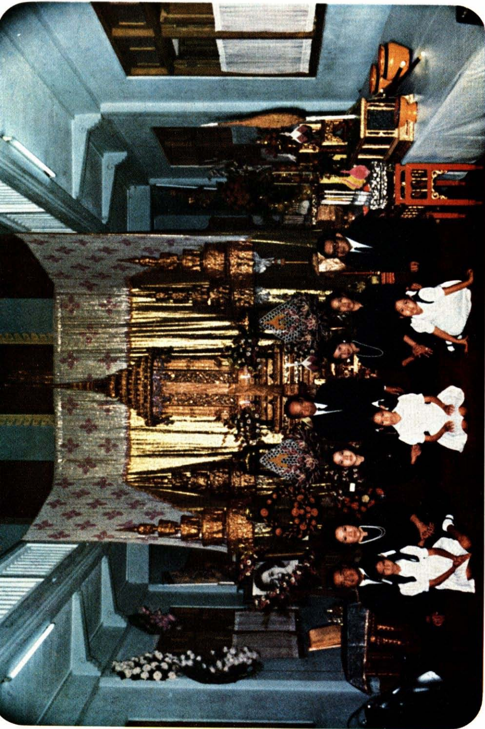
รูปหมู่หน้าโกศศพ ม.จ. กมดปราชญ์ เทวกุล ณ หอสมุด ป. กิตติวัน วัดเบญจมบพิตรฯ