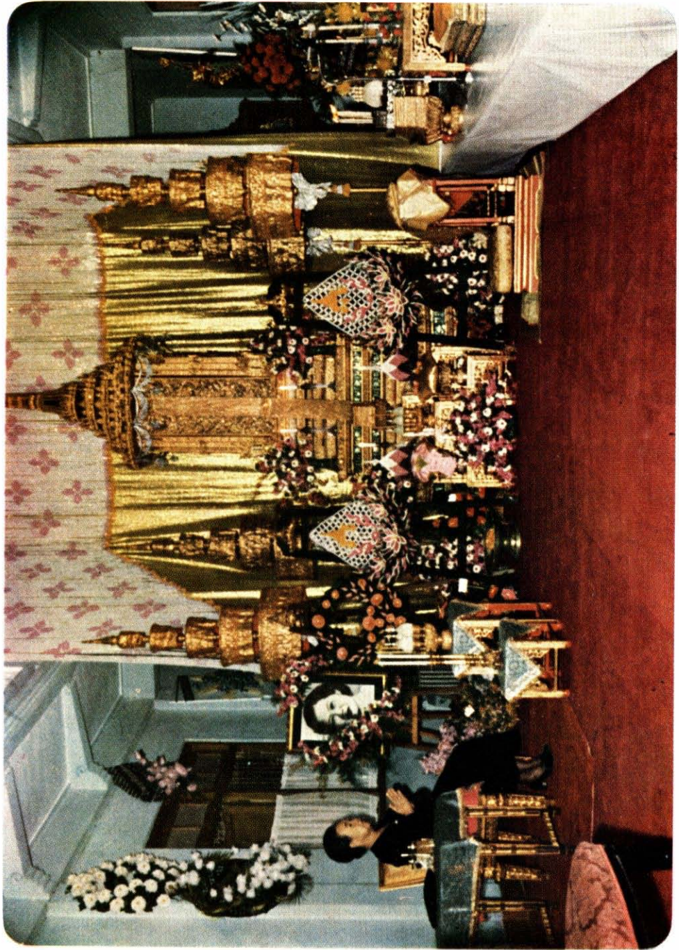
สมเด็จพระนางเจ้ารำไพพรรณี พระบรมราชินีในรัชกาลที่ ๗ ประทับเป็นประธานในโอกาสที่ทรงพระกรุณาโปรดเกล้าฯ